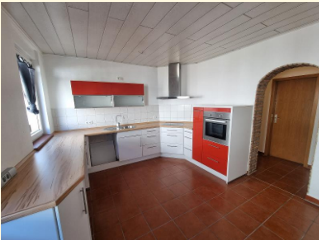
10 - Wohnküche. Weitwinkel