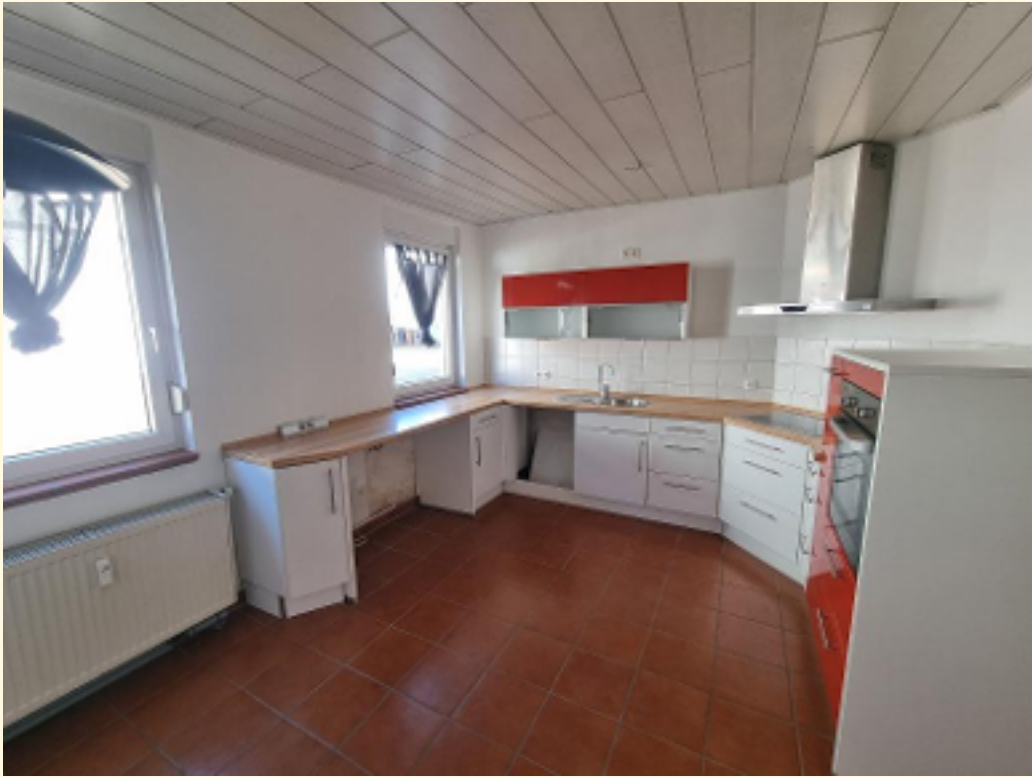
11 - Wohnküche, Weitwinkel