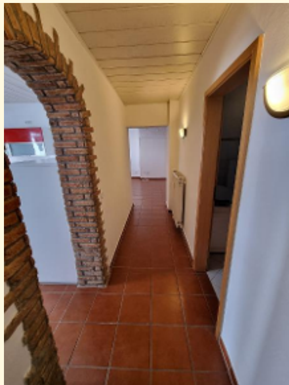
08 - Flur