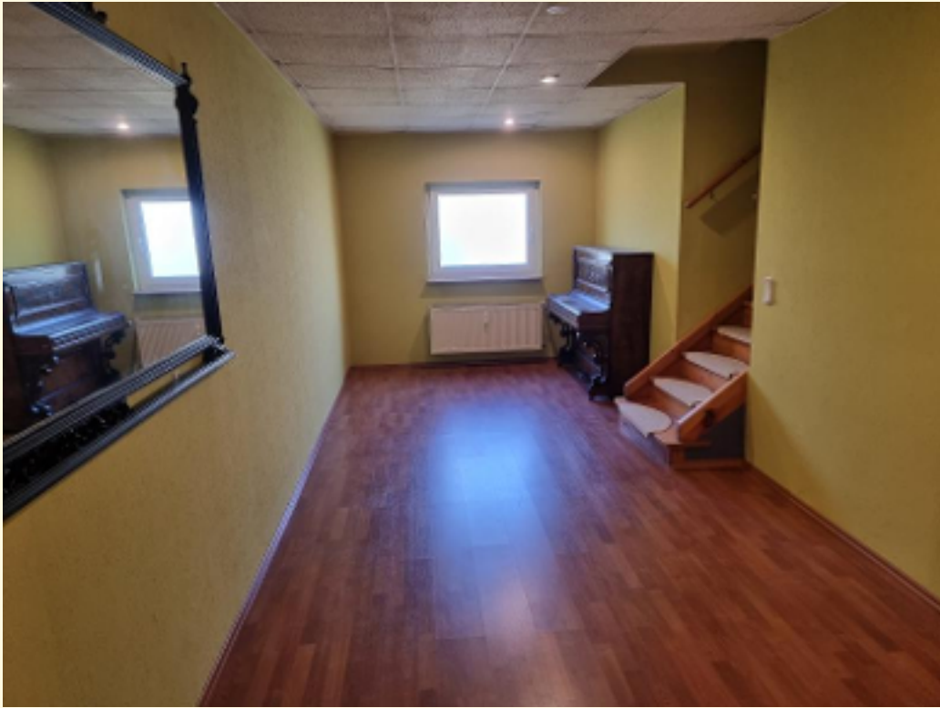
16 - Durchgangszimmer