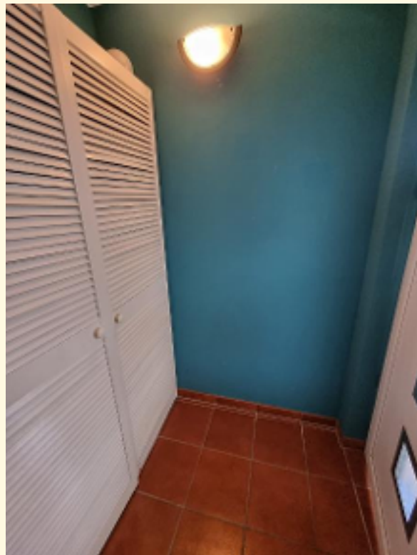
03 - Windfang