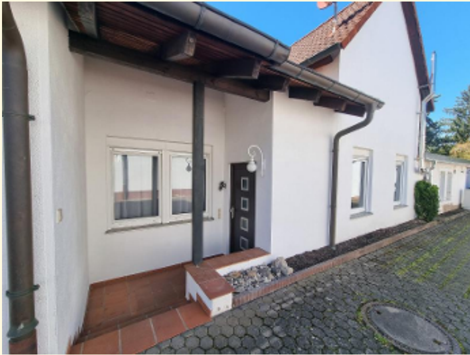
01 - Außenansicht