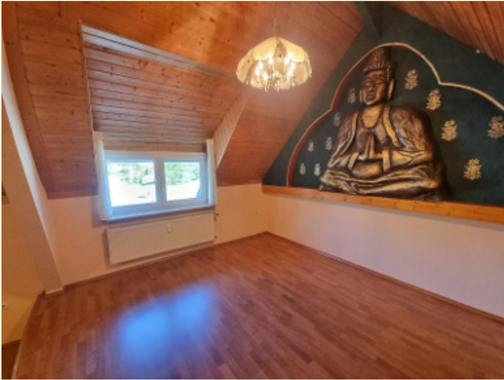
22 - Obere Ebene Weitwinkel