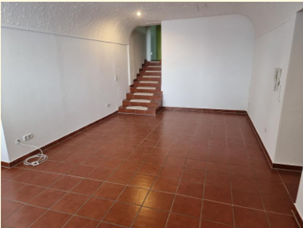
06 - Wohn-Esszimmer