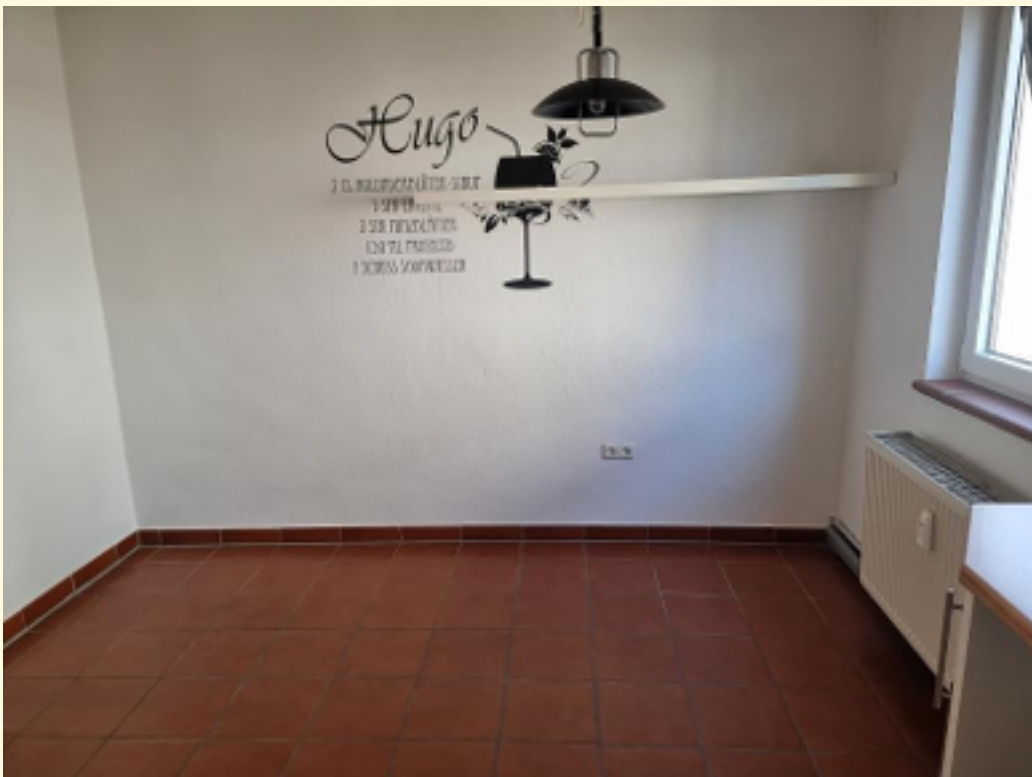
12 - Wohnküche