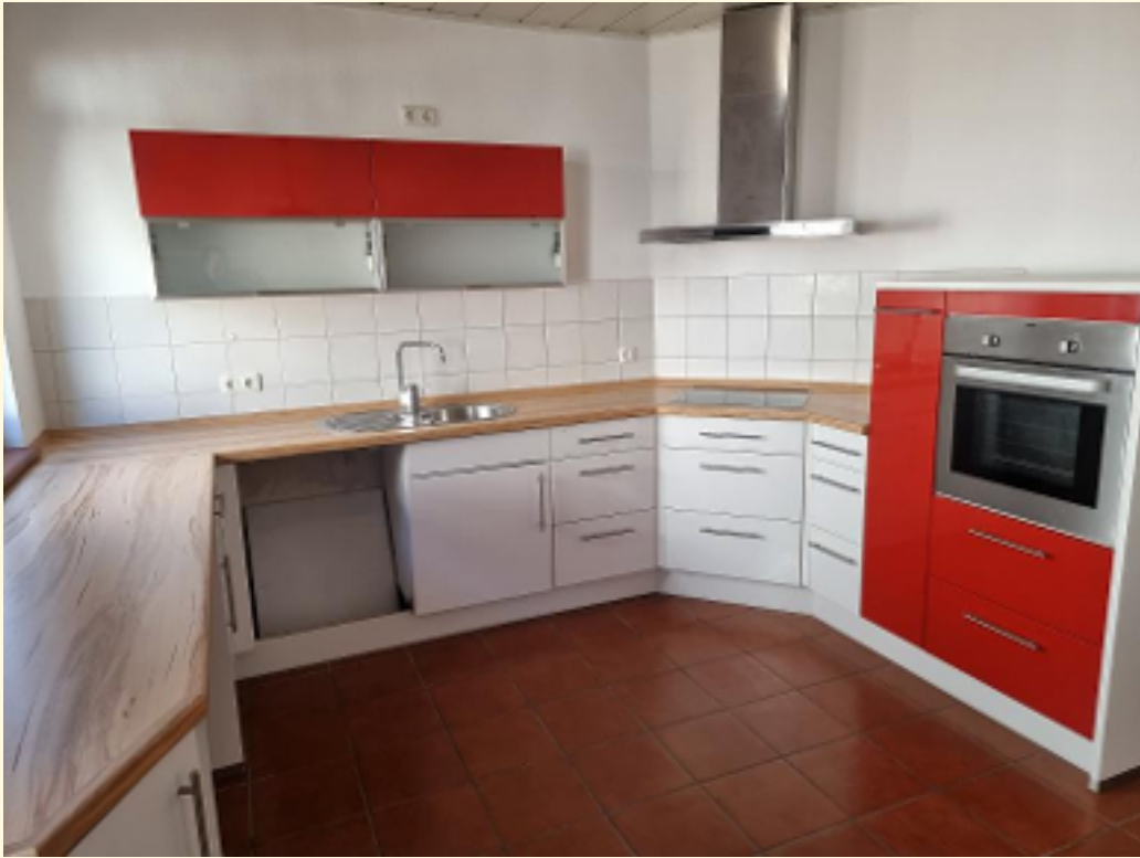
09 - Wohnküche