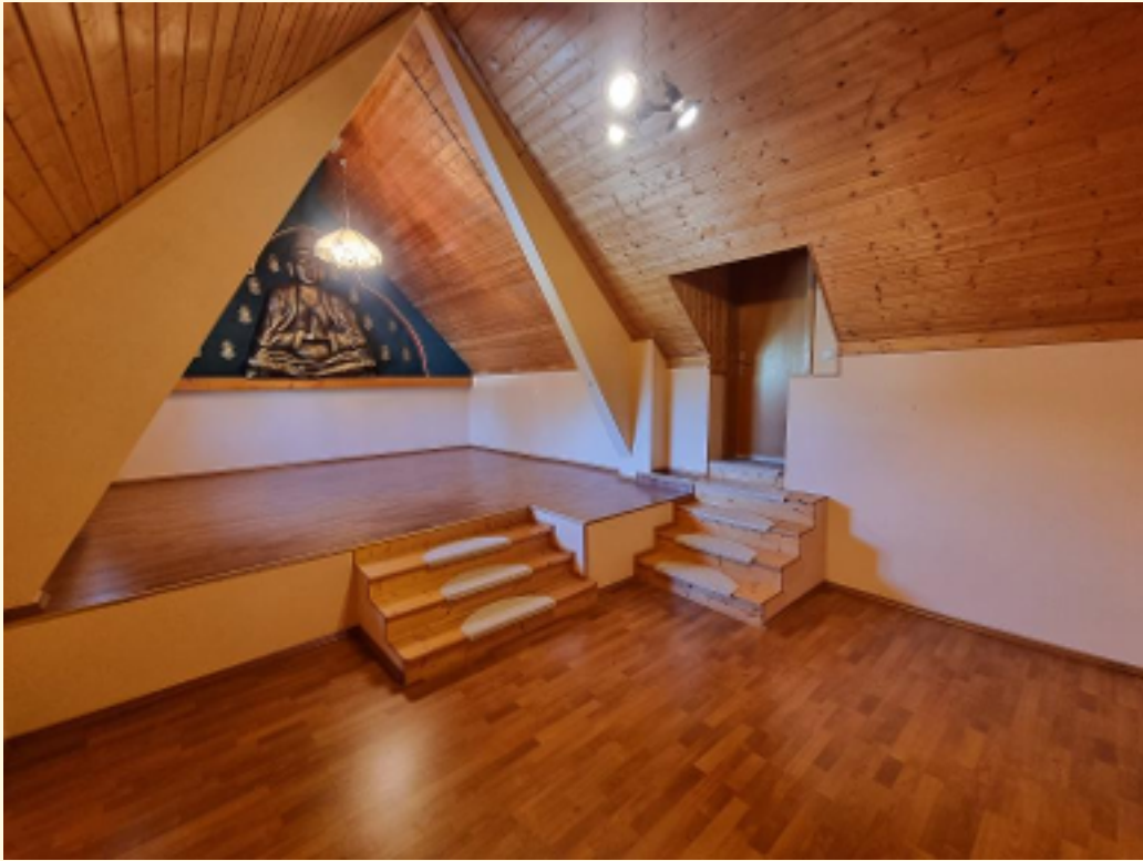
20 - Schlafzimmer Weitwinkel