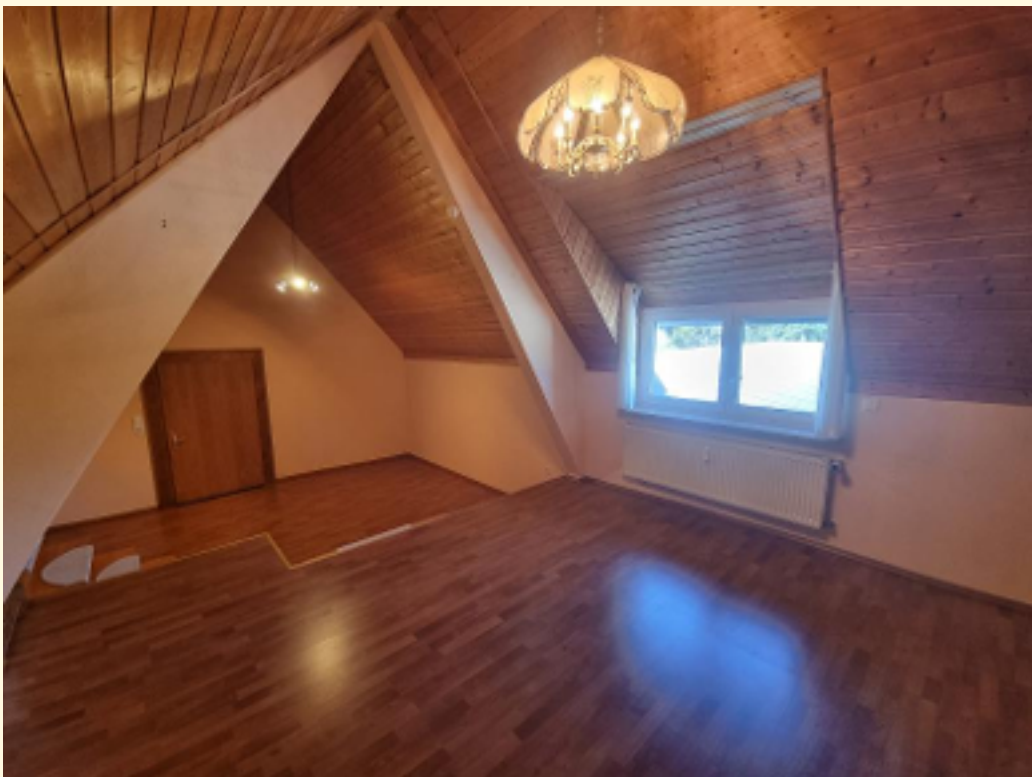
25 - Schlafzimmer Weitwinkel