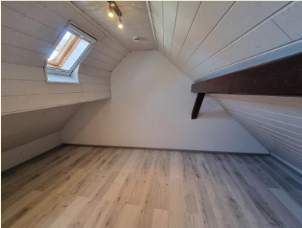
26 - Halbes Zimmer Weitwinkel