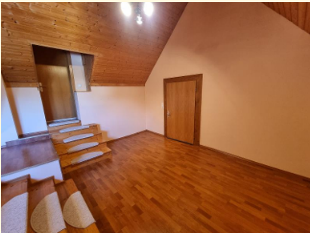
21 - Untere Ebene Weitwinkel