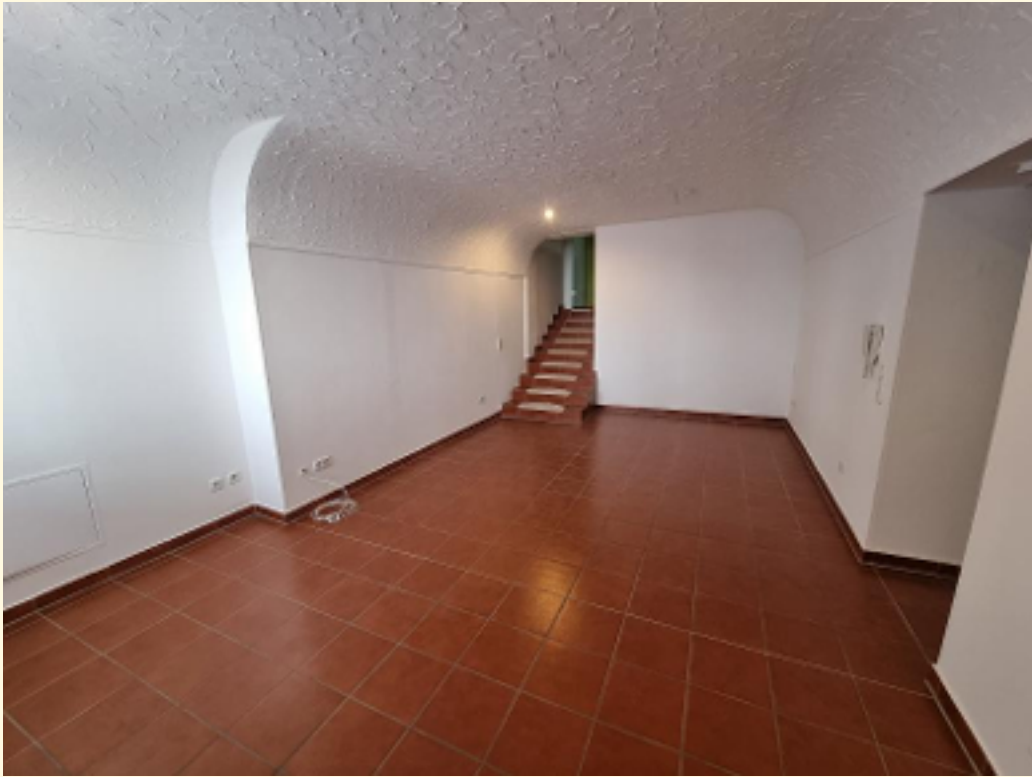
07 - Wohn-Esszimmer Weitwinkel