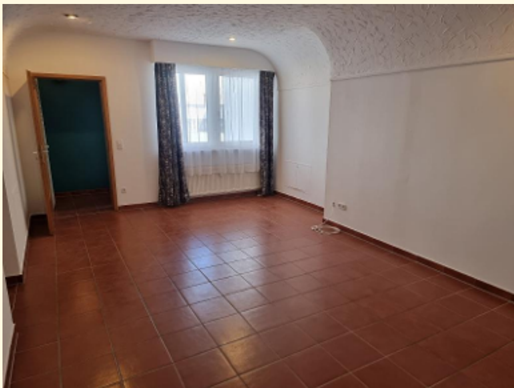
04 - Wohn-Esszimmer