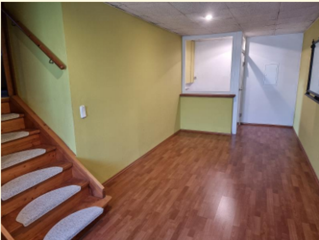
17 - Durchgangszimmer