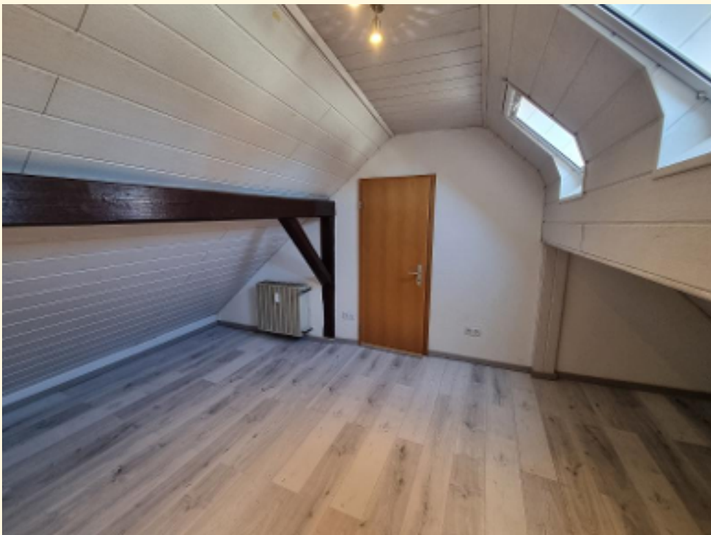
27 - Halbes Zimmer Weitwinkel