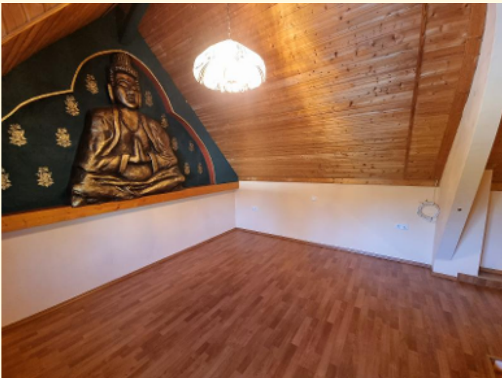
23 - Obere Ebene Weitwinkel