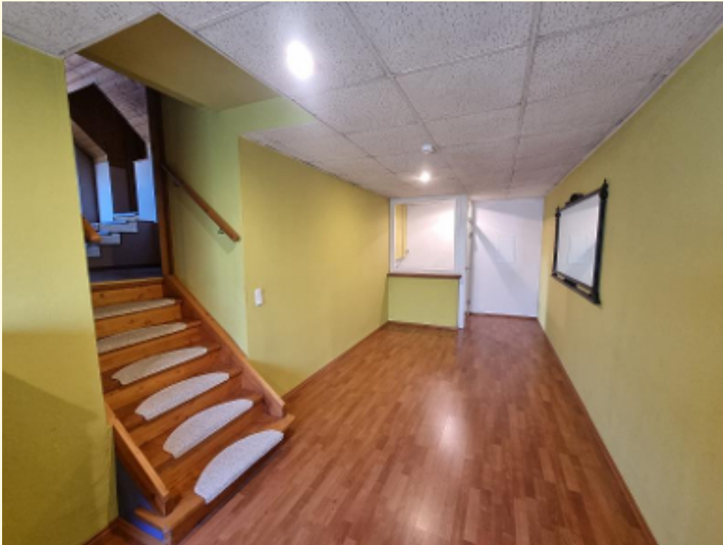
18 - Weitwinkel Durchgangszimmer