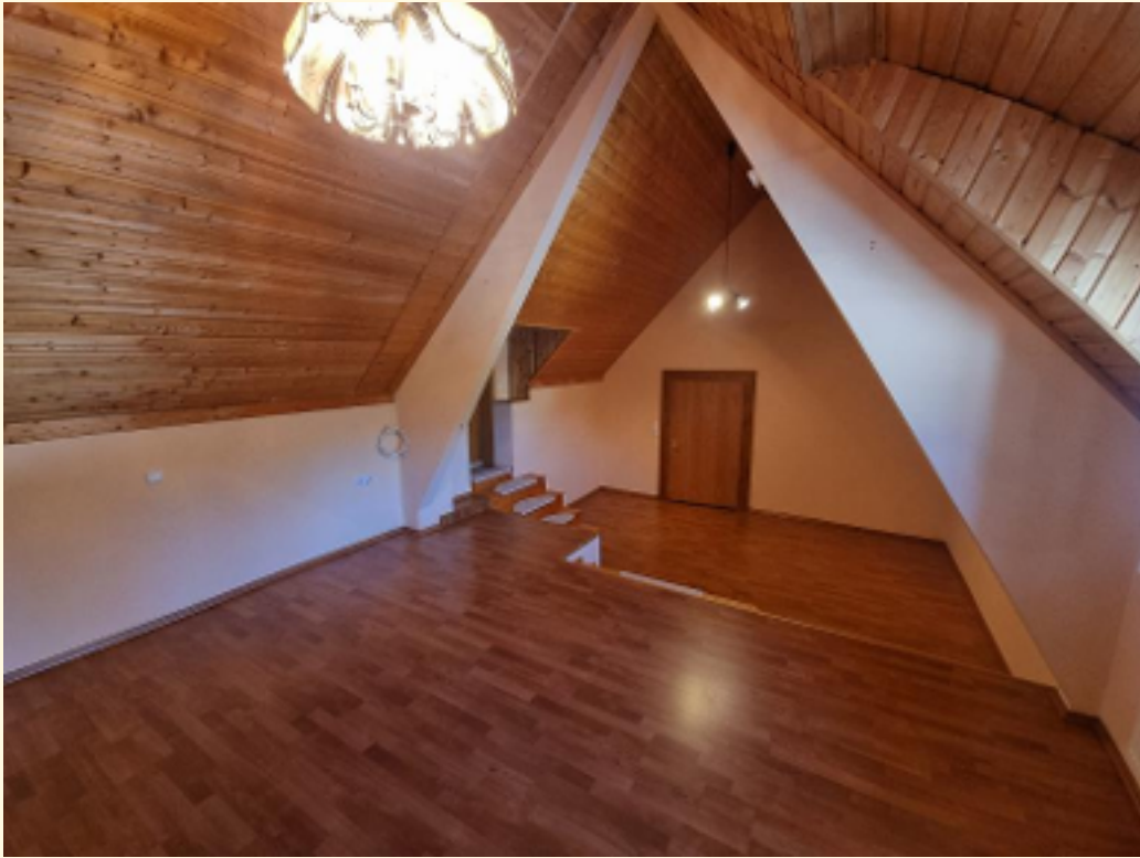
24 - Schlafzimmer Weitwinkel