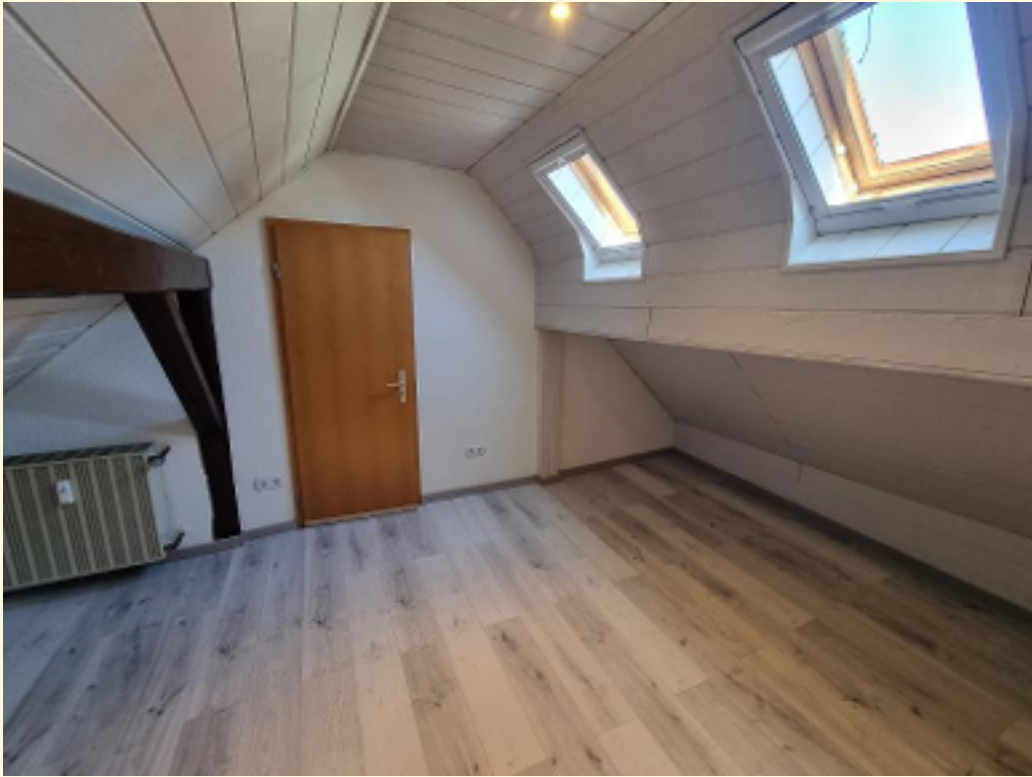
28 - Halbes Zimmer Weitwinkel