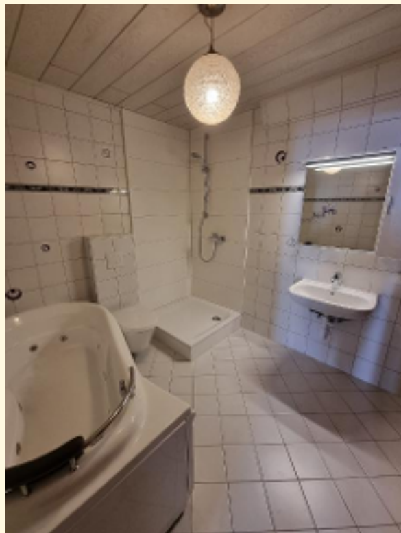
13 - Badezimmer