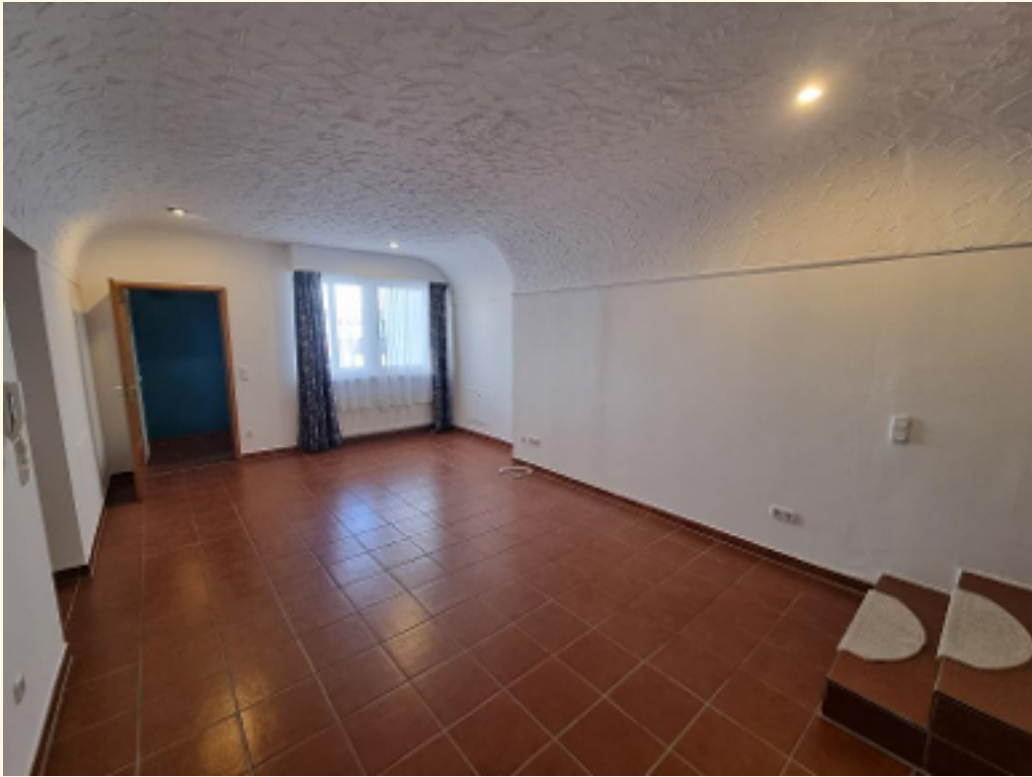
05 - Wohn-Esszimmer Weitwinkel