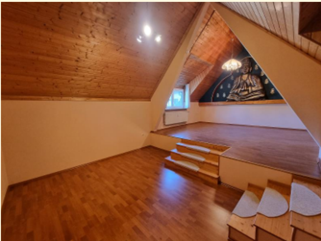
19 - Schlafzimmer Weitwinkel