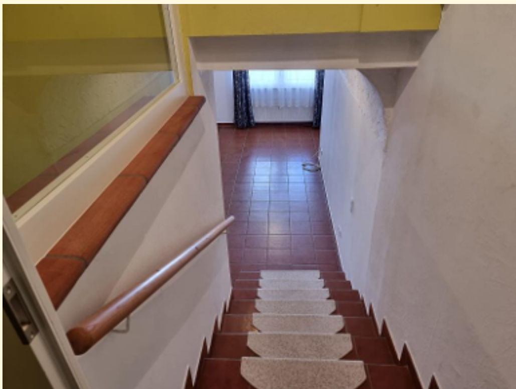
15 - Treppe EG zu OG