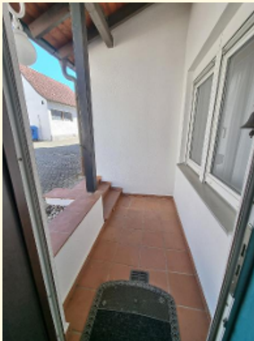
02 - Überdachter Außenbereich