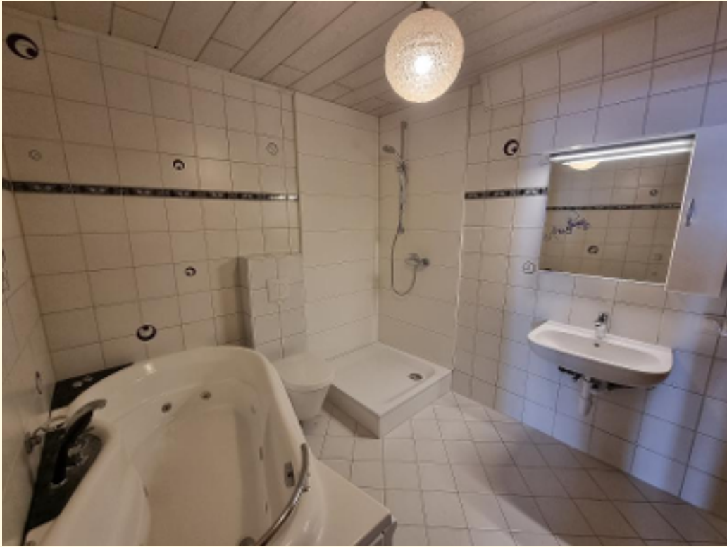
13 - Badezimmer b