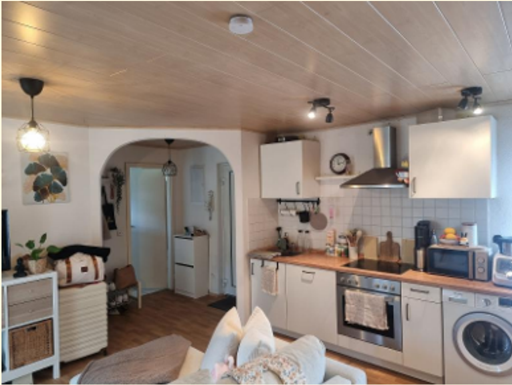
07 - Offene Küche