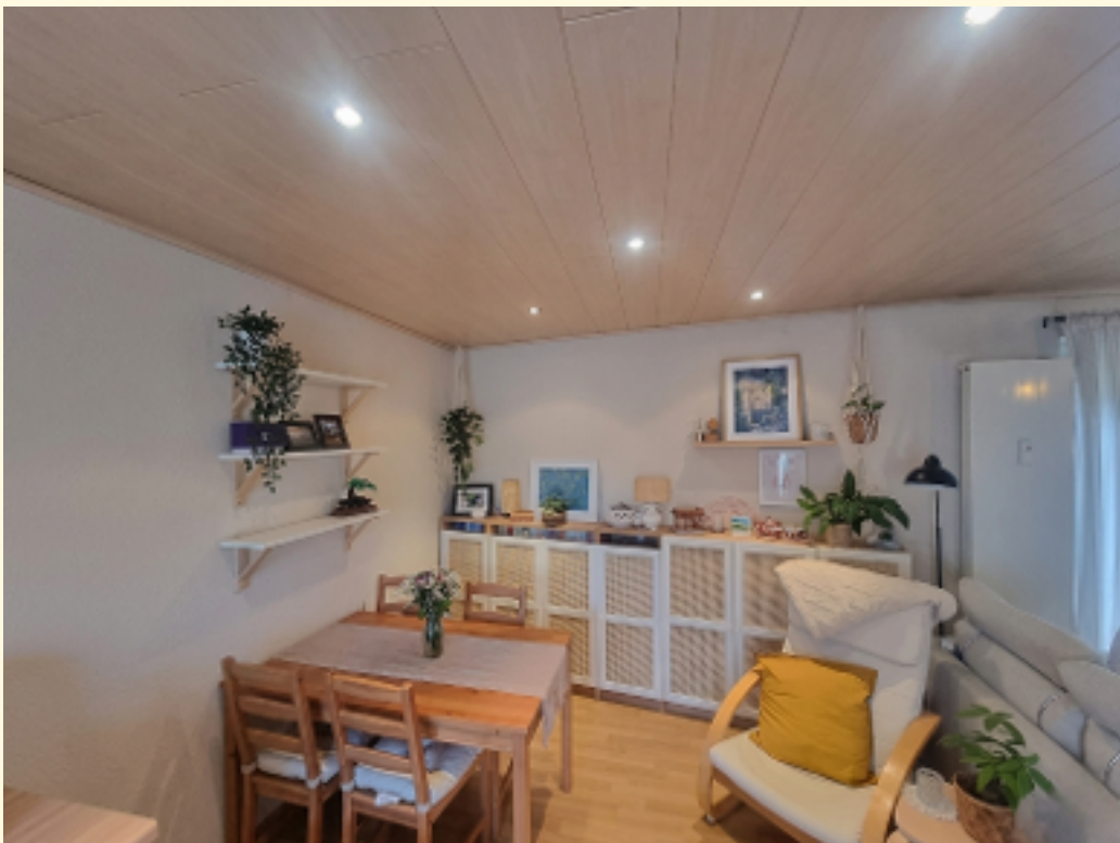
06 - Essbereich