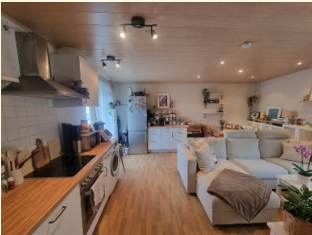
02 - Wohn-Esszimmer 2