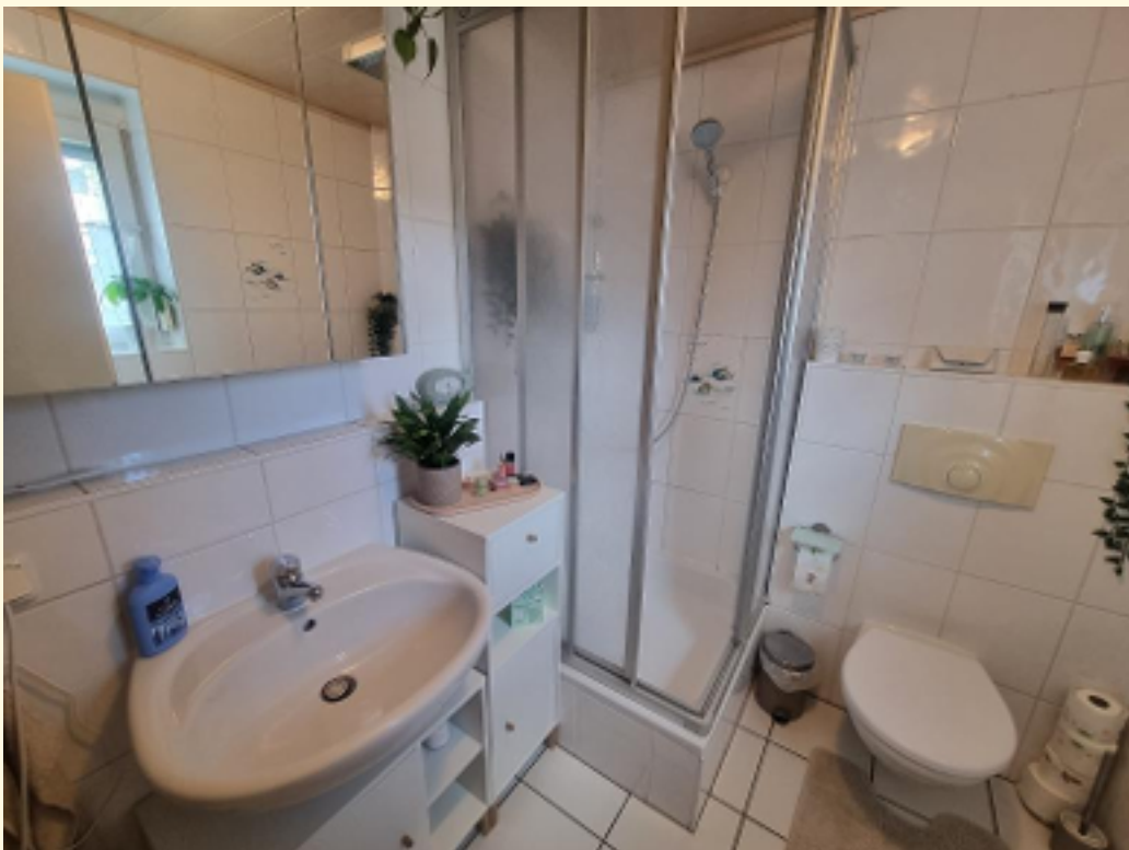
08 - Badezimmer