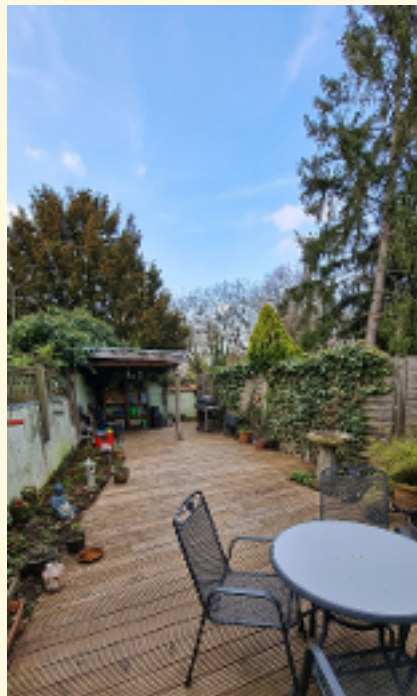
Beispiel aufgeräumte Terrasse