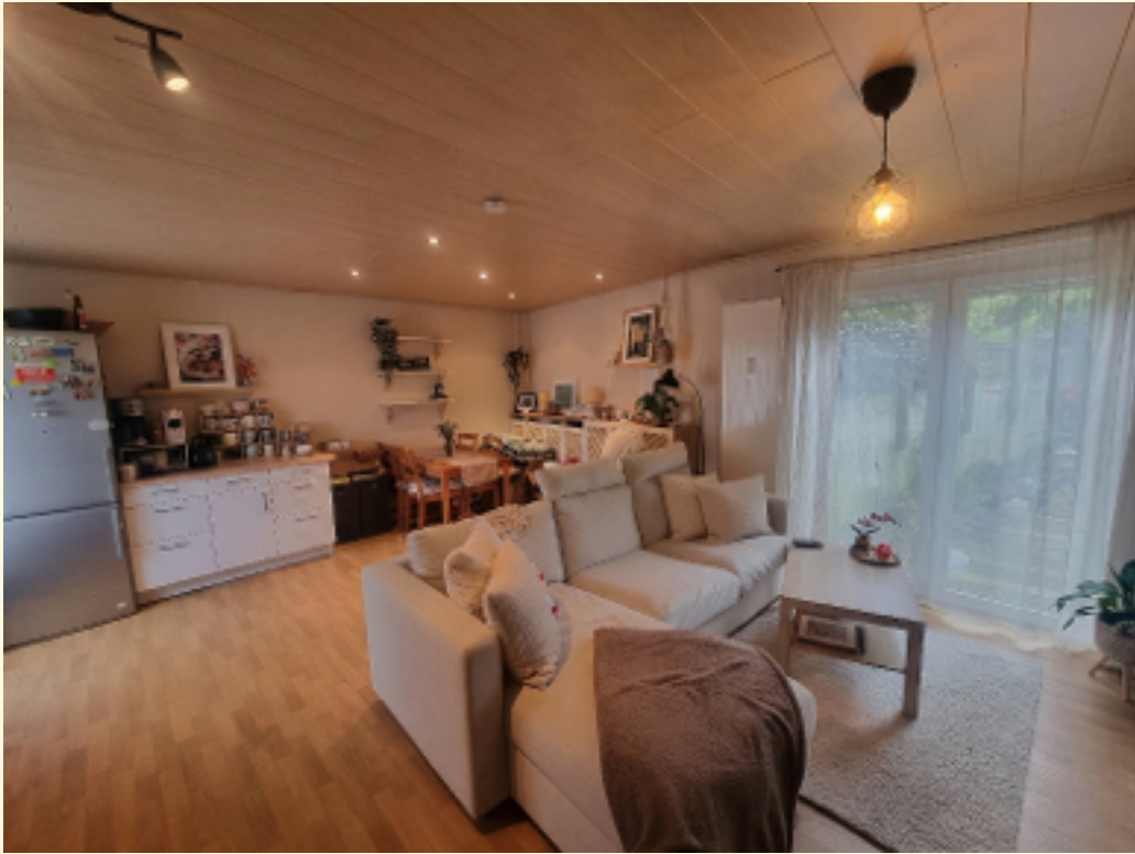
01 - Wohn-Esszimmer