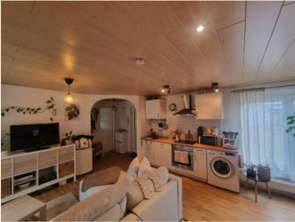
03 - Wohn-Esszimmer 3