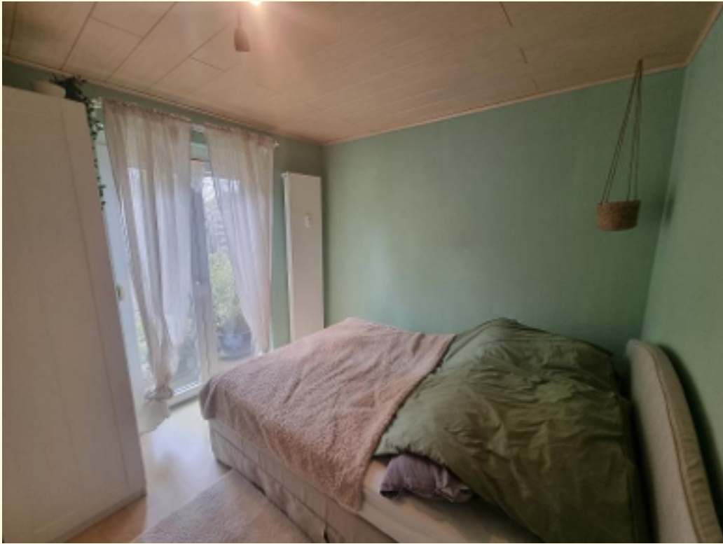
09 - Schlafzimmer