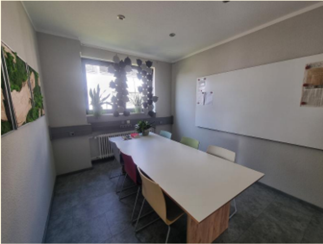
03 - Besprechung