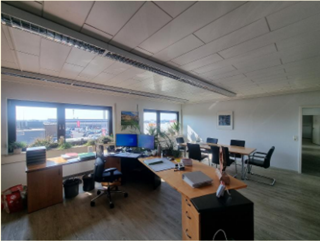
21 - Großraumbüro b