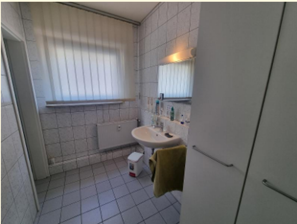
18 - Sanitär