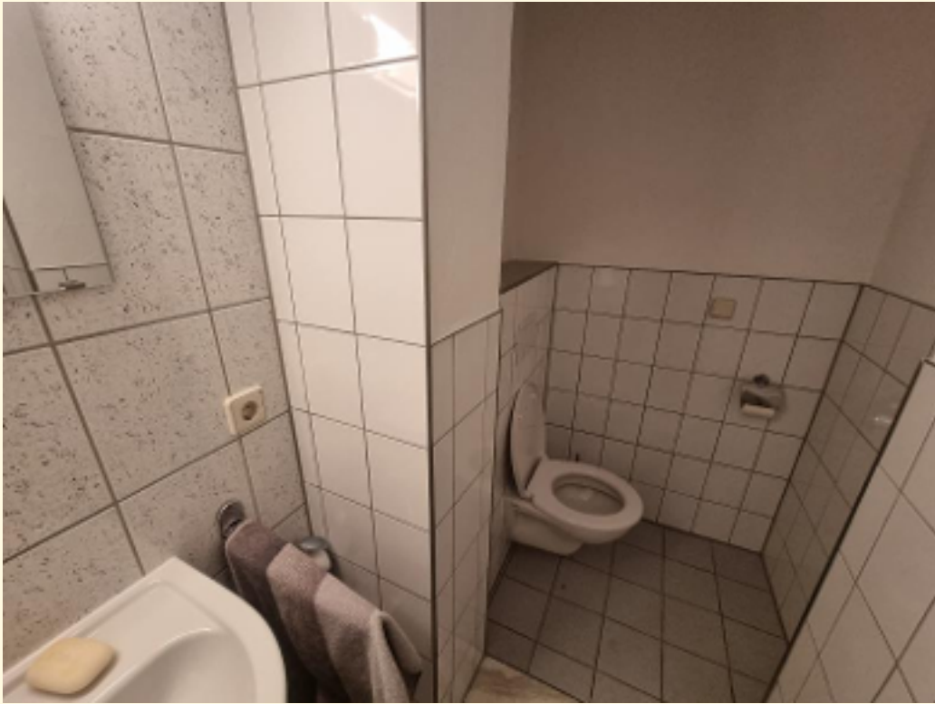
19 - Sanitär