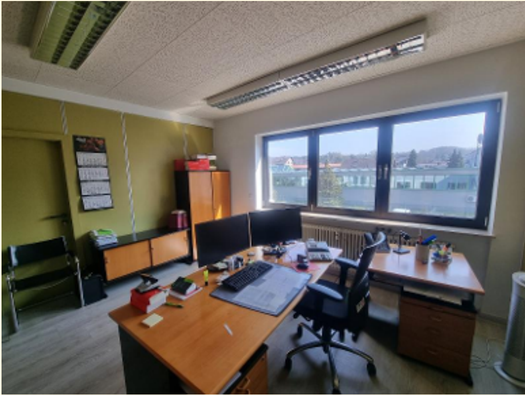
05 - Büroraum 2