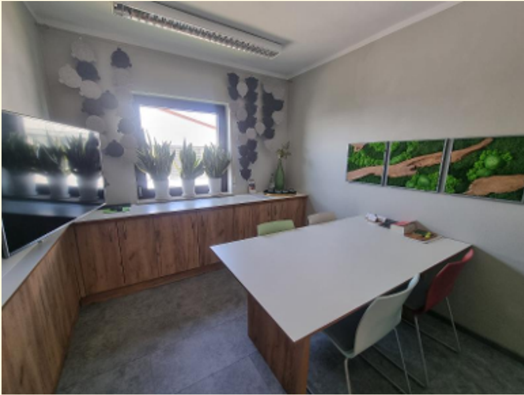
11 - Besprechung 2