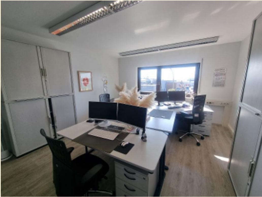
13 - Büroraum 7b