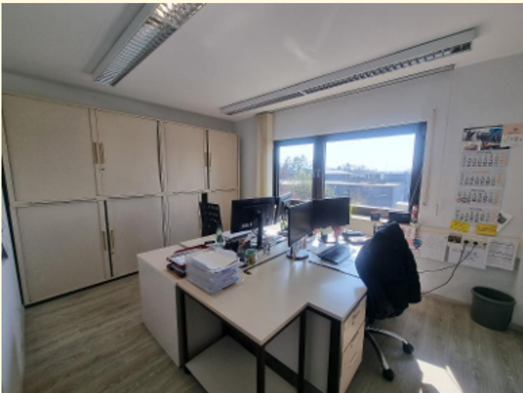
16 - Büroraum 8