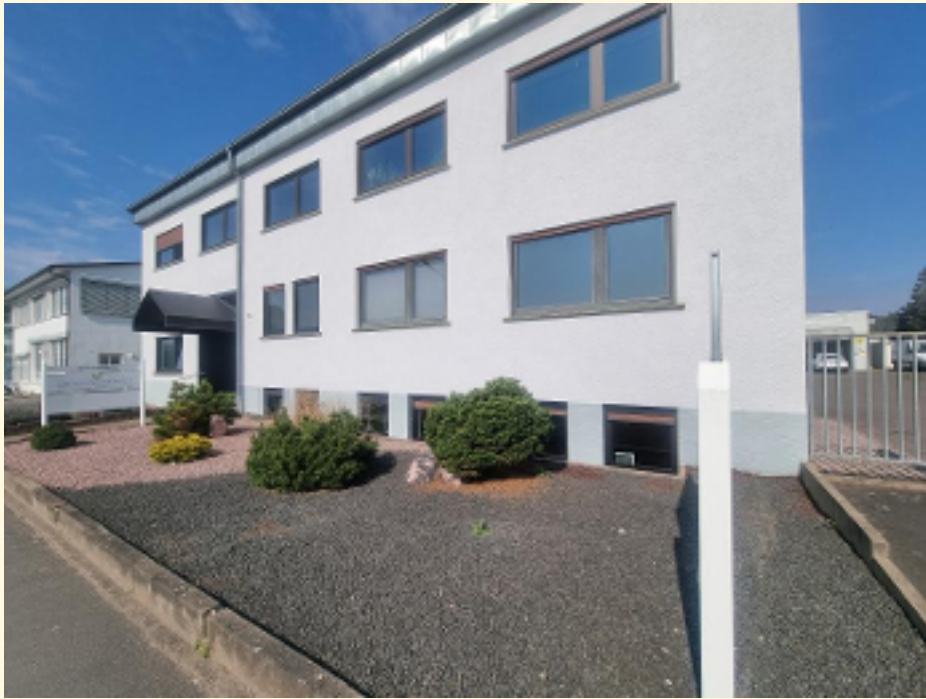
00 - Aussenansicht