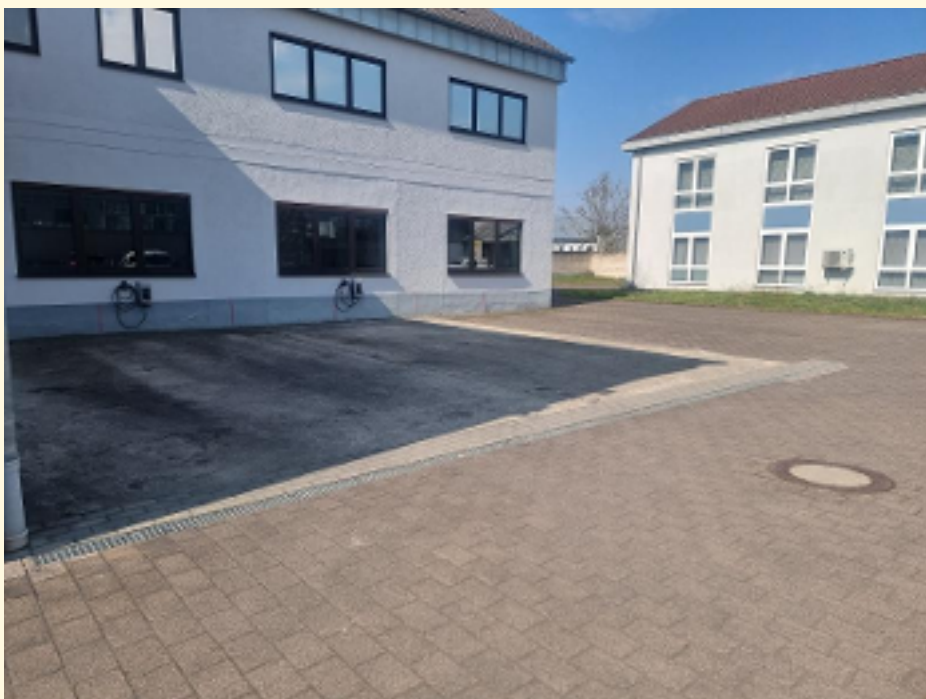
00 - Stellplätze+Wallbox