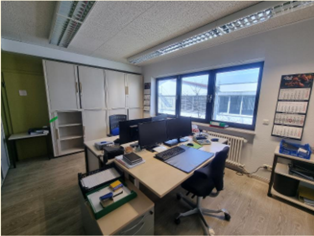
09 - Büroraum 5