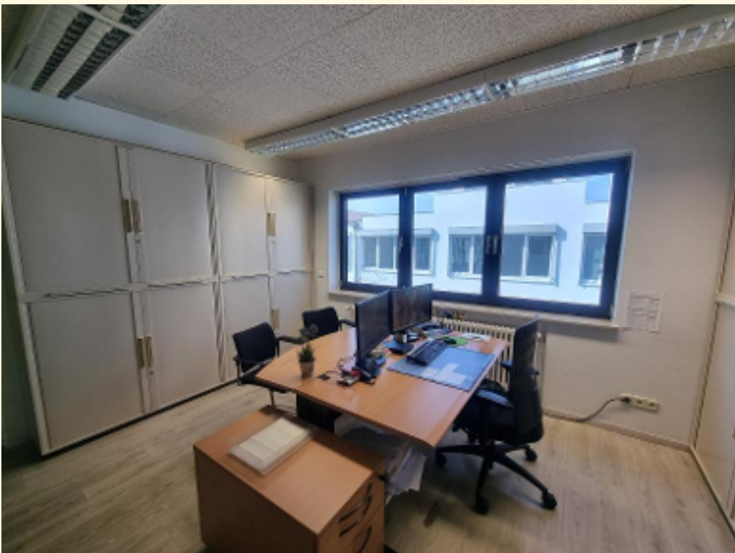
08 - Büroraum 4