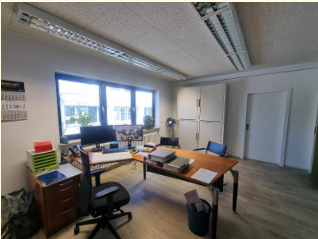
10 - Büroraum 6