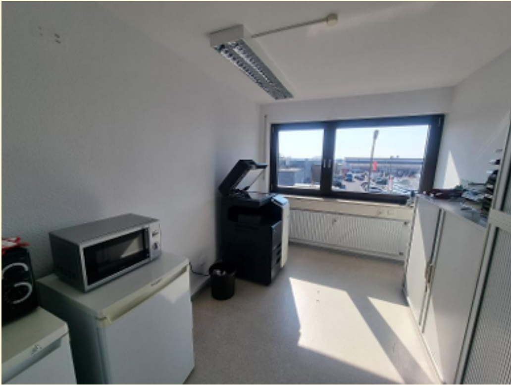
15 - Küchenanschlüsse Kopyerraum