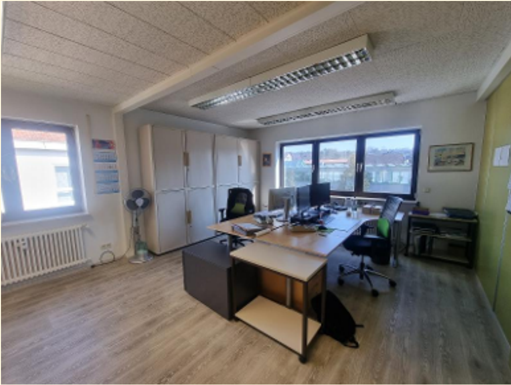
07 - Büroraum 3b