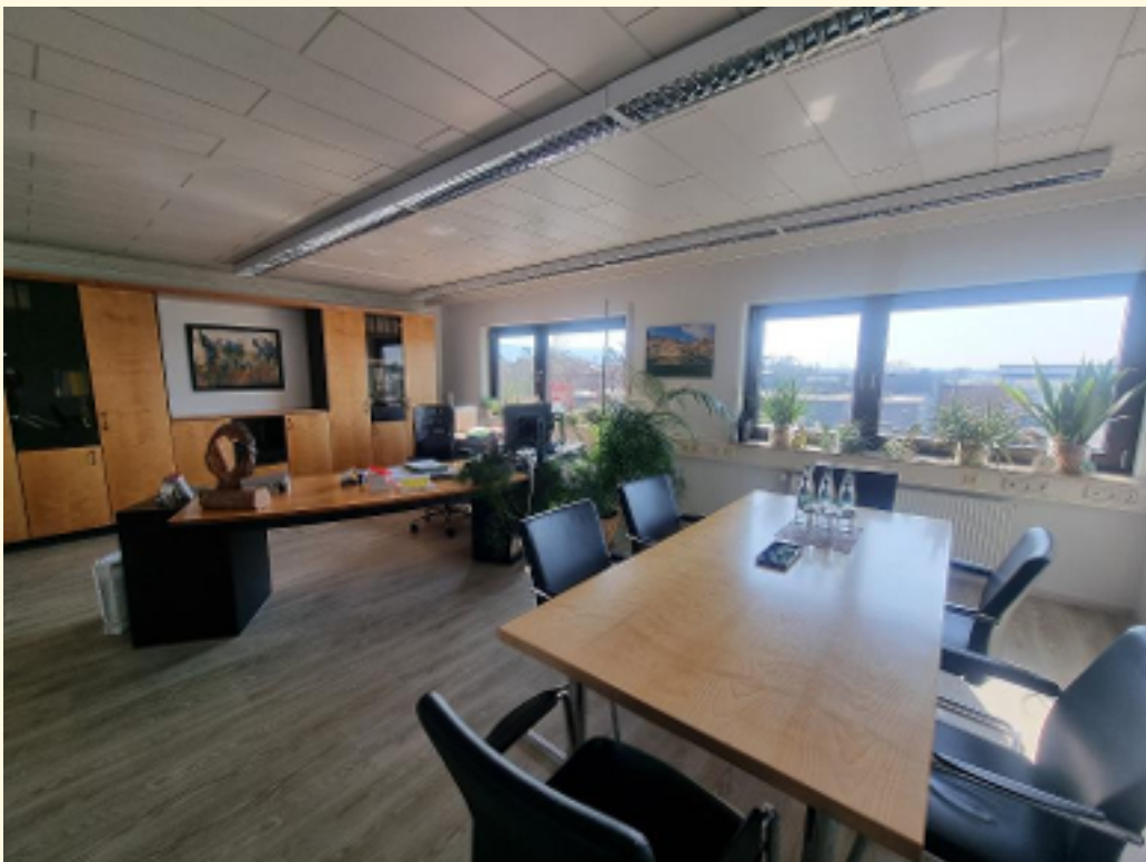
20 - Großraumbüro