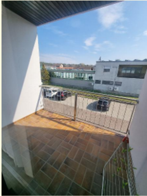
23 - Loggia