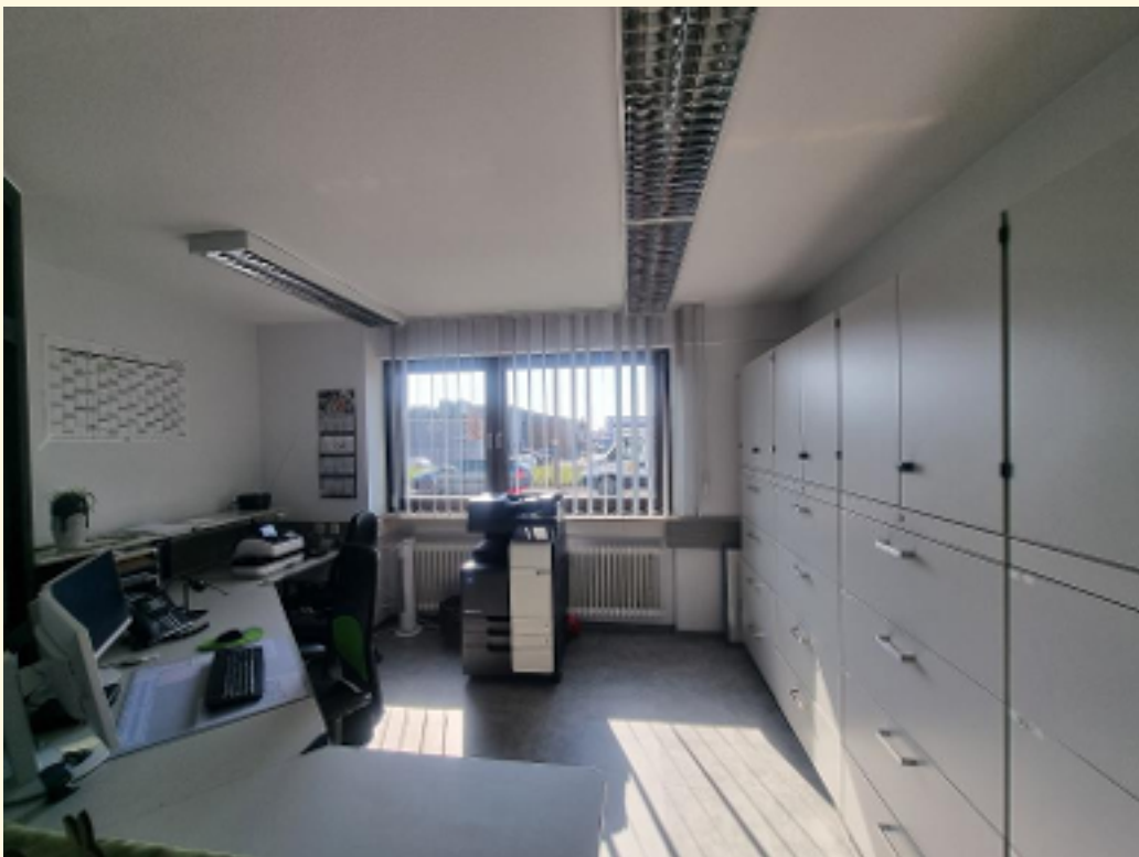
02 - Anmeldung