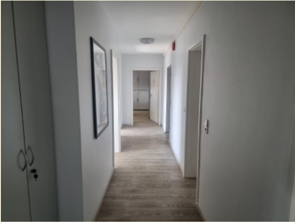
17 - Flur