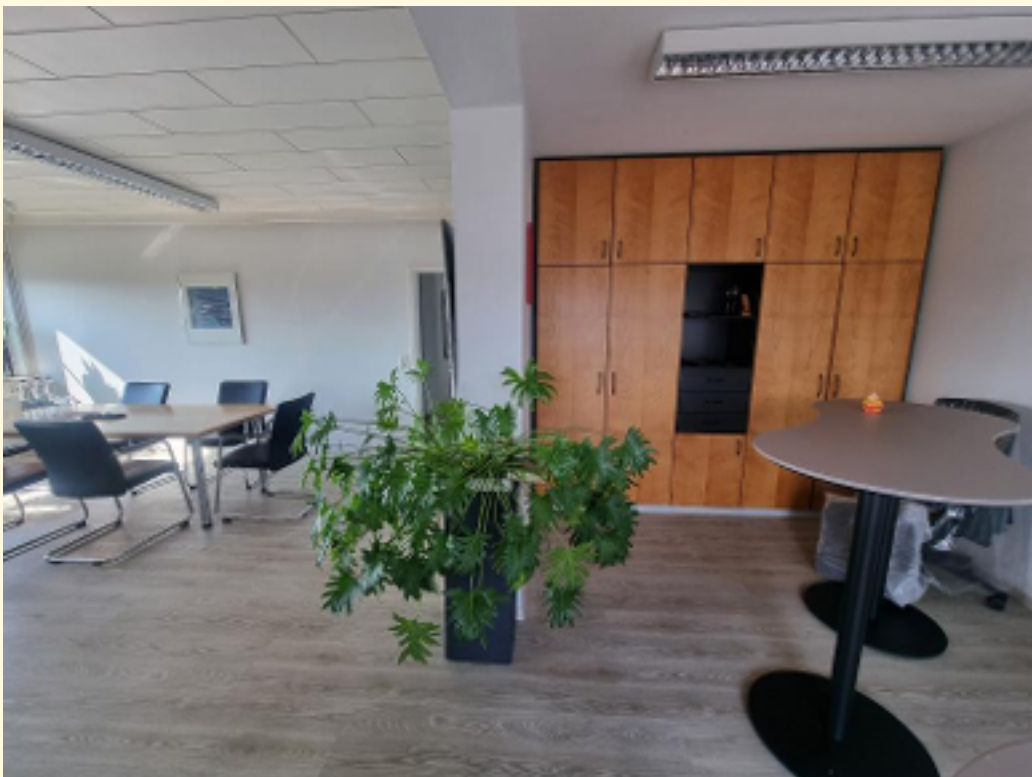
22 - Großraumbüro c