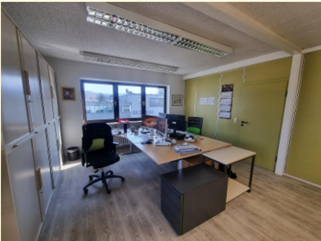
06 - Büroraum 3