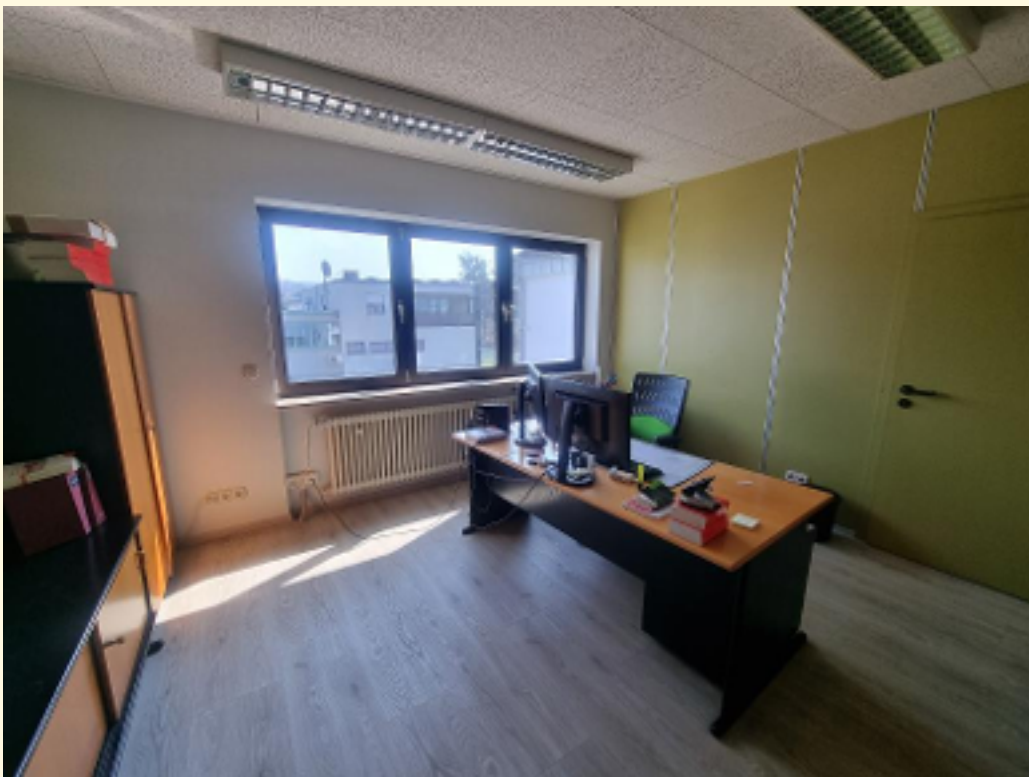
04 - Büroraum 1