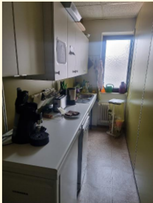
14 - Küchenpantry