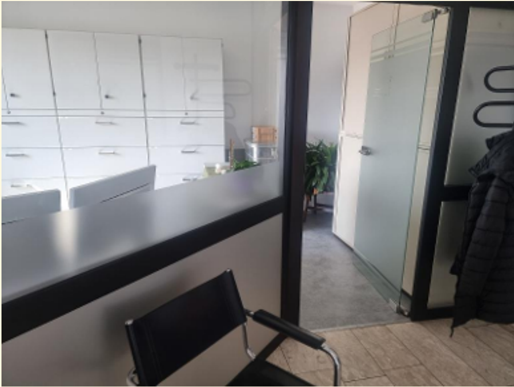
01 - Anmeldung