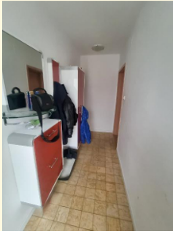
11 - Hauseingangsflur