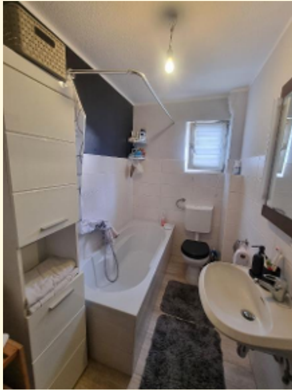
23 - Badezimmer OG