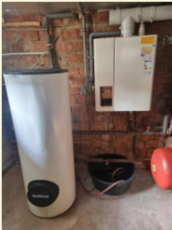
33 - Gas Zentralheizung