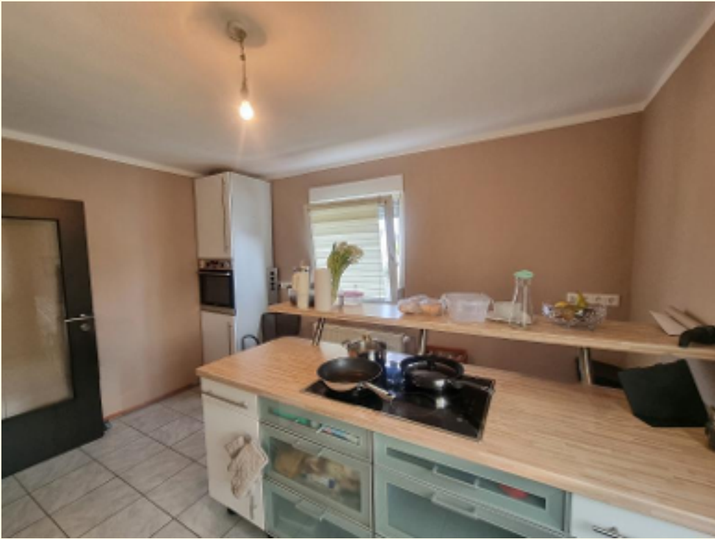
20 - Weitere Ansicht Küche OG