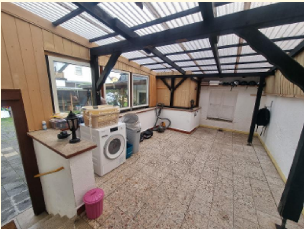
10 - Großzügiger Wintergarten