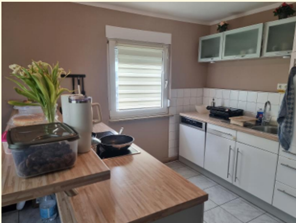
19 - Küche OG