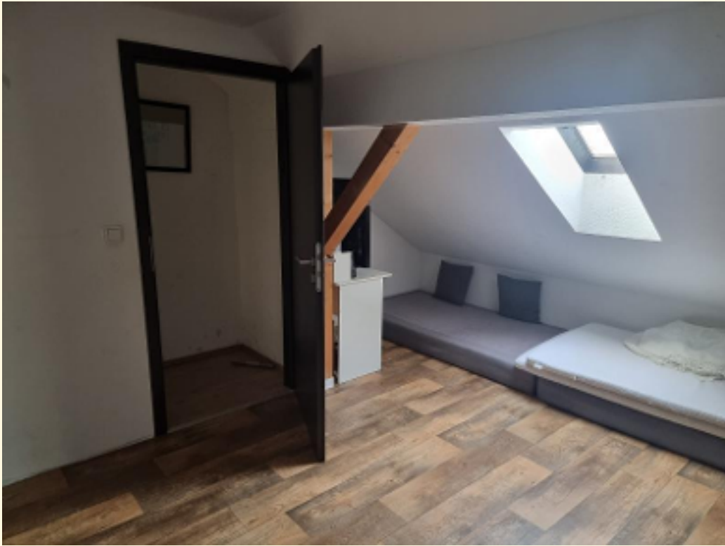
25 - Durchgangsraum DG