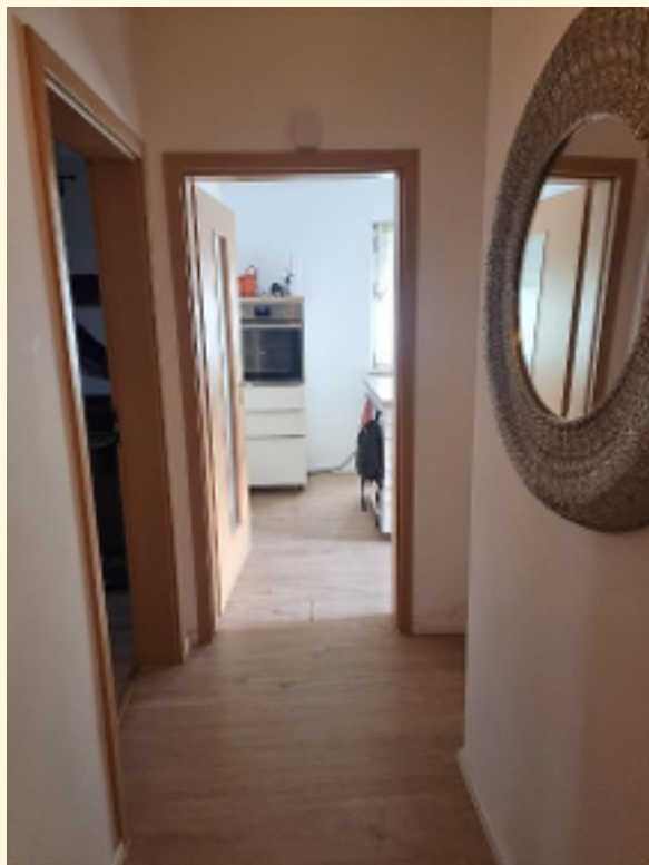
12 - Flur Whg EG