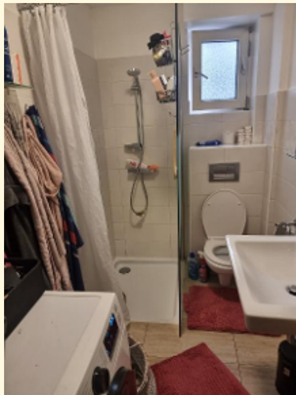
17 - Duschbad EG