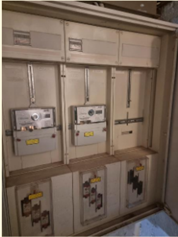
31 - Stromzähler für EG und OG