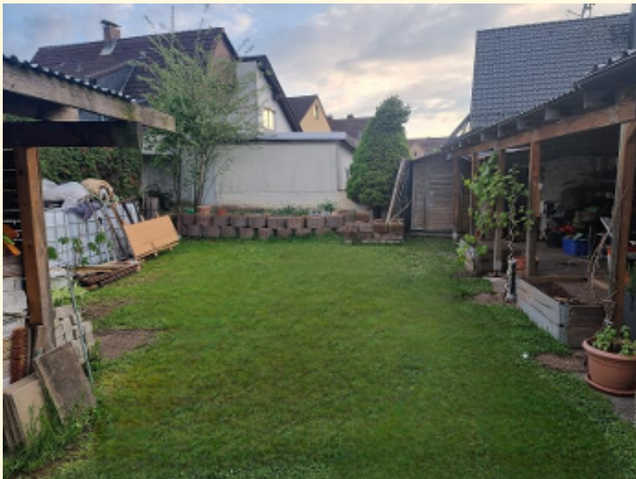
06 - Garten