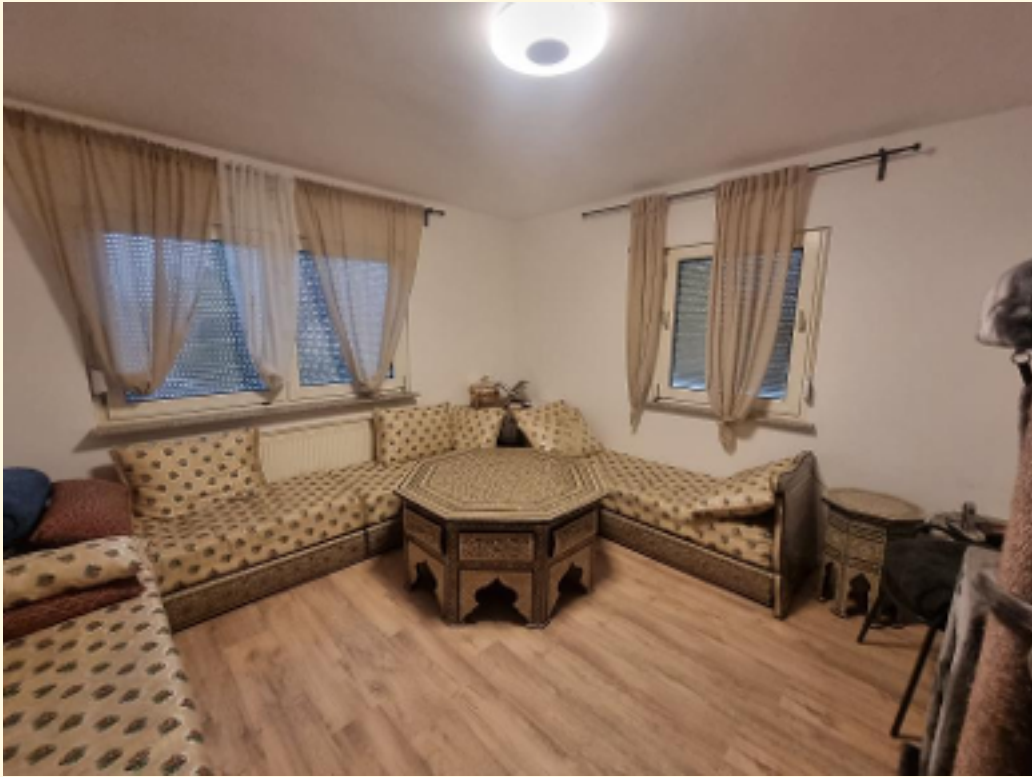
15 - Wohnzimmer EG Weitwinkel