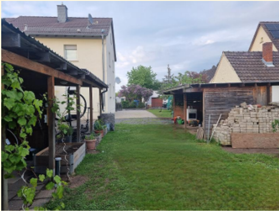
07 - Rückansicht Garten