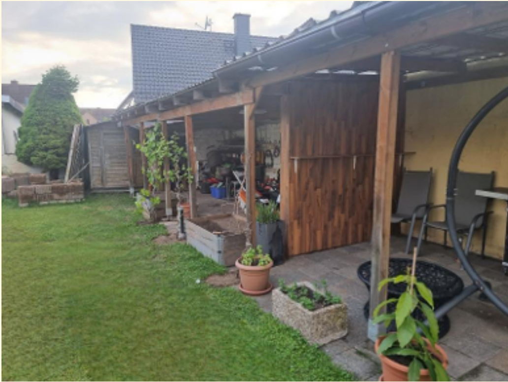
08 - Überdachte Freisitze