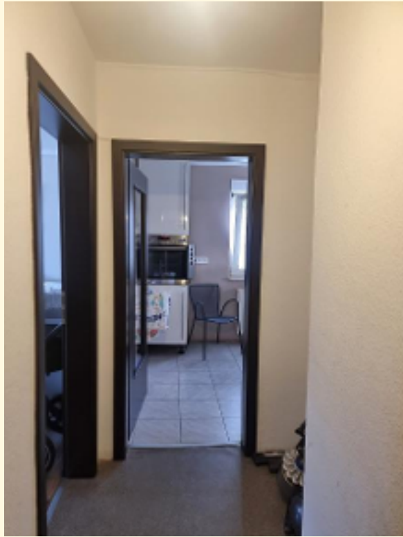
18 - Flur Whg OG