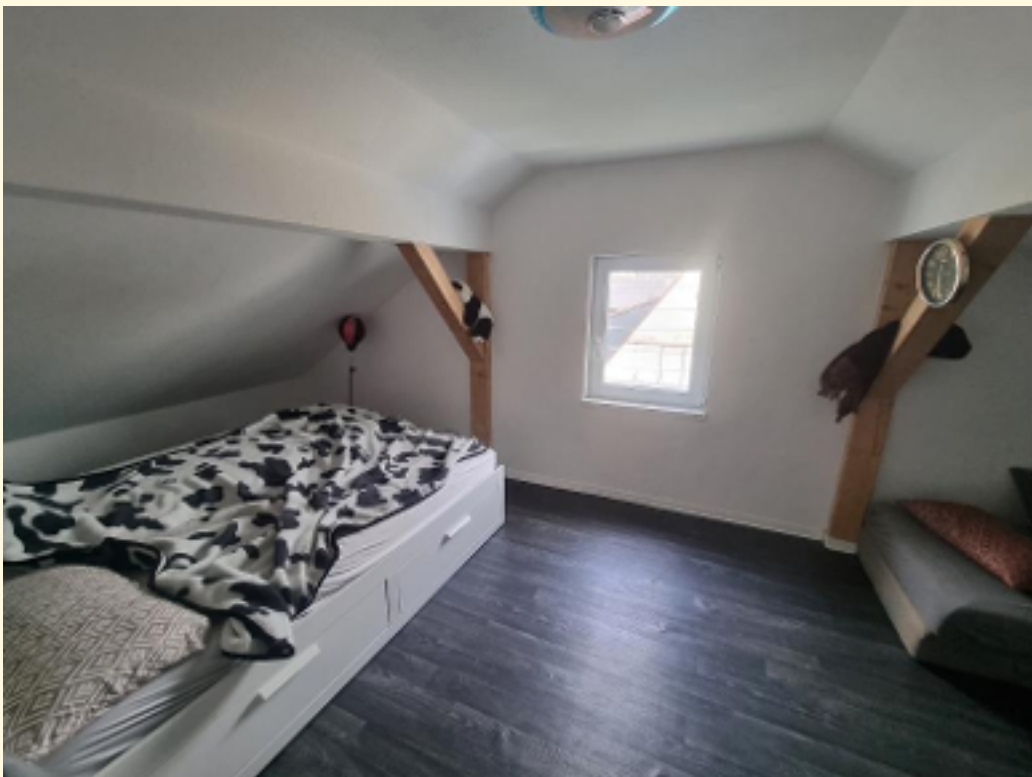
26 - Raum DG