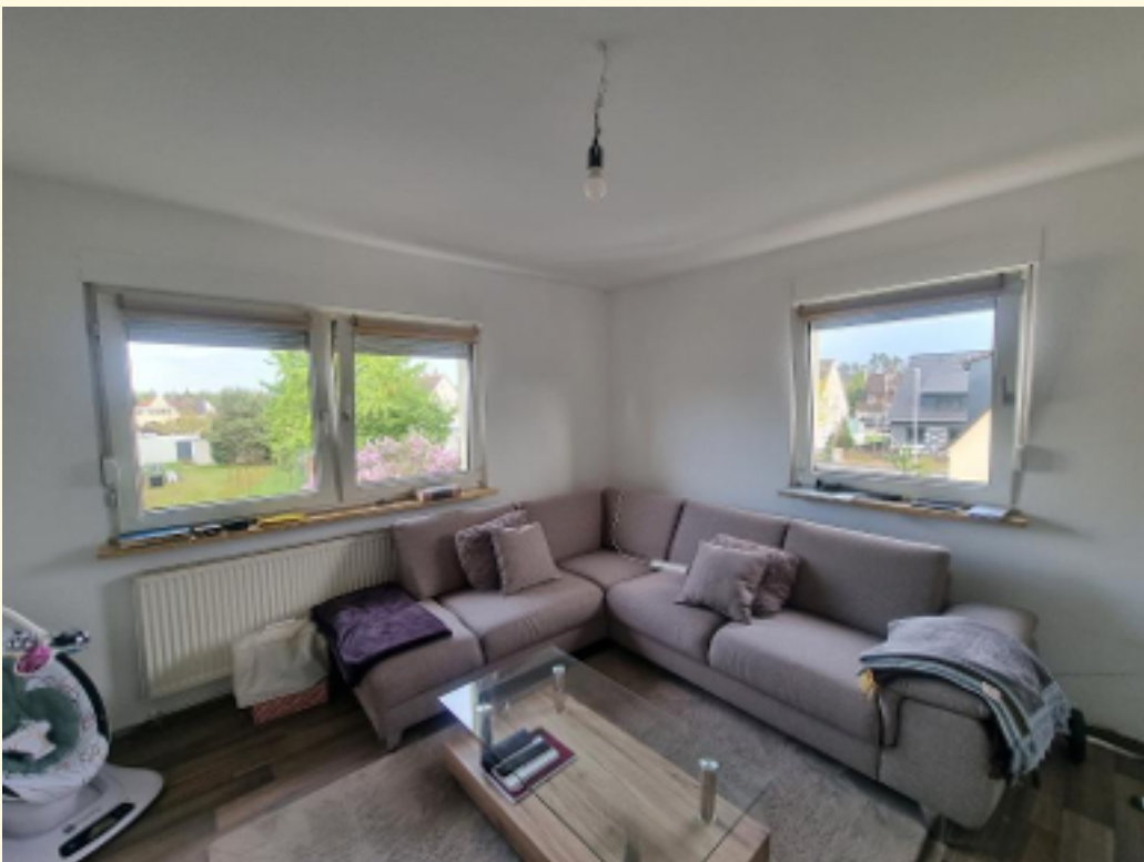
21 - Wohnzimmer OG