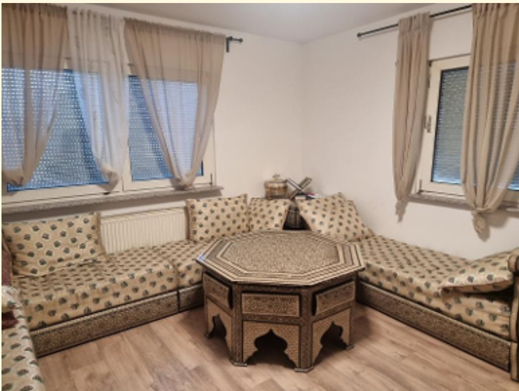
14 - Wohnzimmer EG