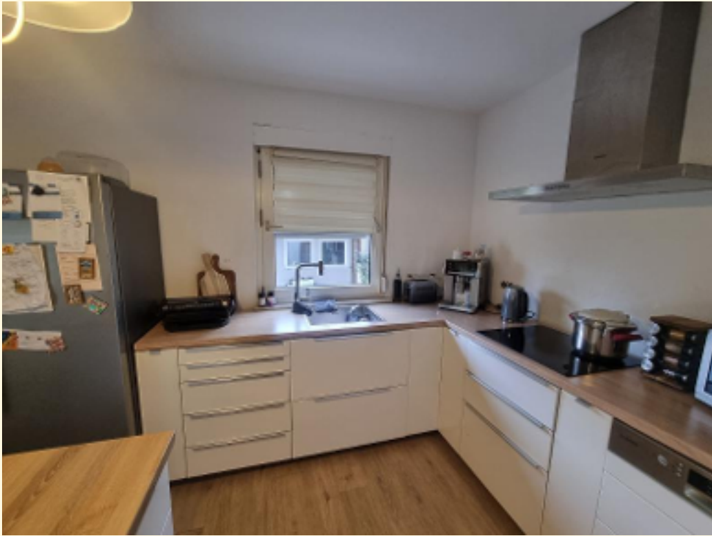
13 - Küche EG