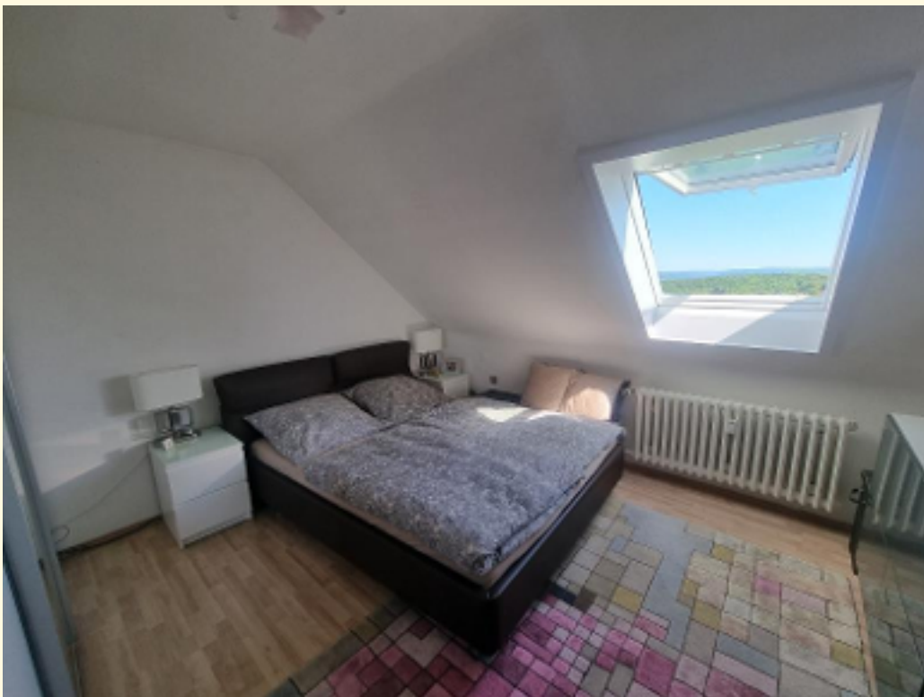
14 - Schlafzimmer Weitwinkel