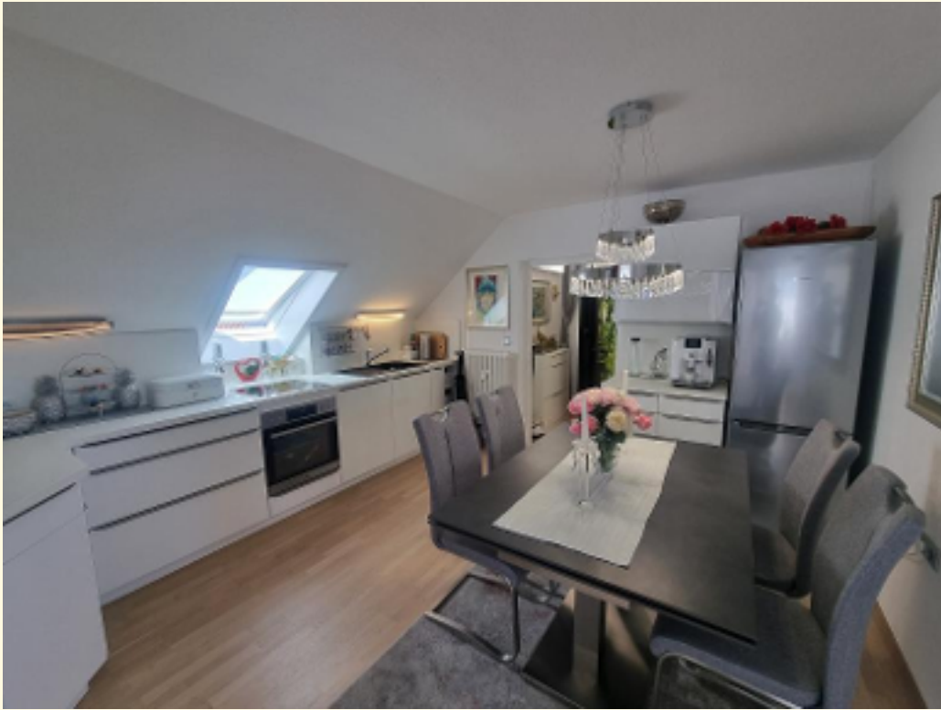
17 - Weitere Ansicht