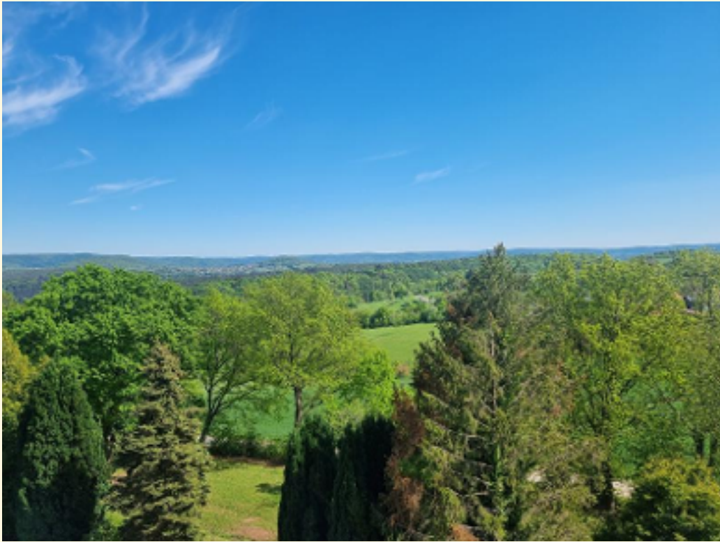
05 - Aussicht vom Fenster