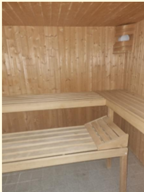
33 - Sauna