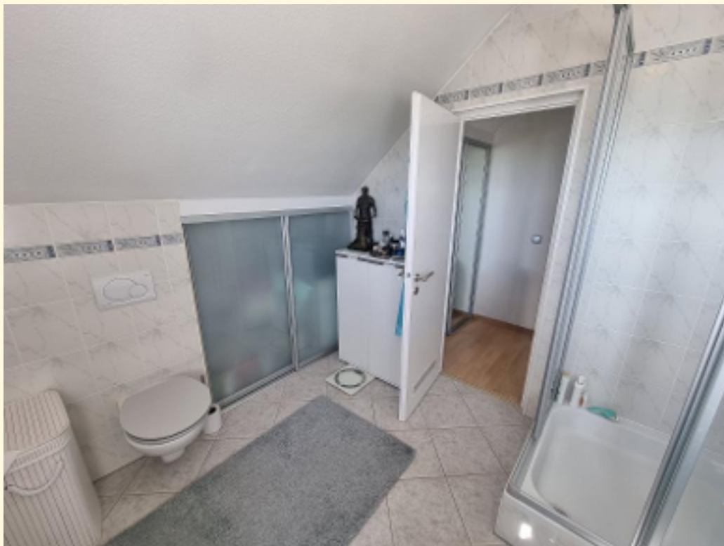
24 - Rückansicht Weitwinkel