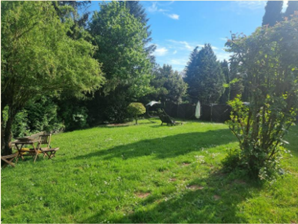
29 - Liegewiese