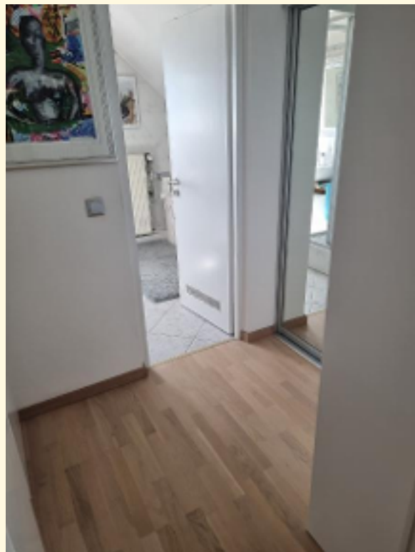
20 - Flur mit Einbauschränken