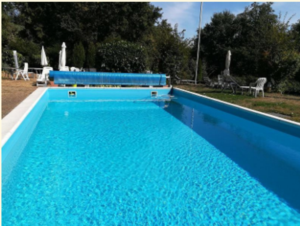
26 - Außen Pool