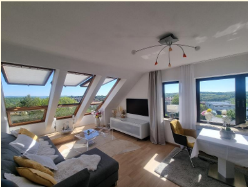
04 - mit Weitwinkel ohne Vorhänge