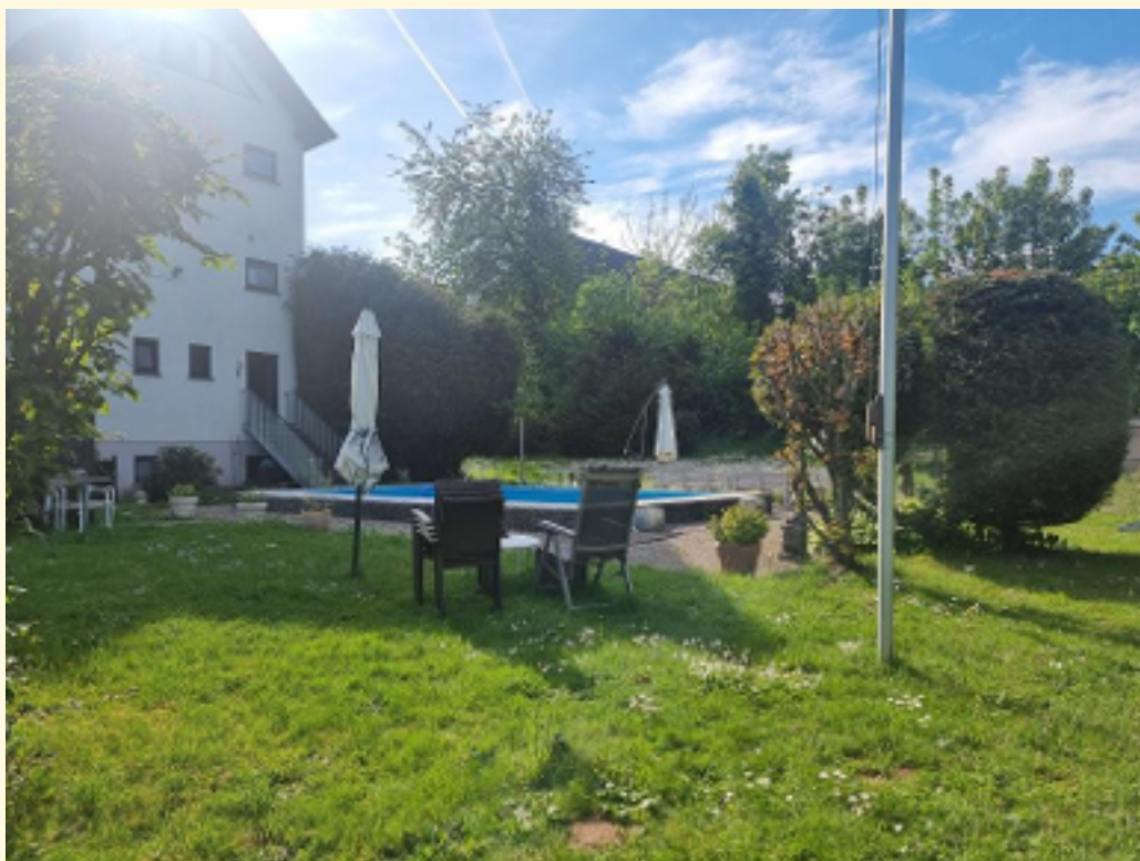
28 - Pool Bereich