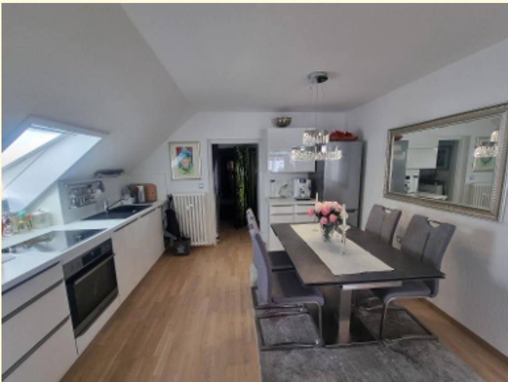
16 - Wohnküche Weitwinkel