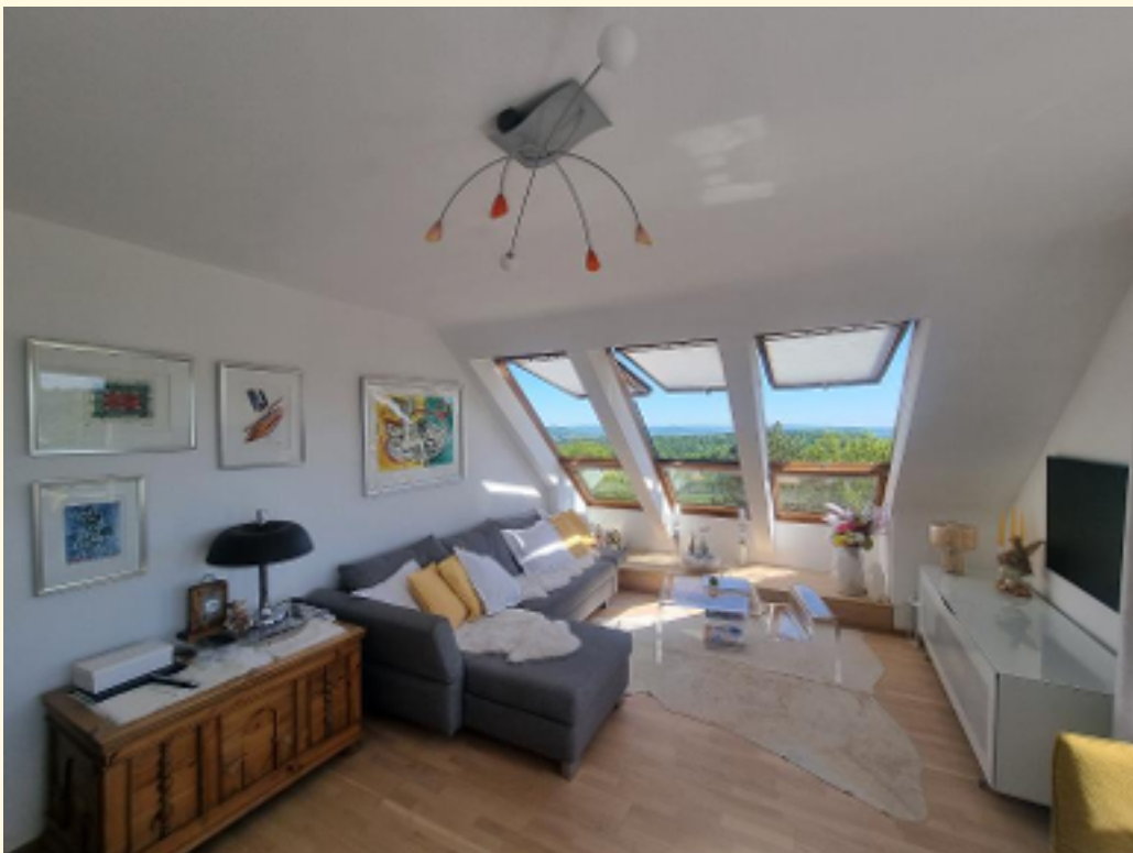
10 - Weitere Ansicht Weitwinkel