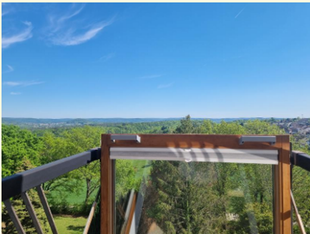
12 - Ausblick