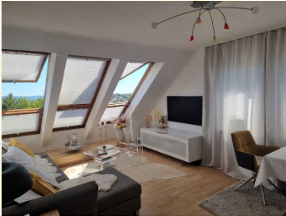
01 - Wohnzimmer Impressionen