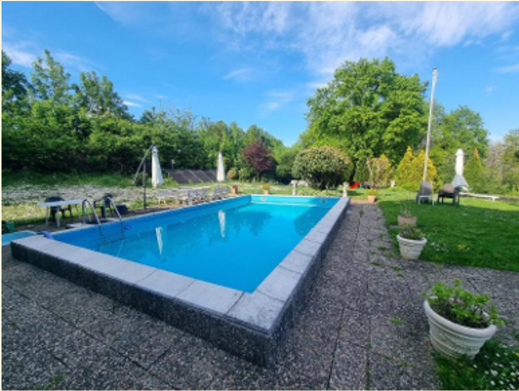
27 - Mit Solarererhitzung