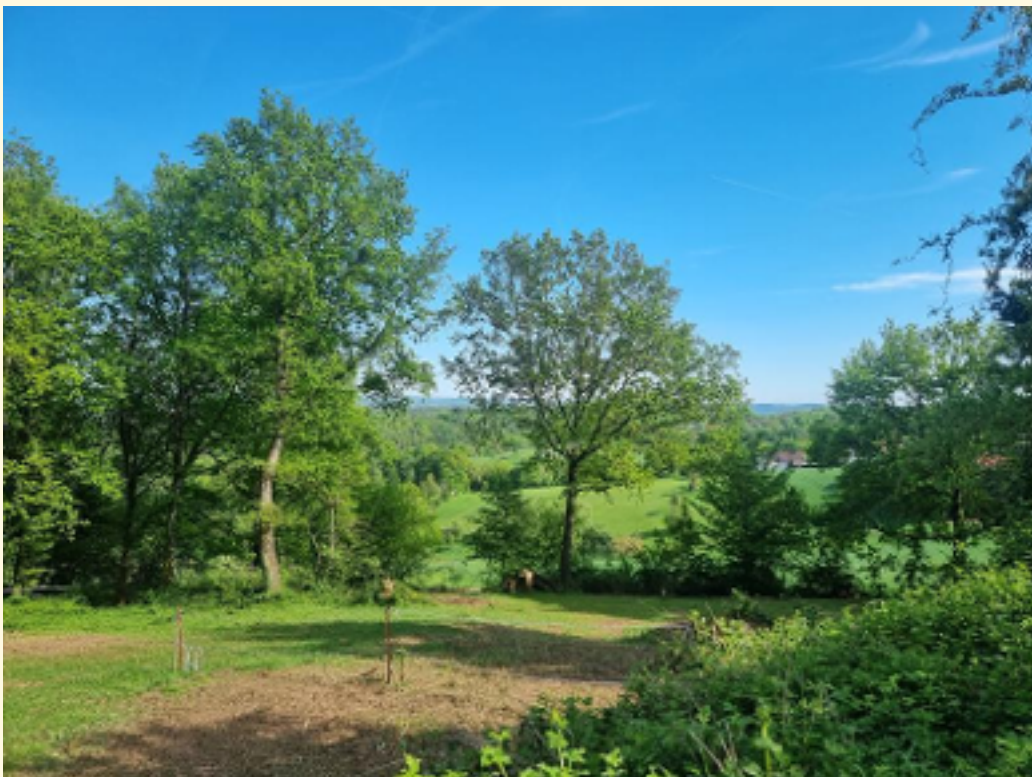
30 - Feldrandnähe