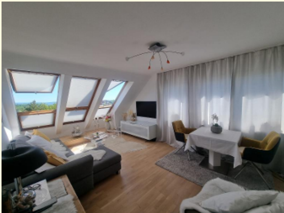
02 - mit Weitwinkel und Vorhänge