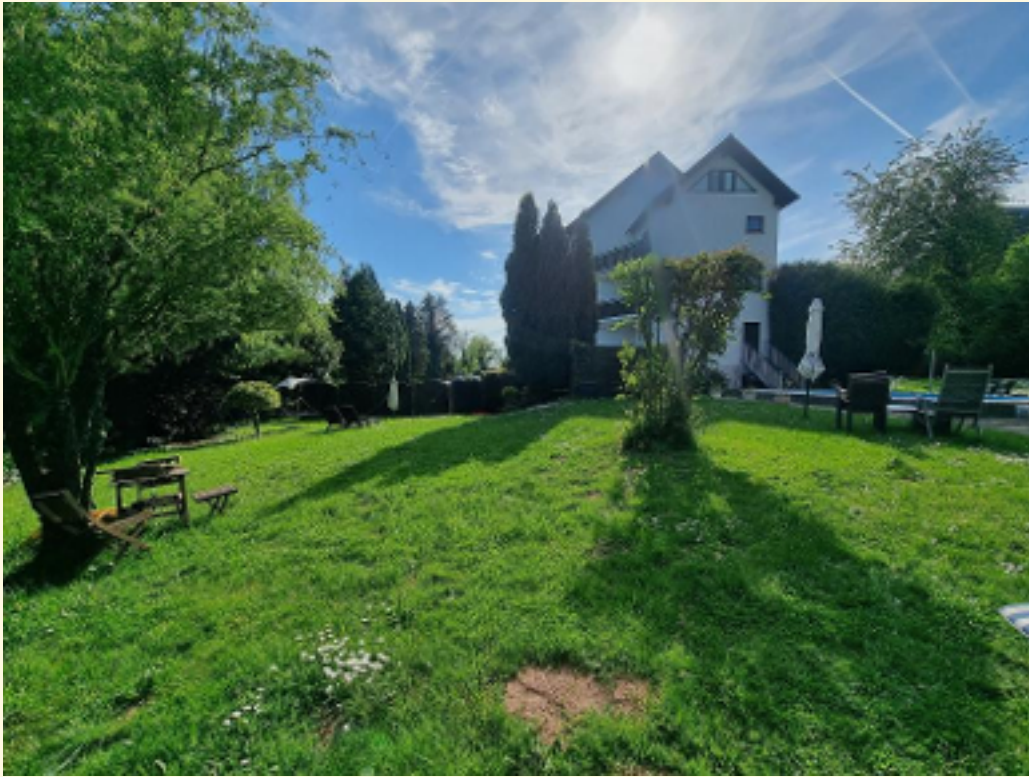
31 - Außenanlage