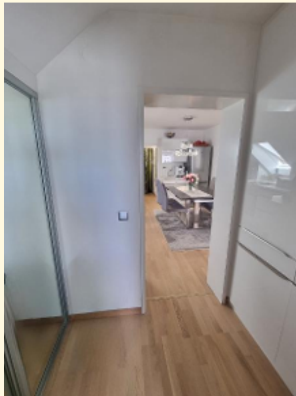
21 - Flur mit Einbauschränken