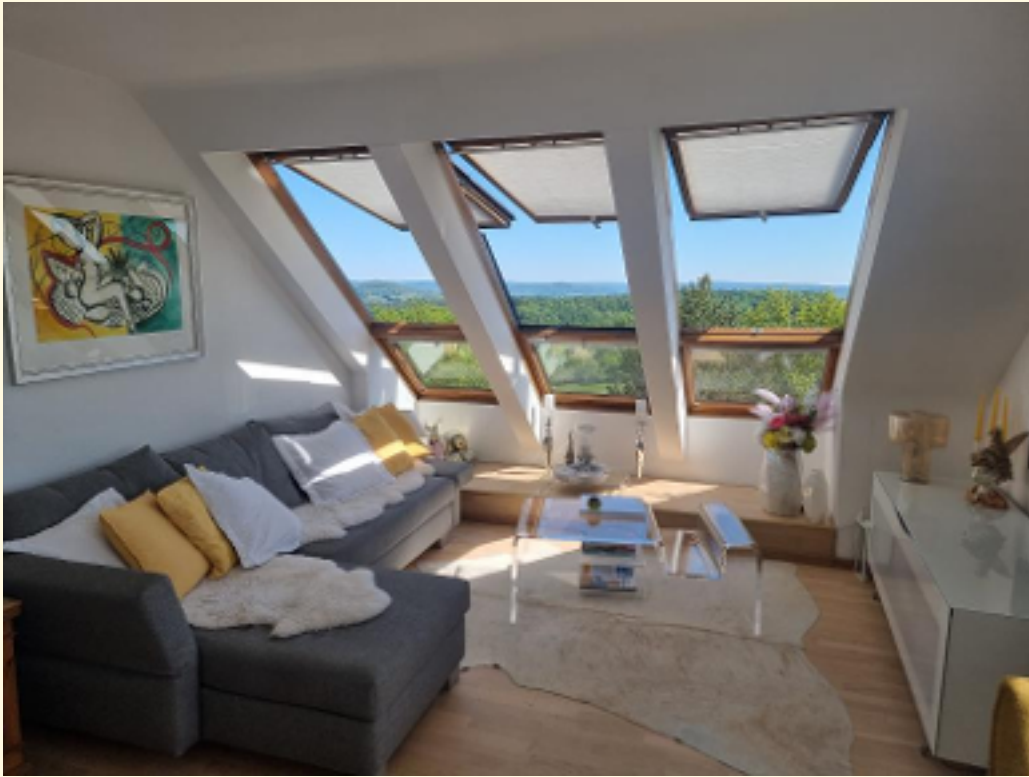
09 - Weitere Ansicht Wohnbereich