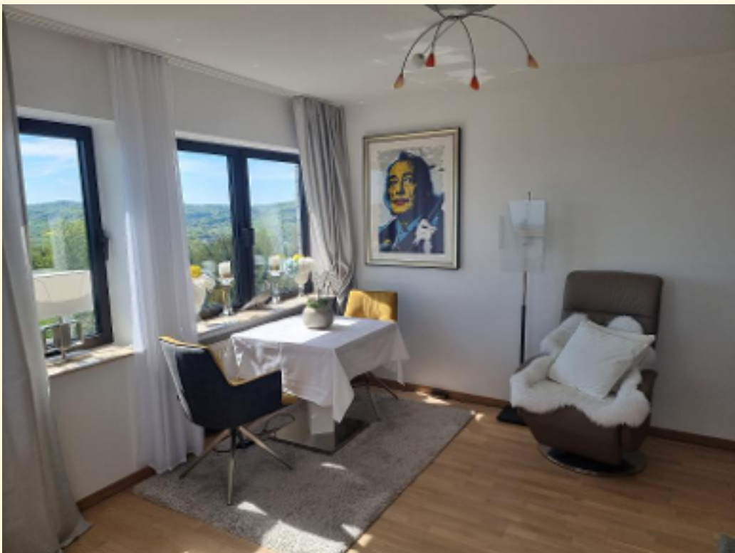
06 - Rückansicht Wohnzimmer