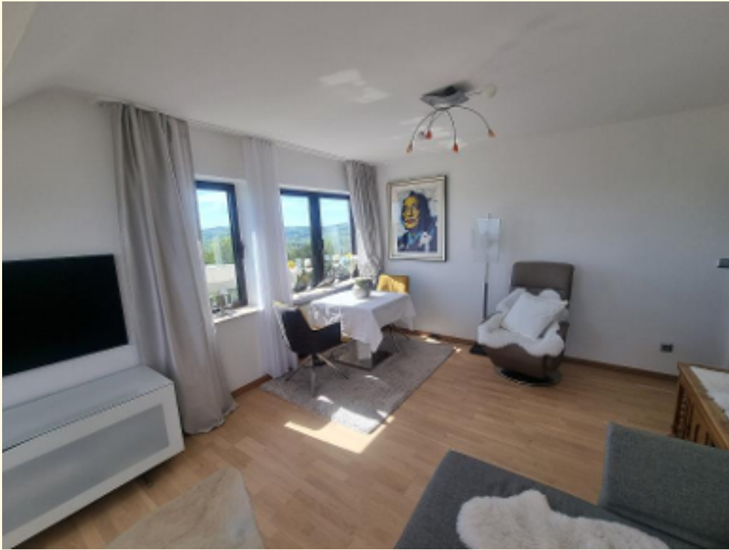
07 - Rückansicht Weitwinkel