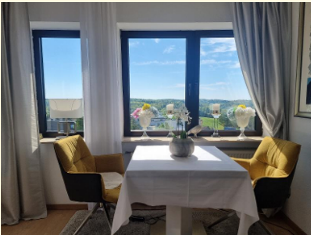
08 - Im Grünen Essen