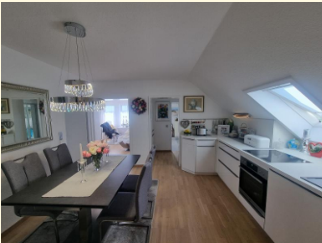
18 - Neuwertige Einbauküche