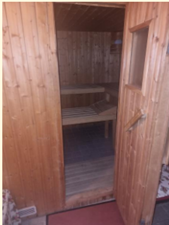
32 - Sauna