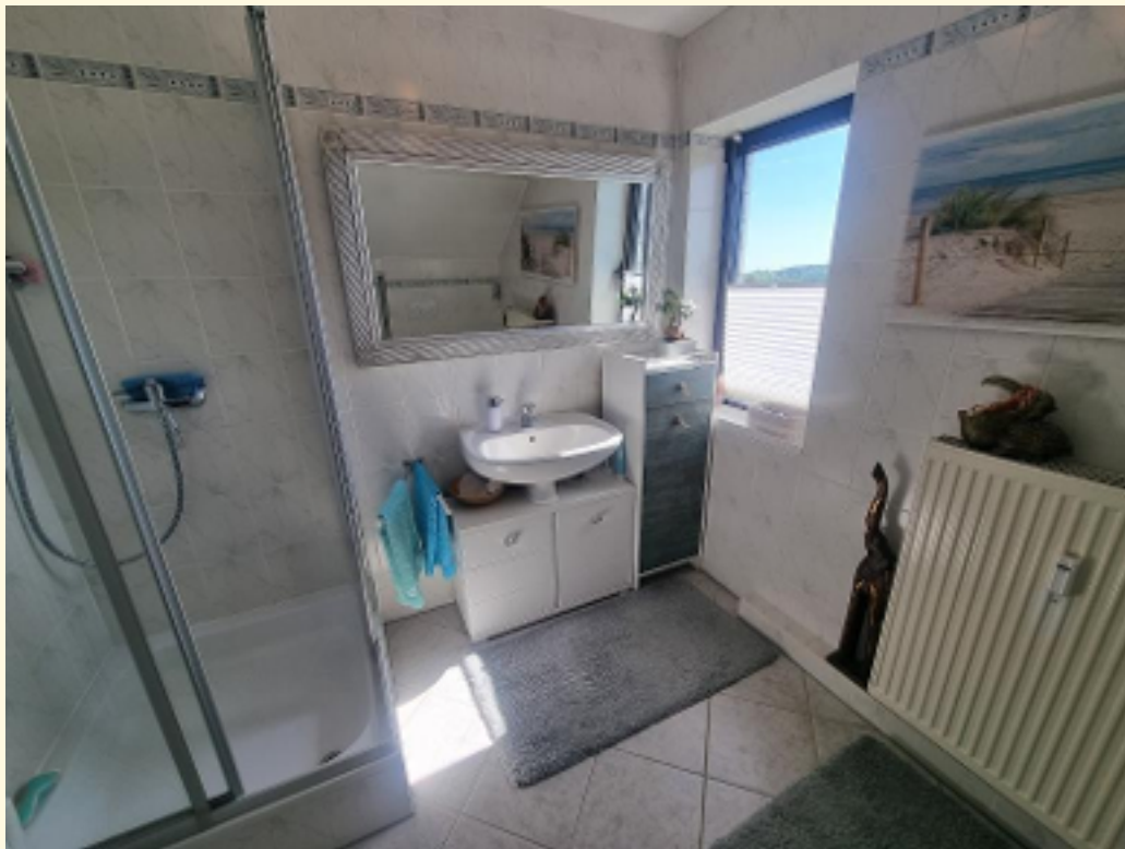
23 - Weitere Ansicht Weitwinkel