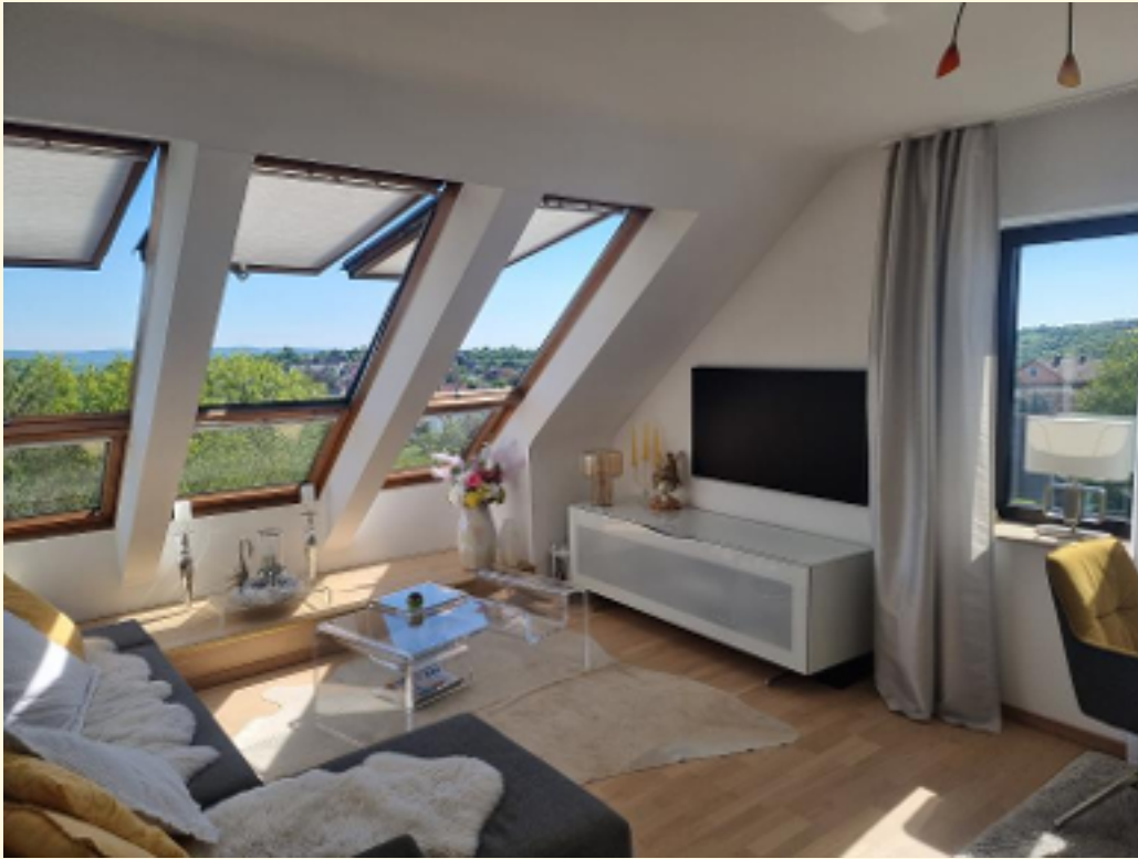
03 - ohne Vorhänge