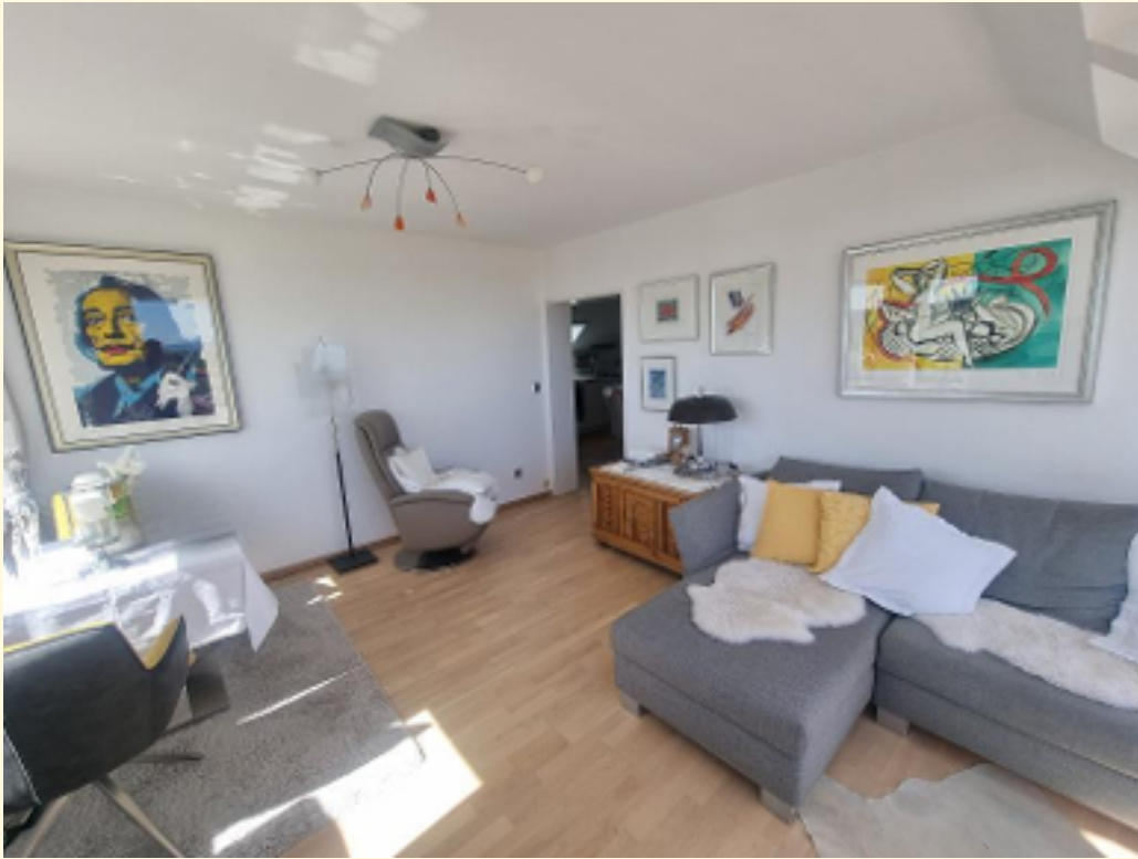
13 - Weitere Ansicht Wohnbereich