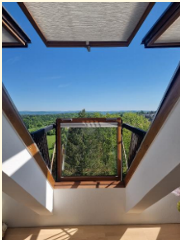
11 - Cabrio Fenster