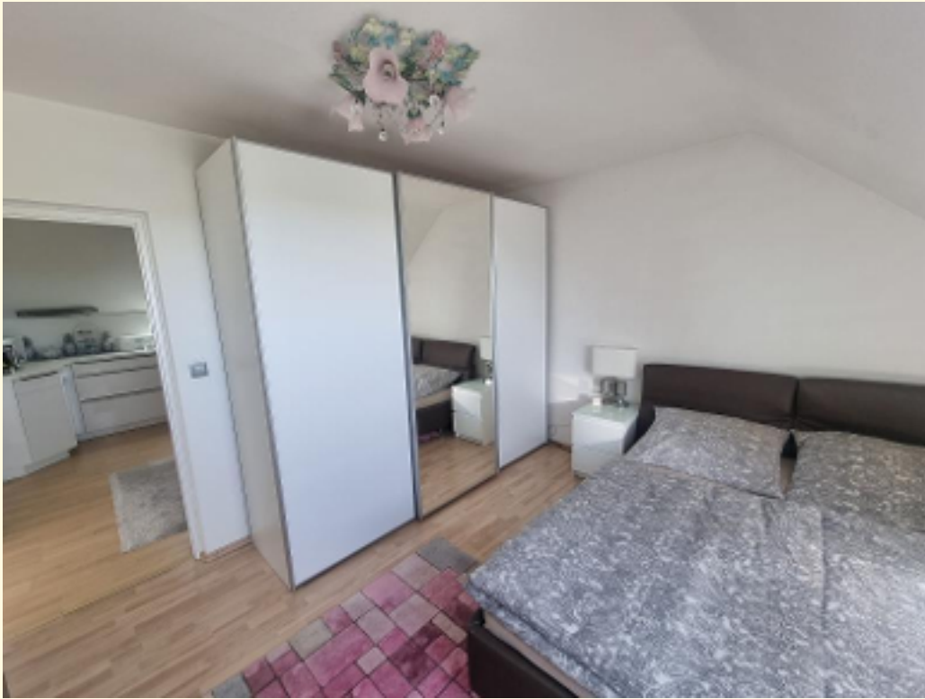
15 - Schlafzimmer Weitwinkel