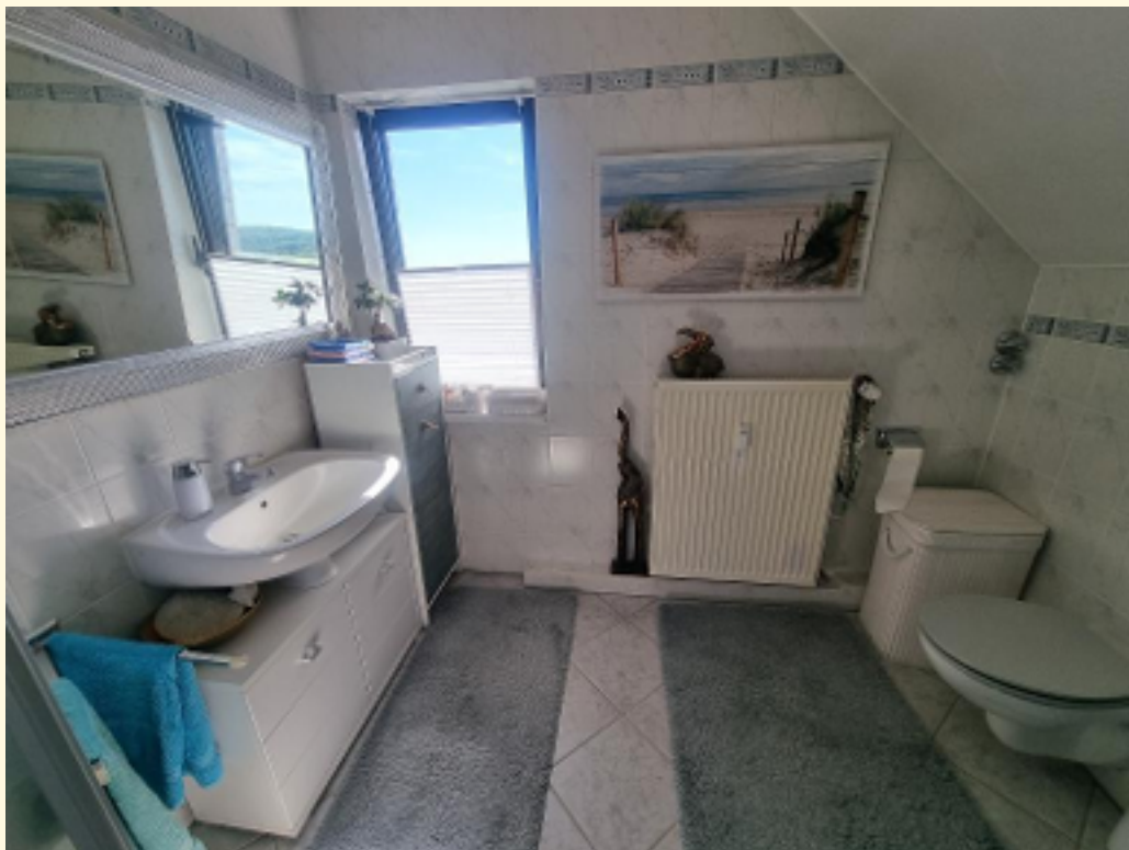
22 - Badezimmer Weitwinkel