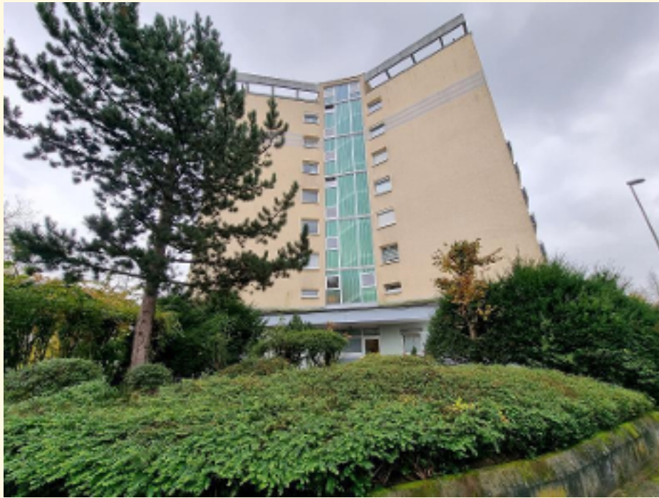
01 - Außenansicht Gebäude