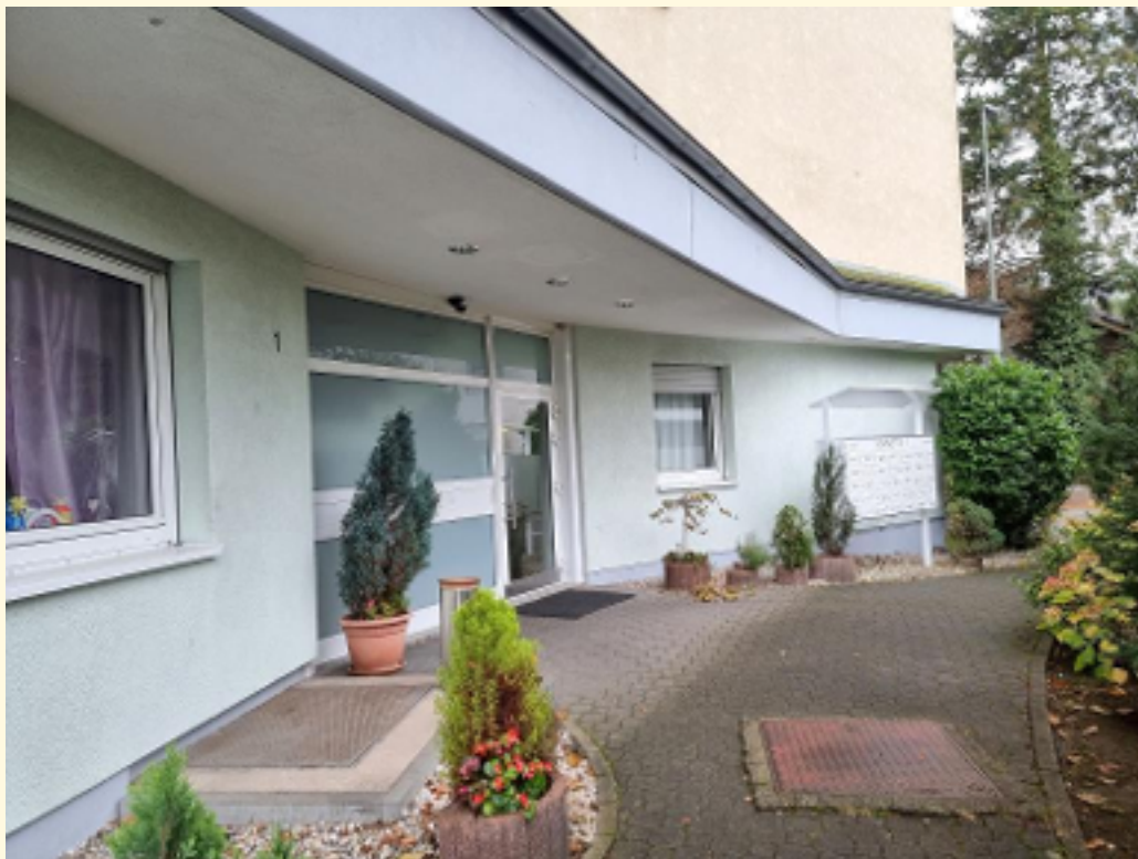
04 - Eingang