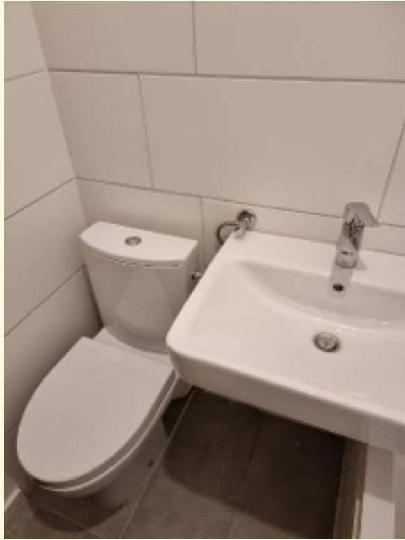
14 - WC