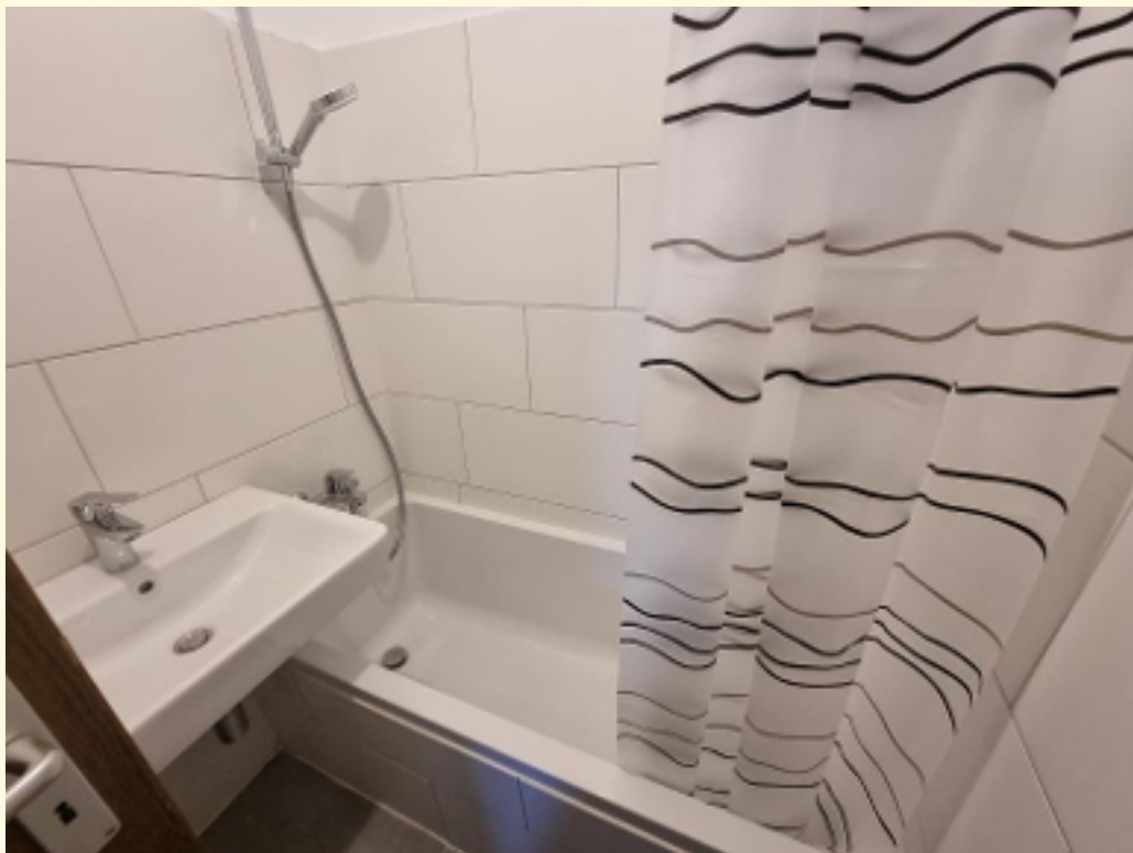
13 - Kleines Bad