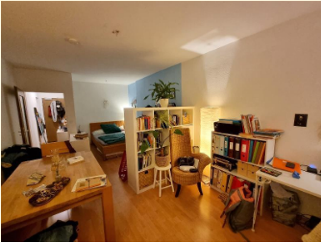
07 - Einrichtungsbeispiel