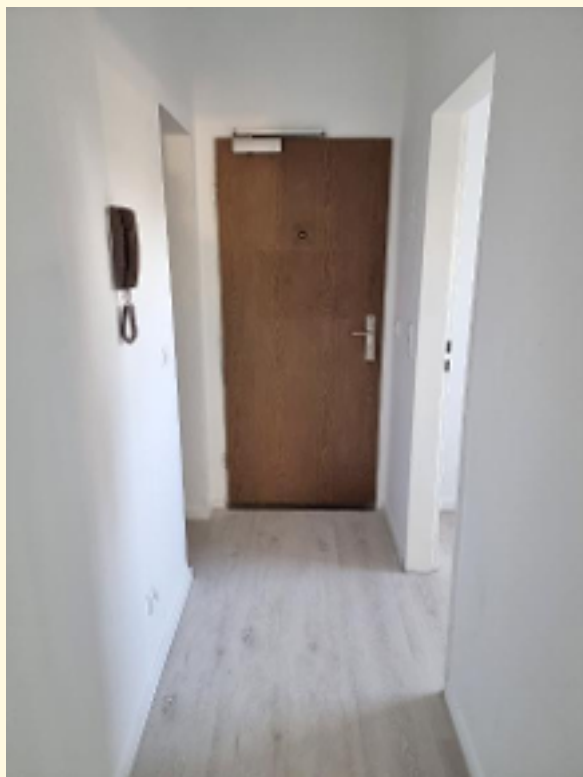
11 - Flur