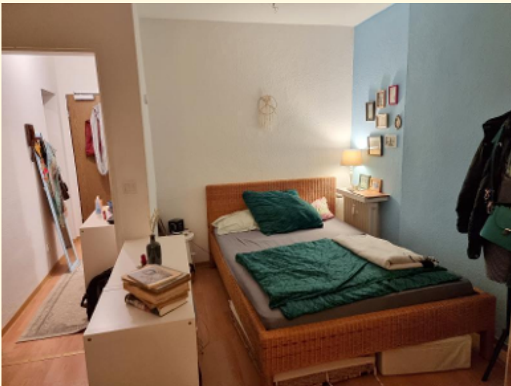
06 - Schlafbereich Einrichtungsbeispiel