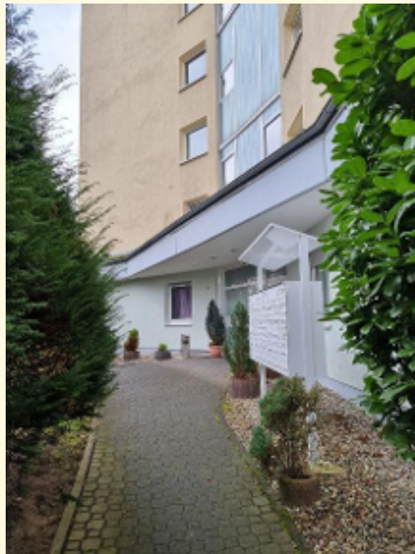
03 - Zuweg