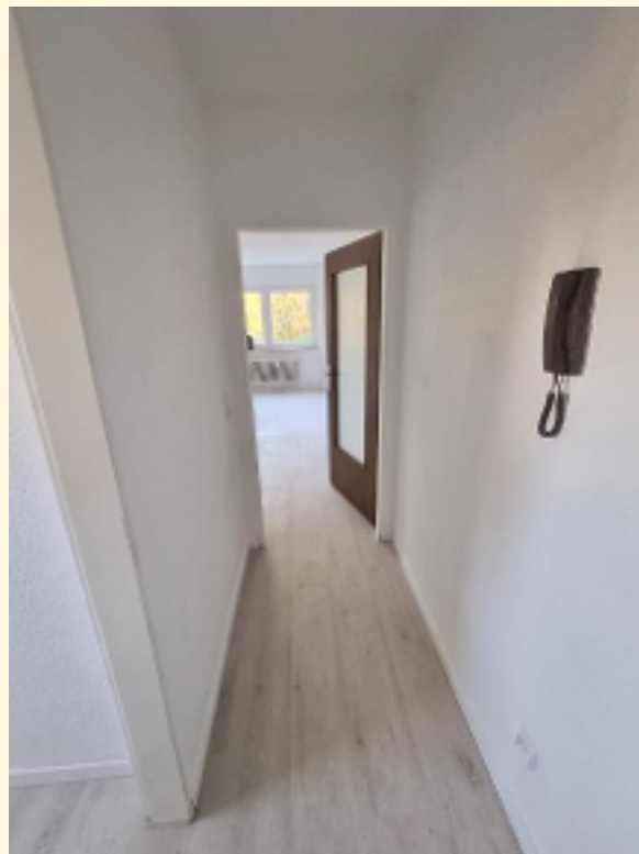
10 - Flur