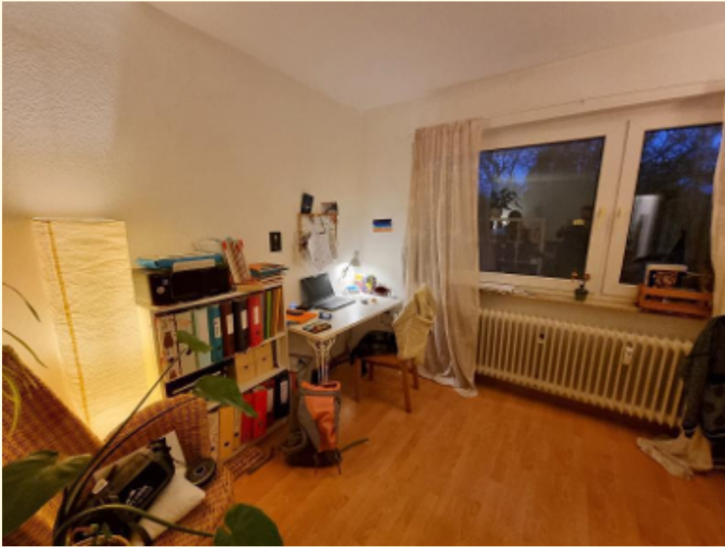
05 - Wohnbereich Einrichtungsbeispiel