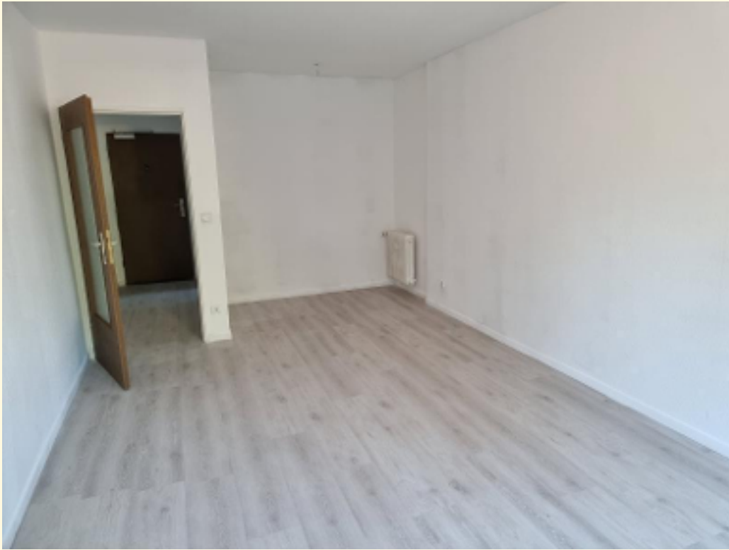
09 - Zimmer leer