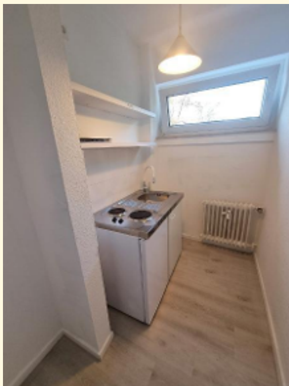
12 - Kleine Küche