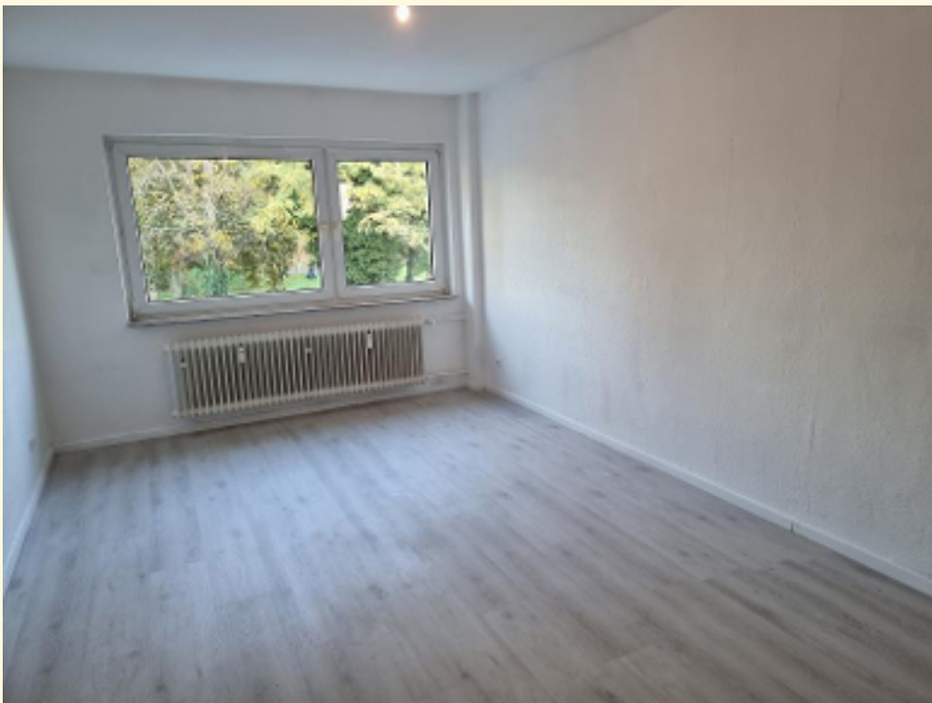
08 - Zimmer leer