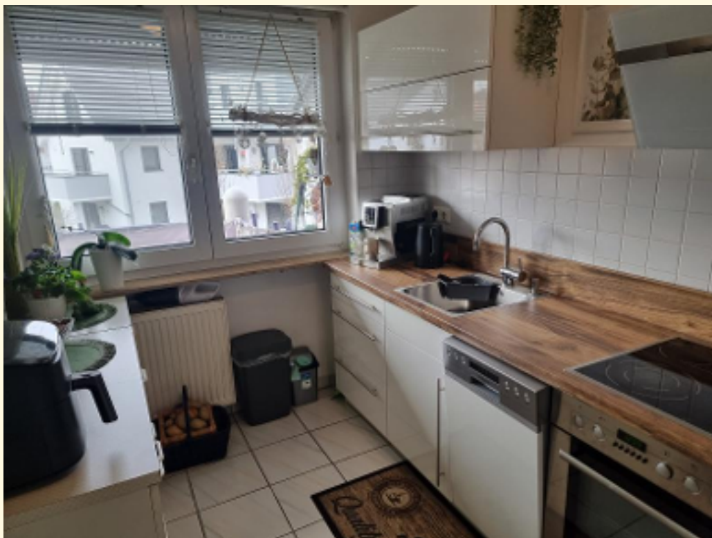
05 - Küche