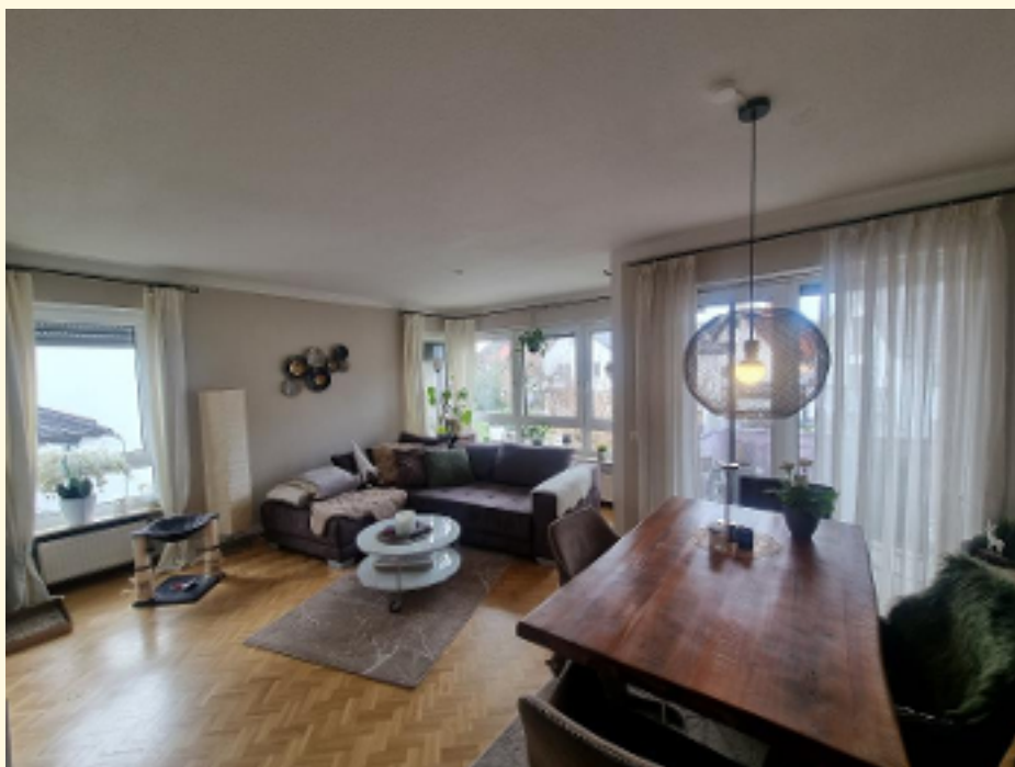
02 - Wohn.-Esszimmer