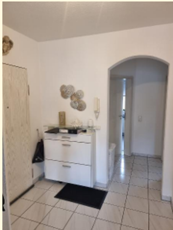
07 - Flur