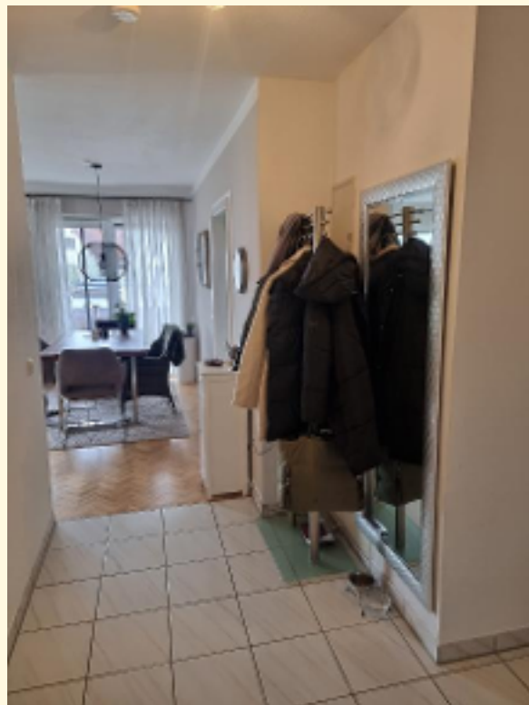
08 - Flur