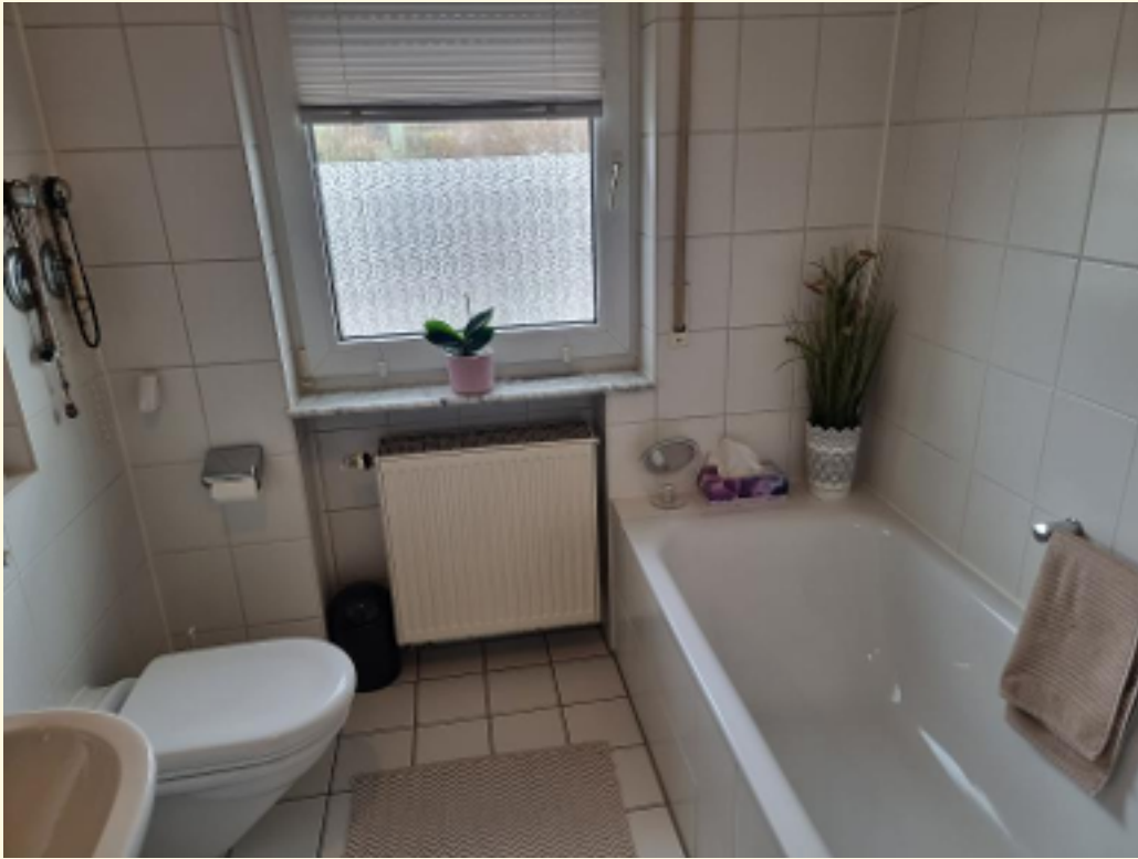
09 - Badezimmer