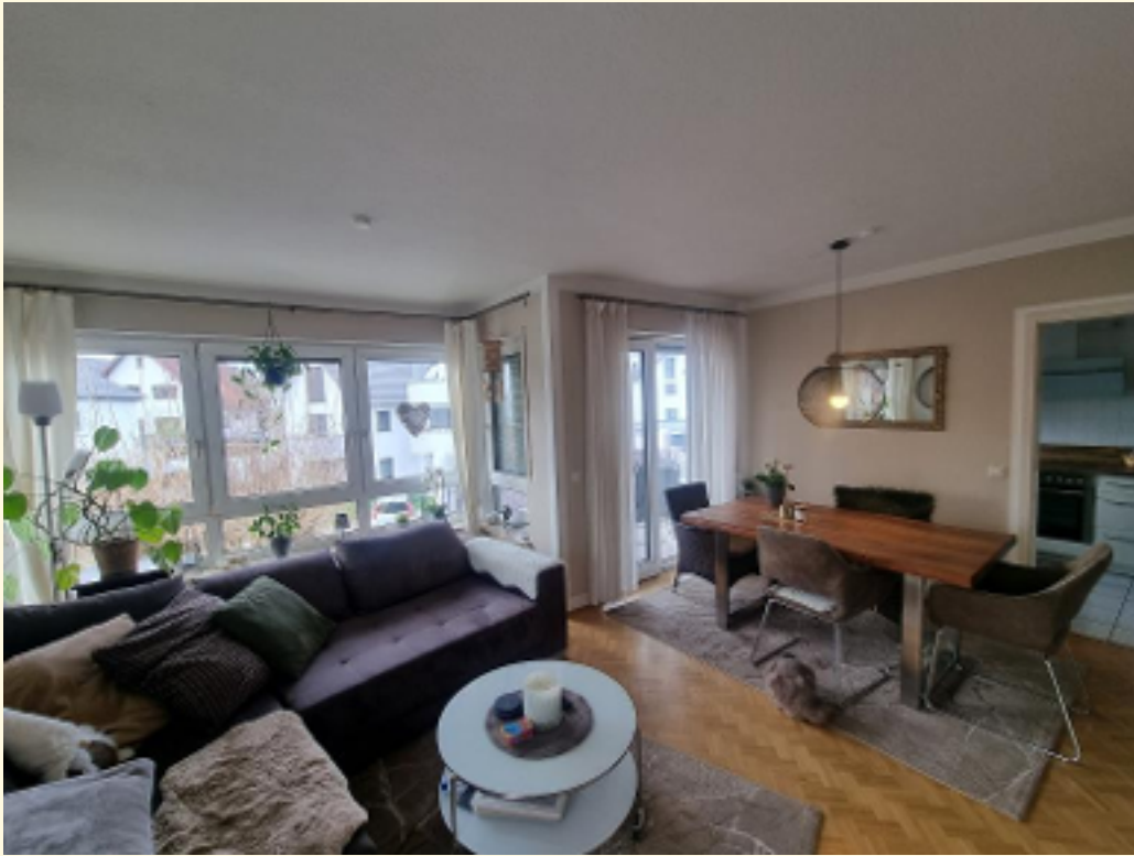
03 - Wohn-Esszimmer