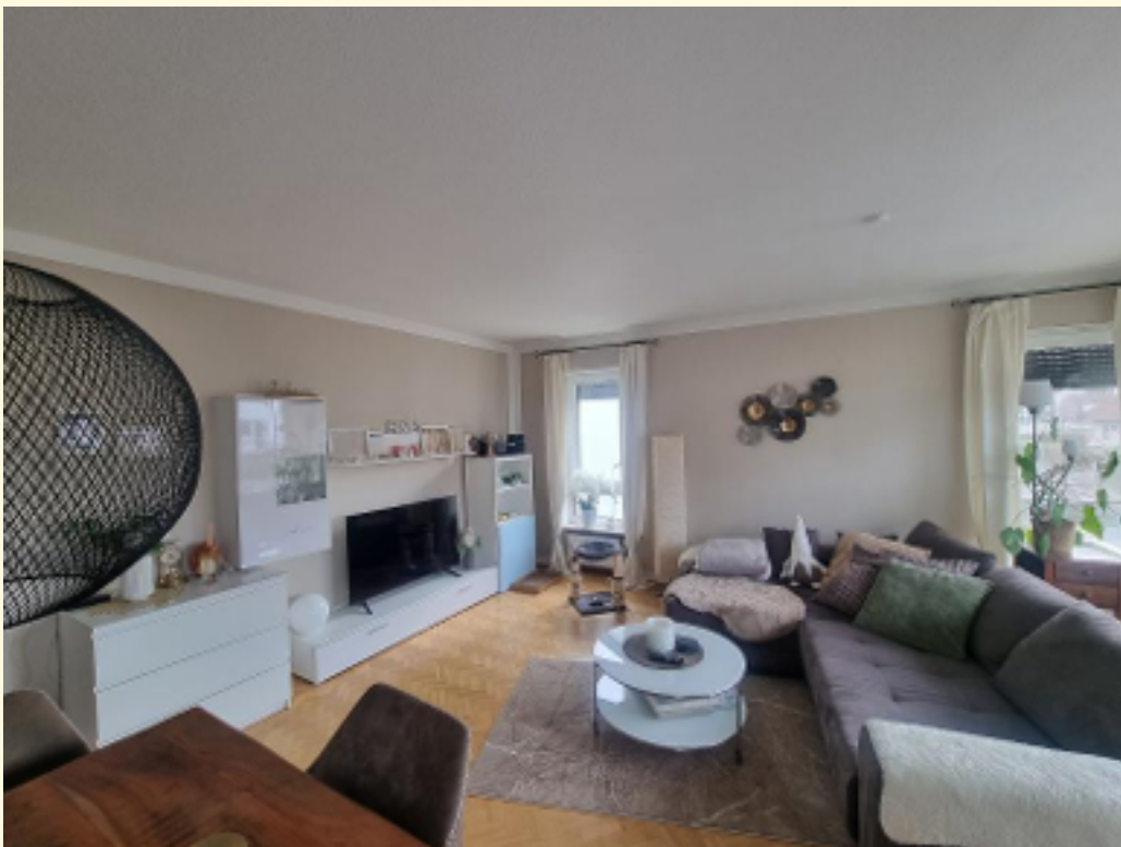
04 - Wohn-Esszimmer