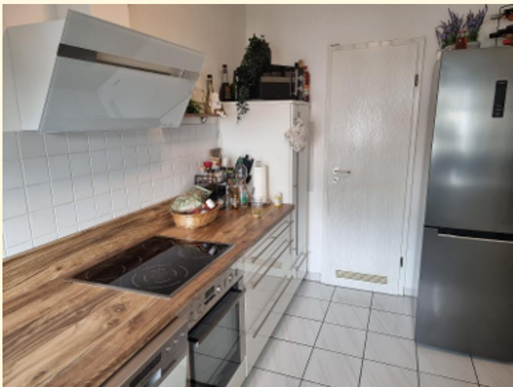
06 - Küche