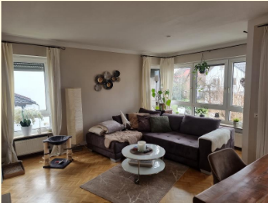
01 - Wohnbereich