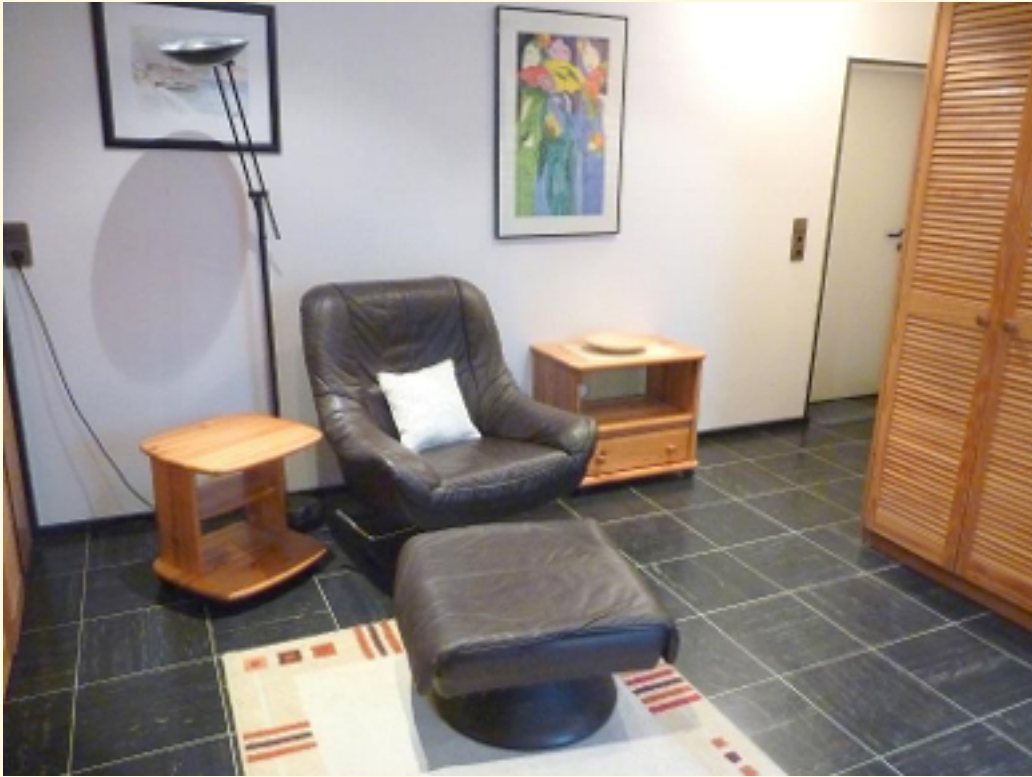
03 - Wohnbereich