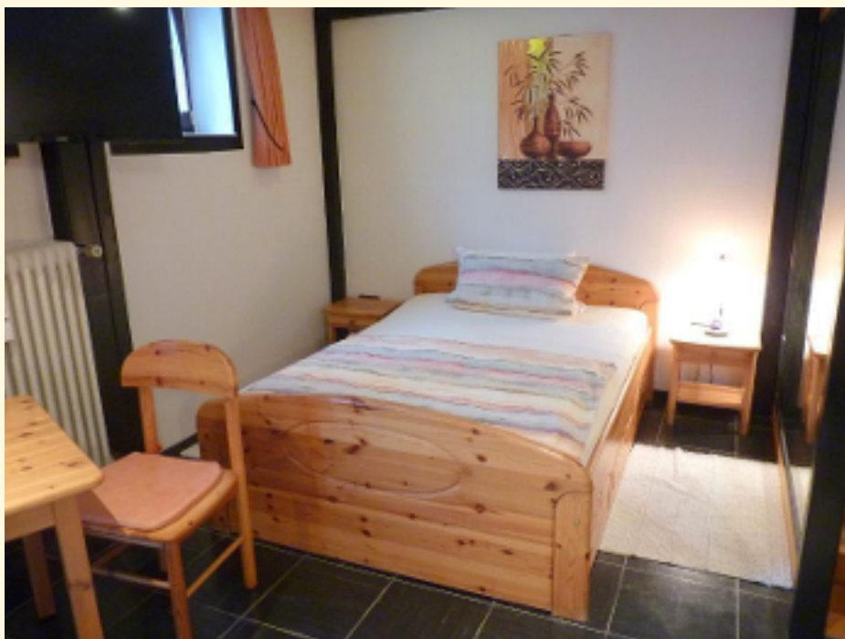
02 - Schlafbereich