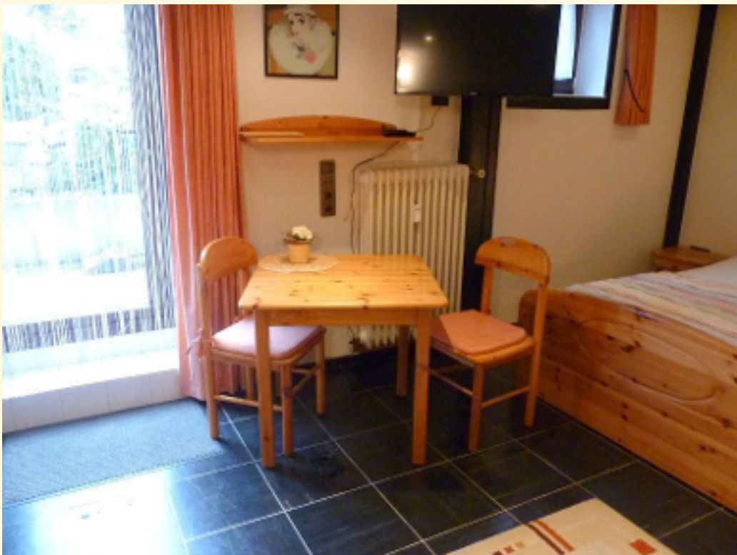
04 - Essbereich