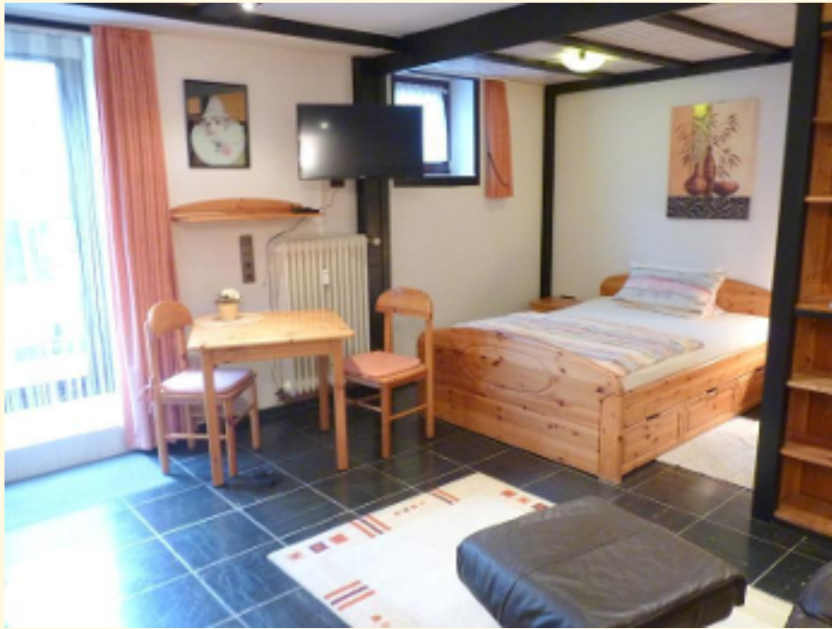
01 - Wohn-Schlafbereich