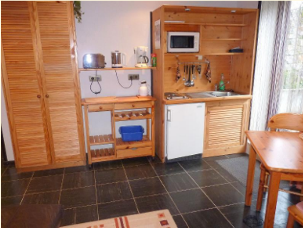
05 - Küchenbereich