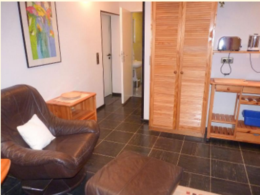
06 - Eingangsbereich