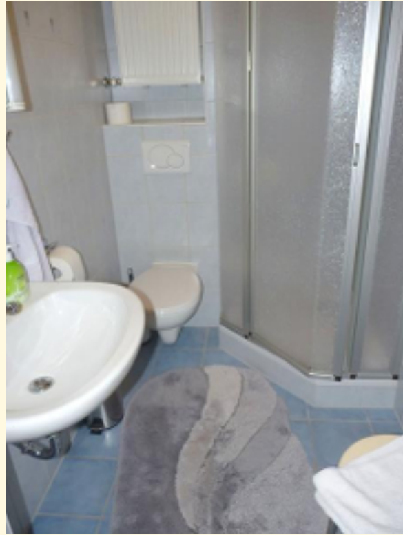
07 - Duschbad