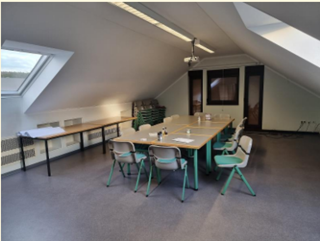
11 - Tagungsraum Ansicht 2