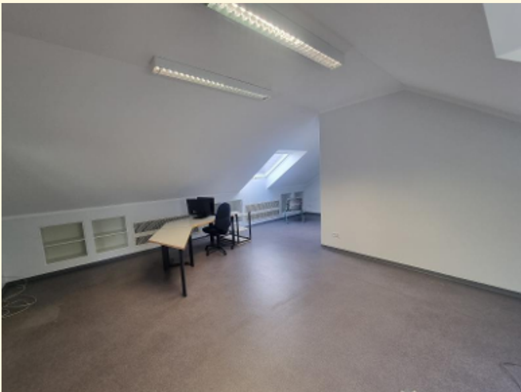
02 - Offener Büroraum Ansicht 3