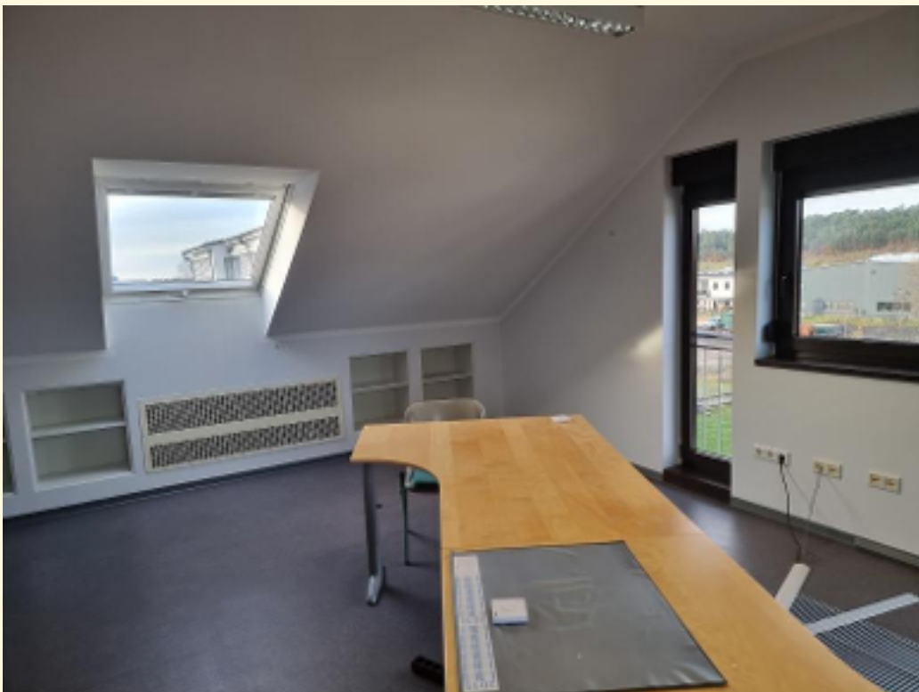
01 - 1. Büroraum Ansicht 4