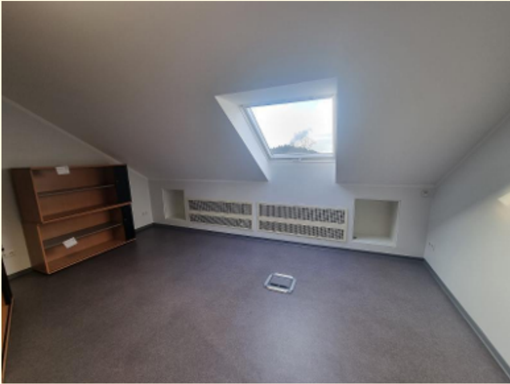
04 - 3. Büroraum Ansicht 2