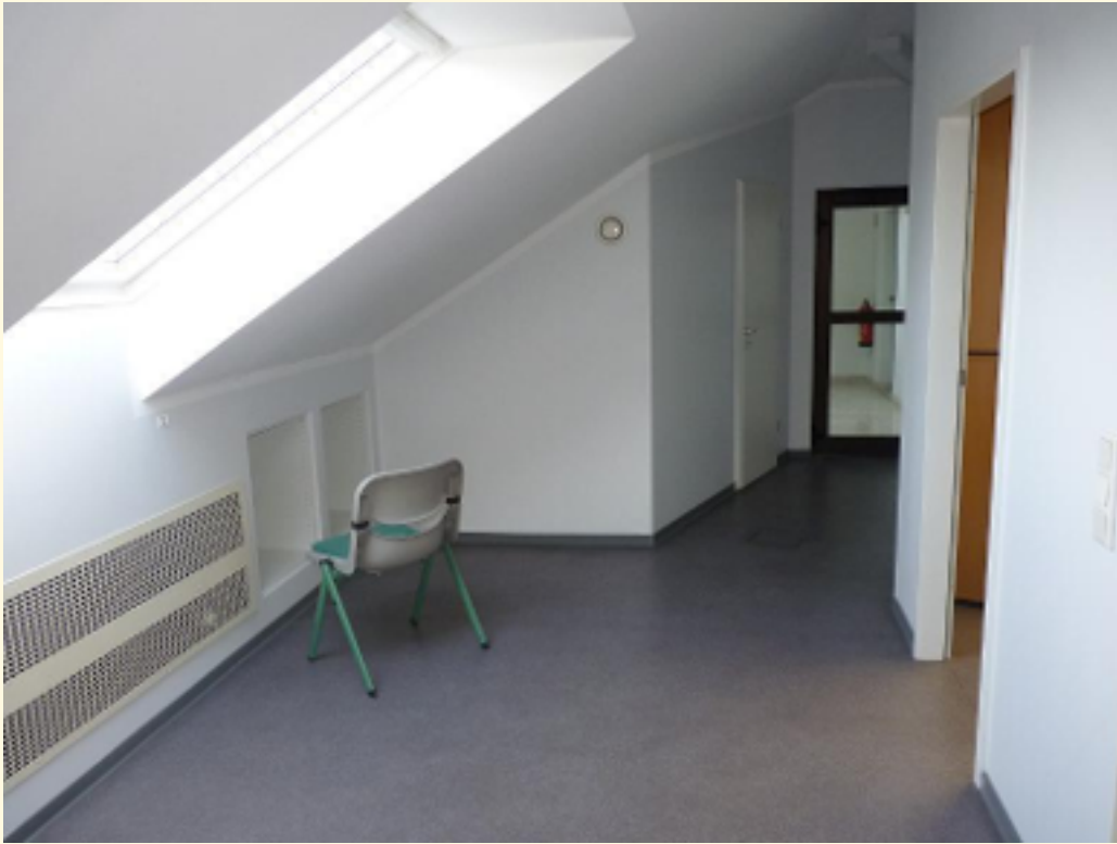
03 - Flur