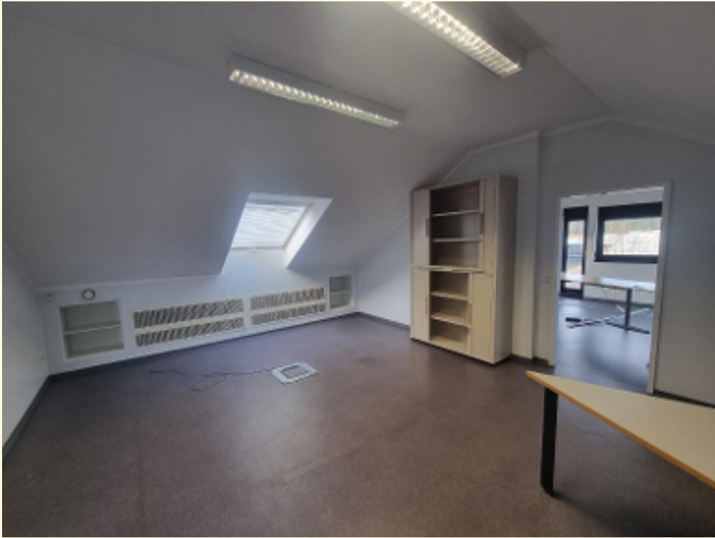
02 - Offener Büroraum Ansicht 2