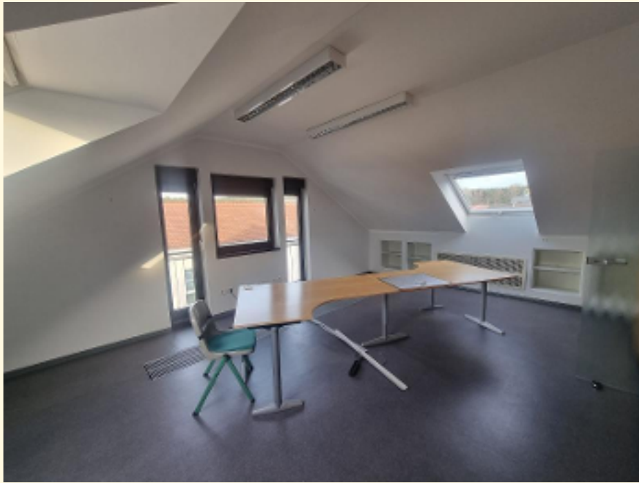
01 - 1. Büroraum Ansicht 1