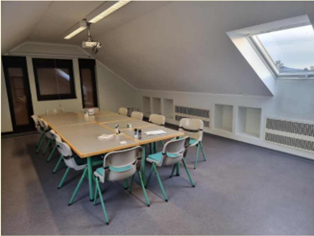
11 - Tagungsraum Ansicht 4