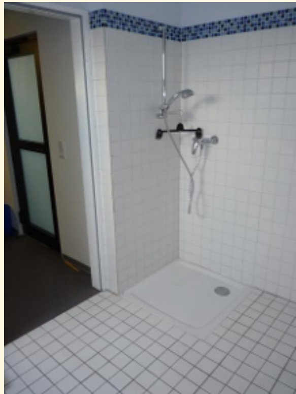
09 - Duschmöglichkeit