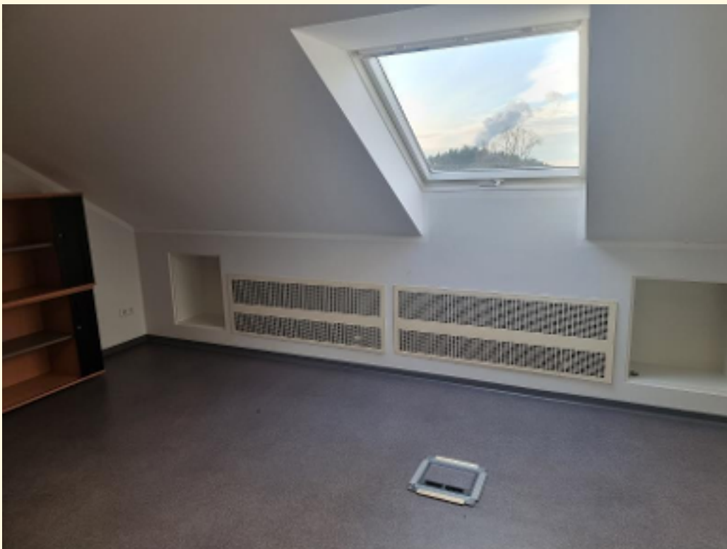
04 - 3. Büroraum Ansicht 1