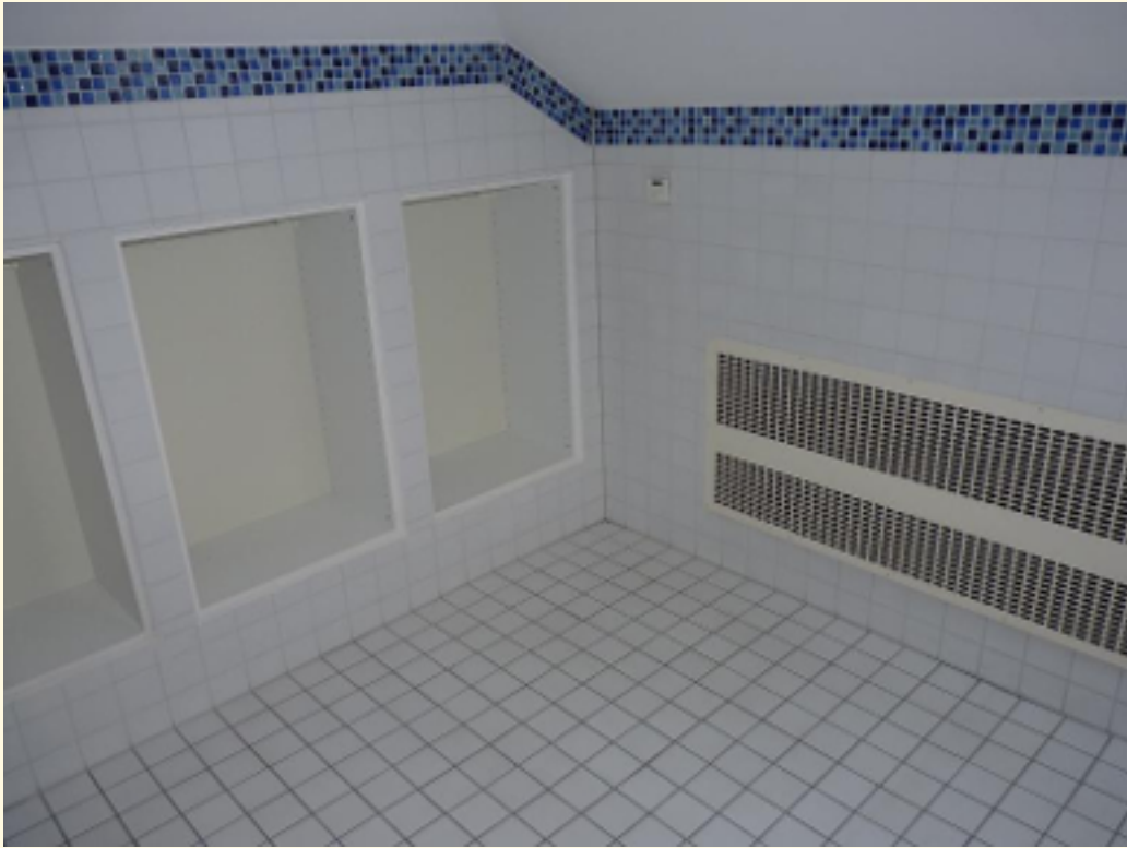
10 - Abstellraum