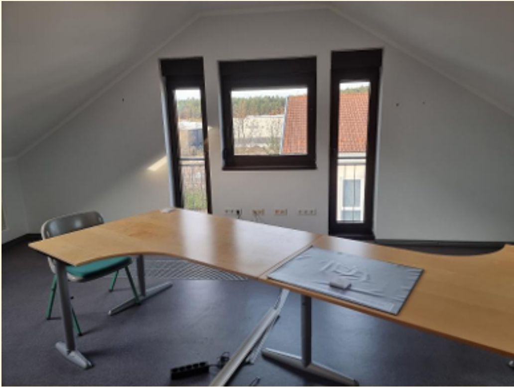
01 - 1. Büroraum Ansicht 3