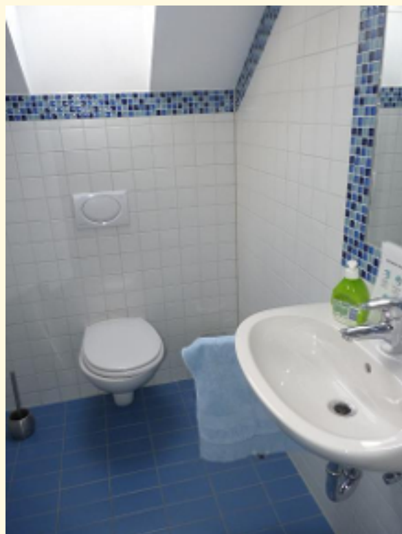
06 - 2. Toilette