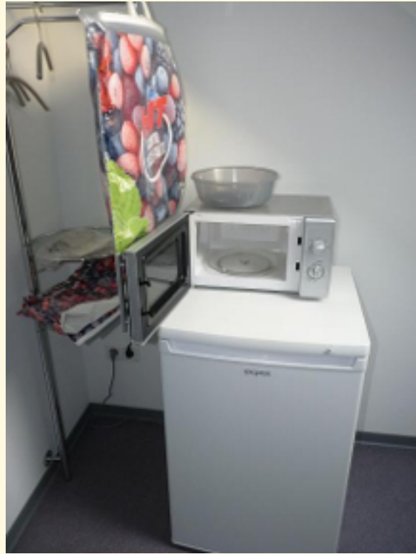
08 - Gaderobe Ansicht 2