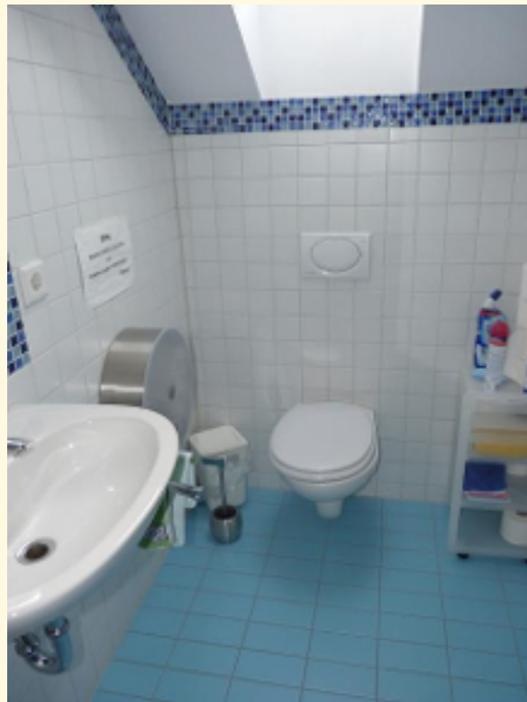
05 - 1. Toilette