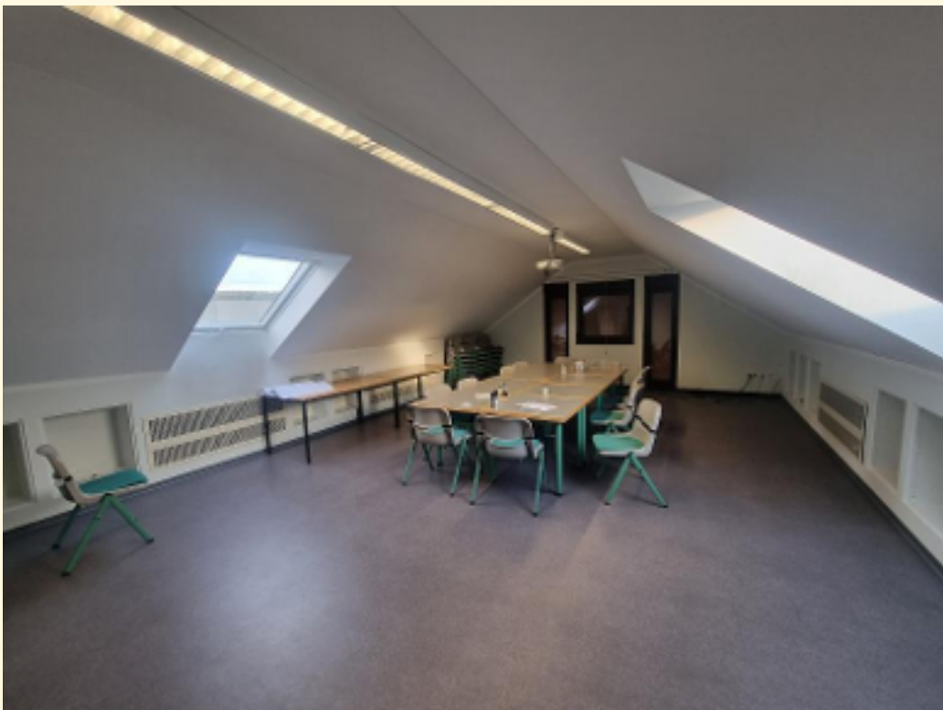
11 - Tagungsraum Ansicht 3