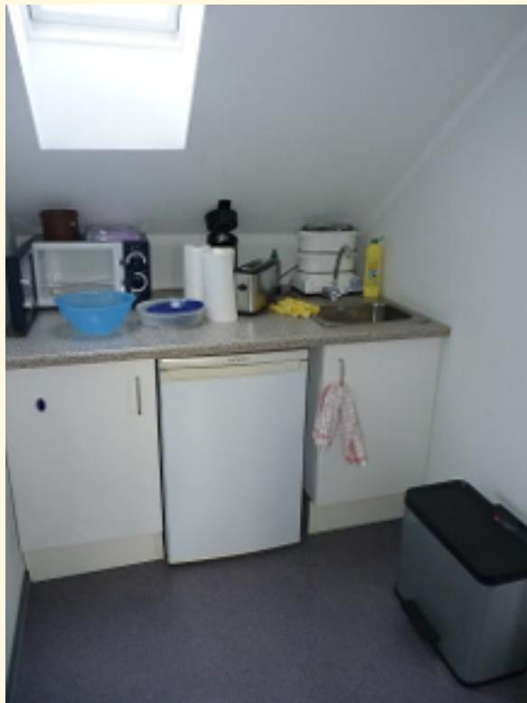
07 - Teeküche