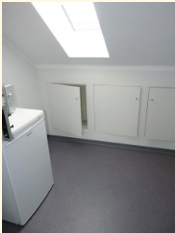
08 - Garderobe