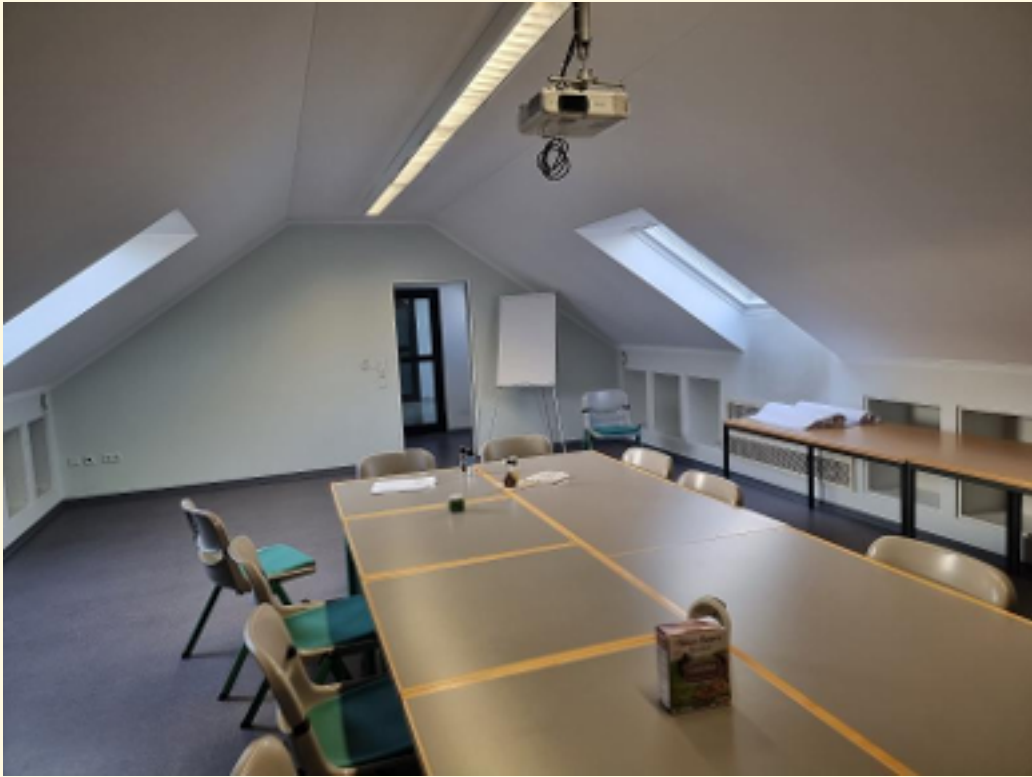
11 - Tagungsraum Ansicht 1