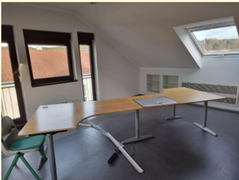
01 - 1. Büroraum Ansicht 2