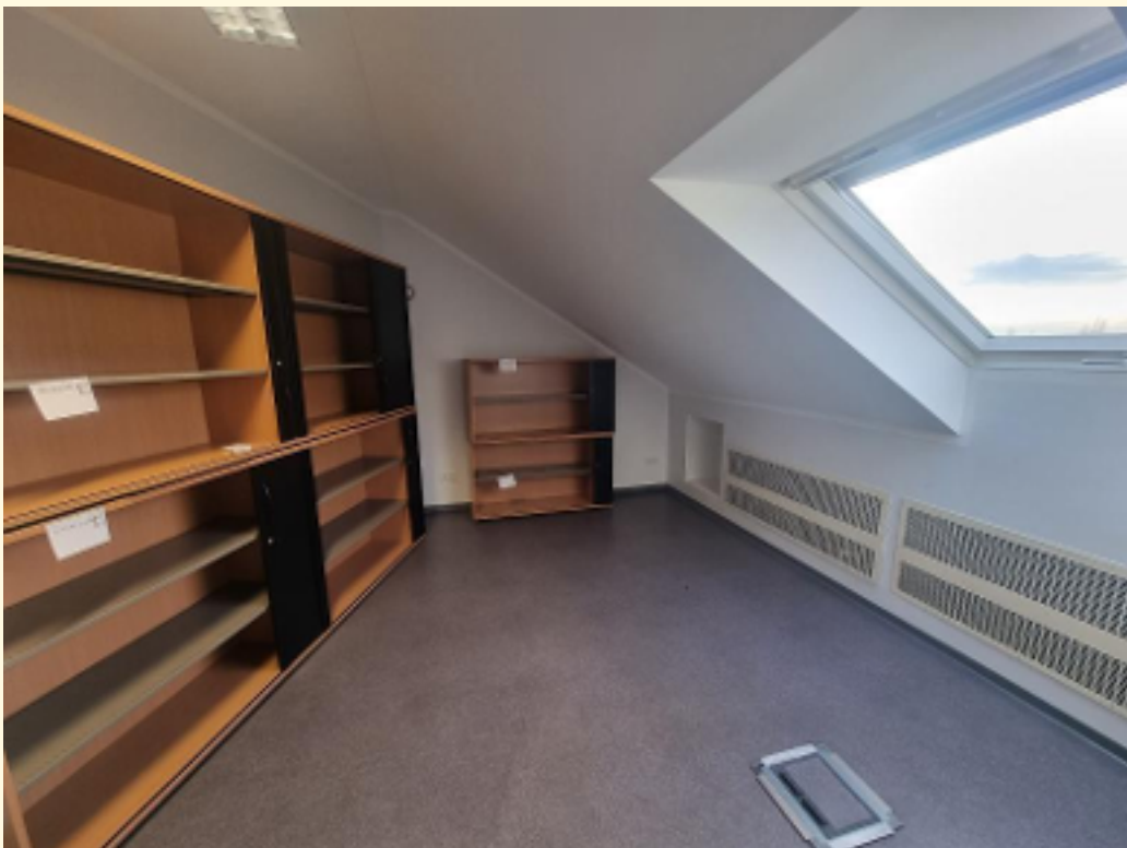
04 - 3. Büroraum Ansicht 3