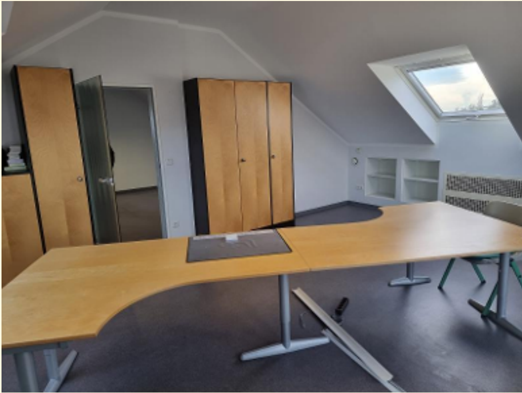
01 - 1. Büroraum Ansicht 5