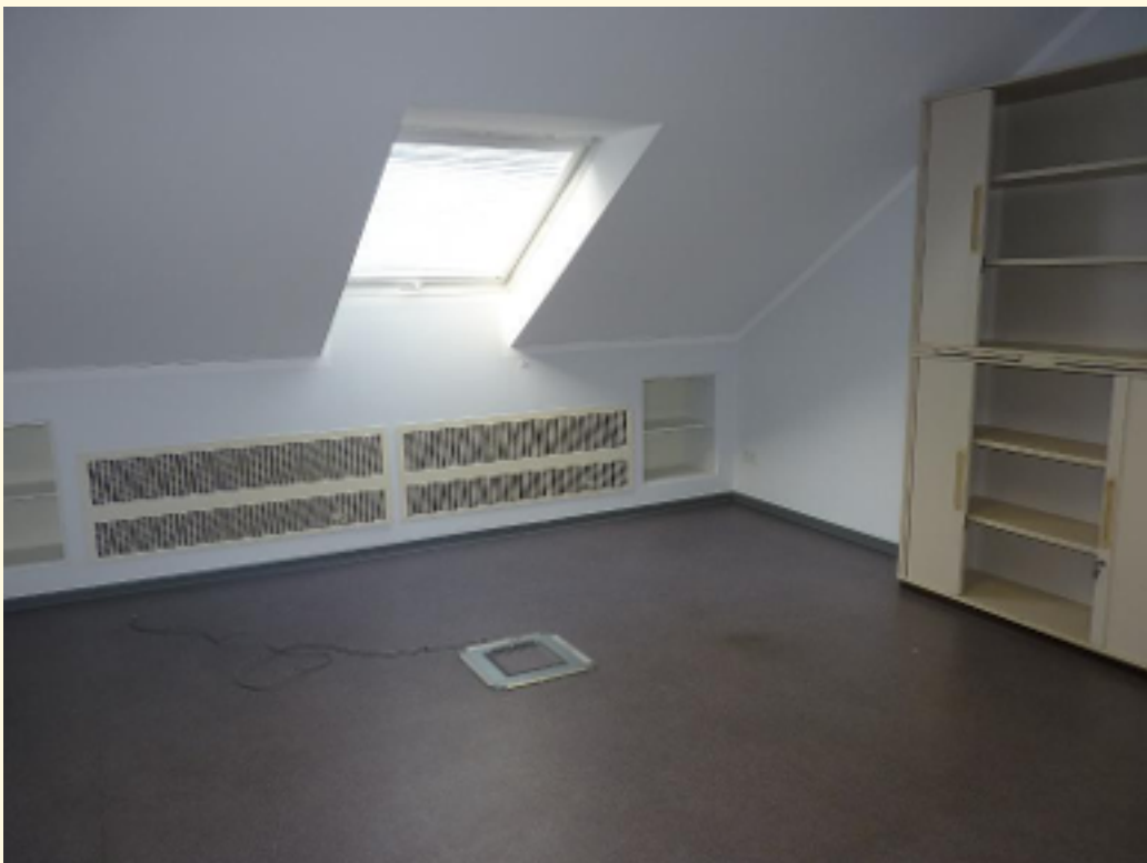
02 - Offener Büroraum Ansicht 1