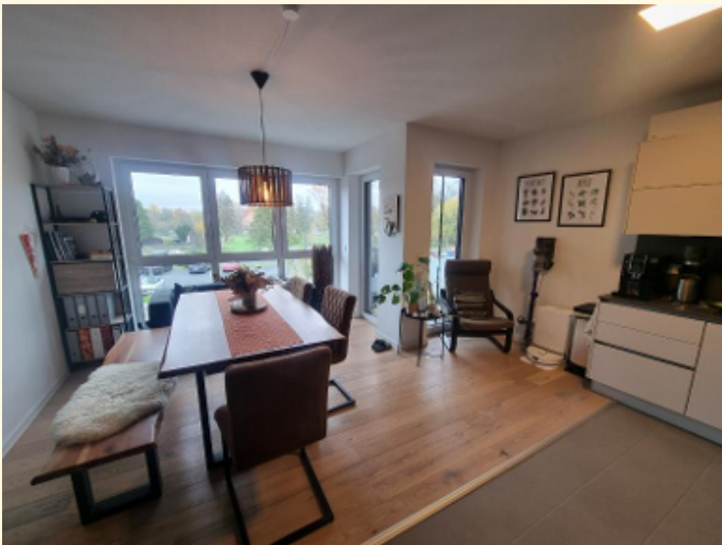
01 - Wohn-Essbereich b