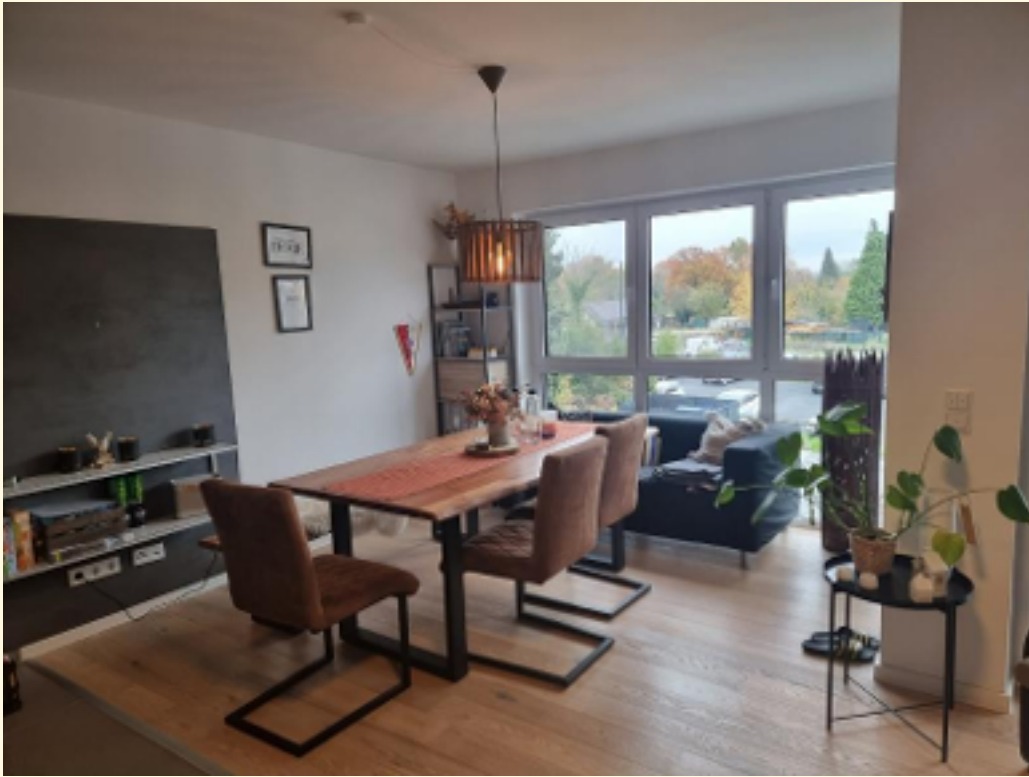
01 - Wohn-Essbereich c