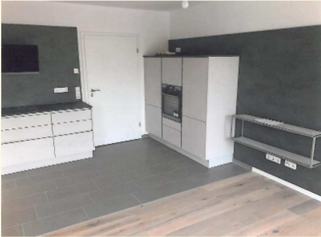
03 - hochwertige EBK b