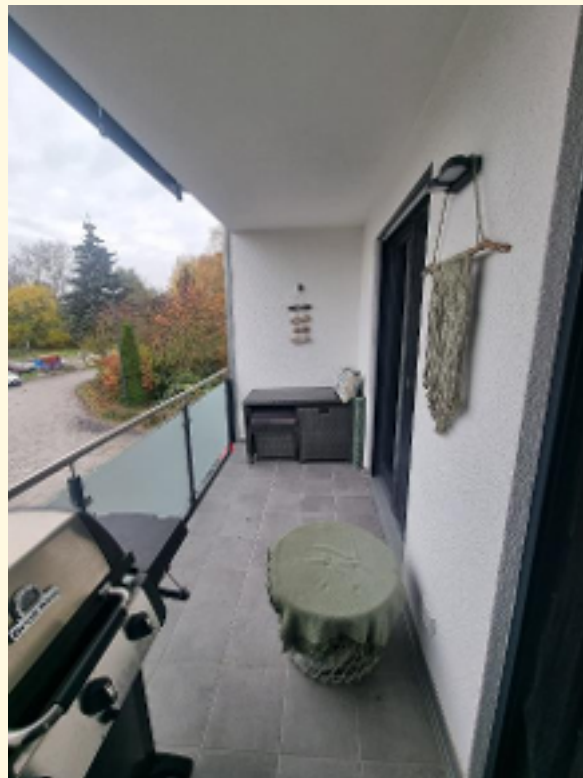
05 - Balkon