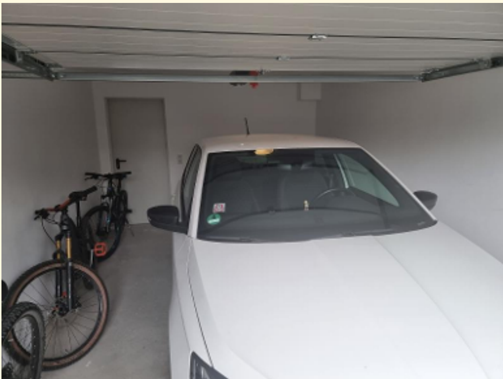
18 - Garage Innen