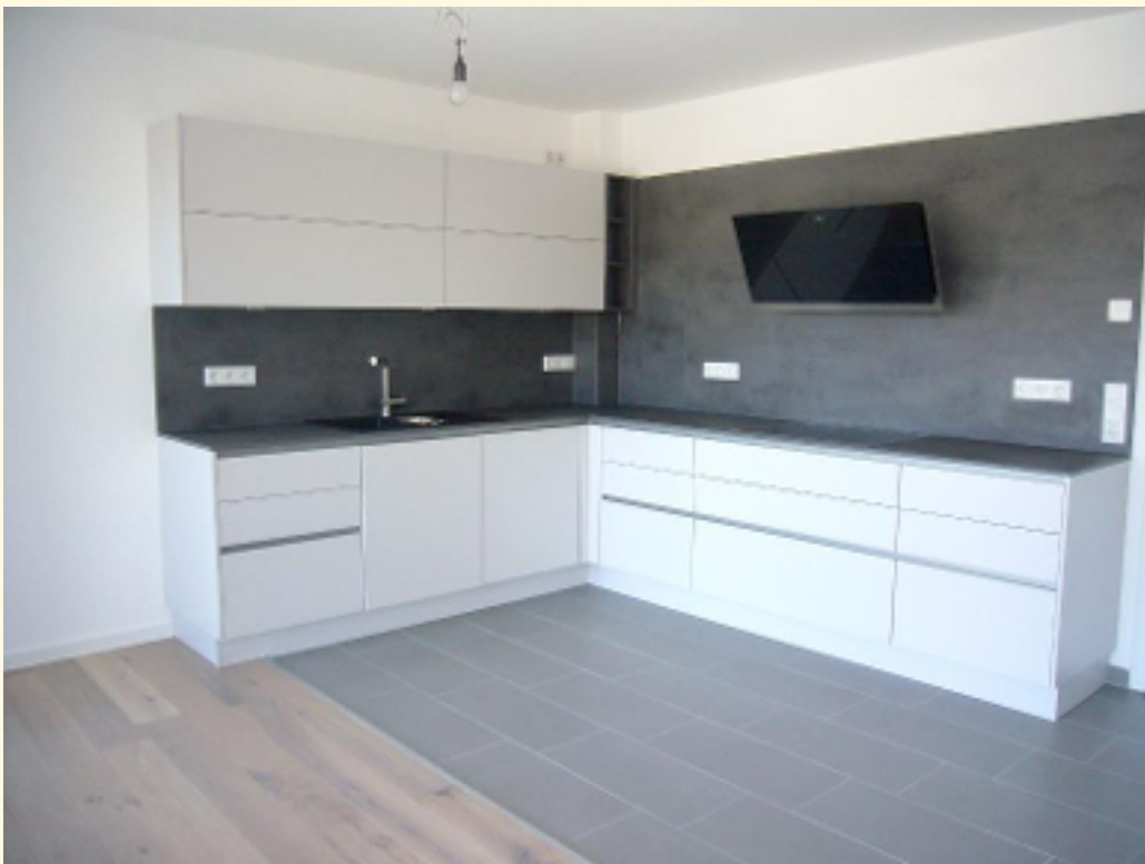
03 - hochwertige EBK a