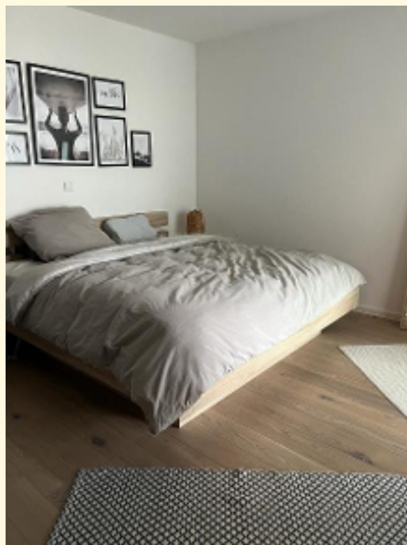
16 - Schlafzimmer