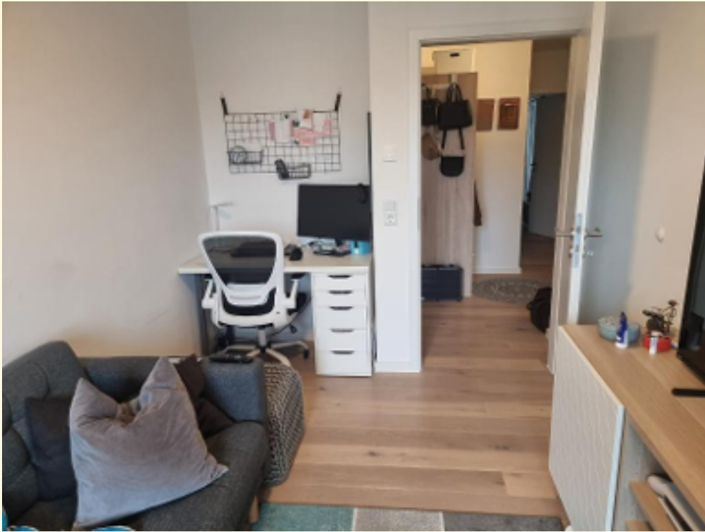
13 - Büro, Kinder, Gäste