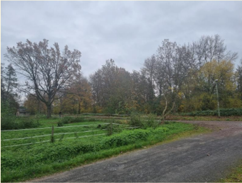
20 - Natur nah