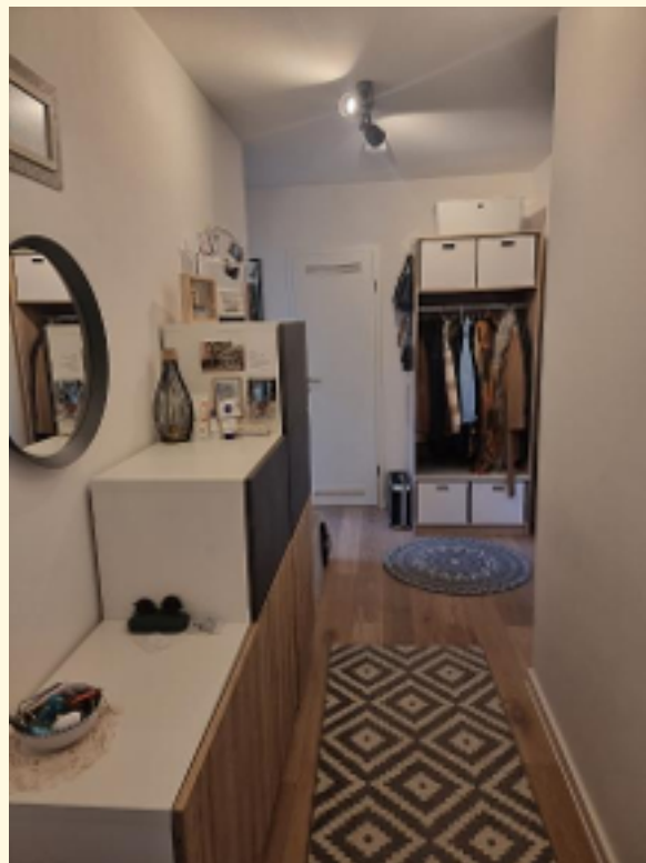
08 - Flur