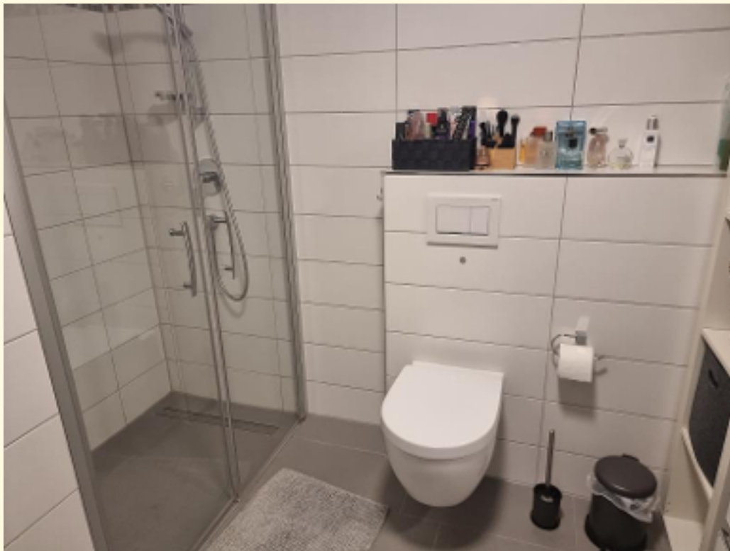
15 - Badezimmer