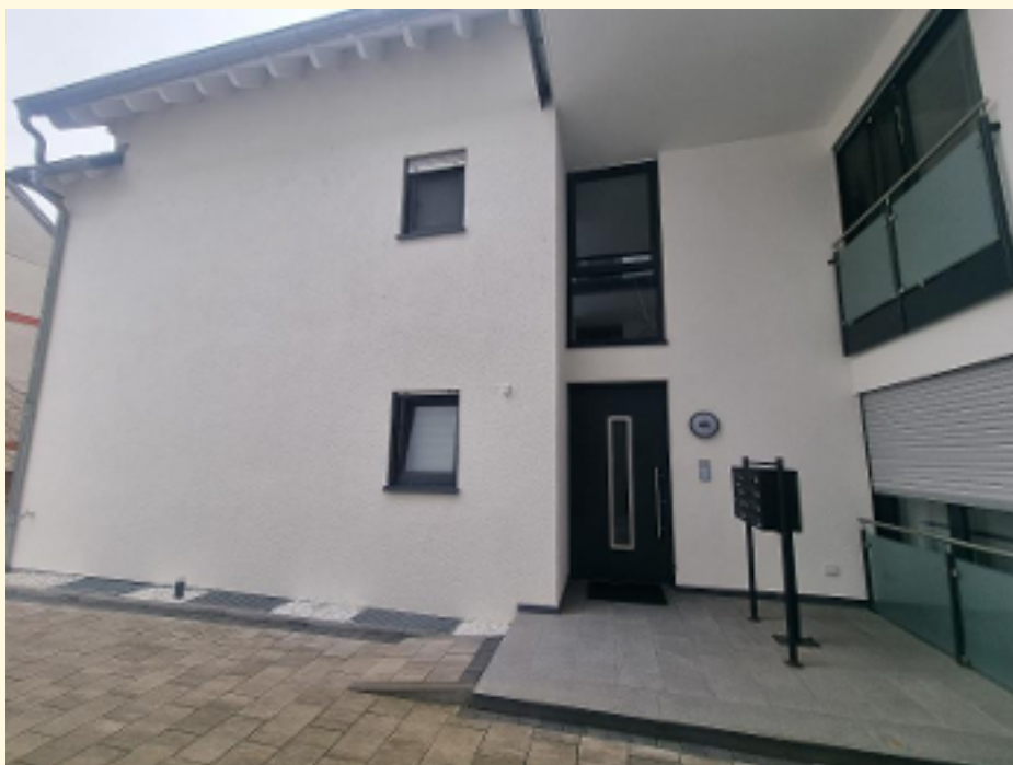
001 - Eingangsbereich