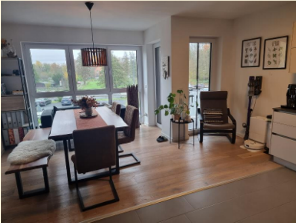
01 - Wohn-Essbereich a