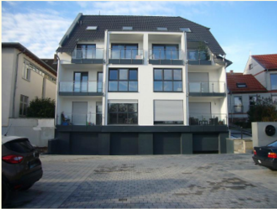
00 - Aussenansicht