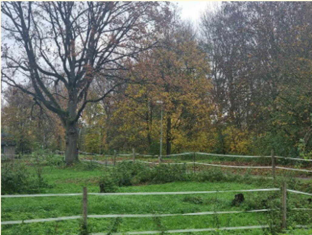
21 - Kahlwiesen und Fluss Kahl