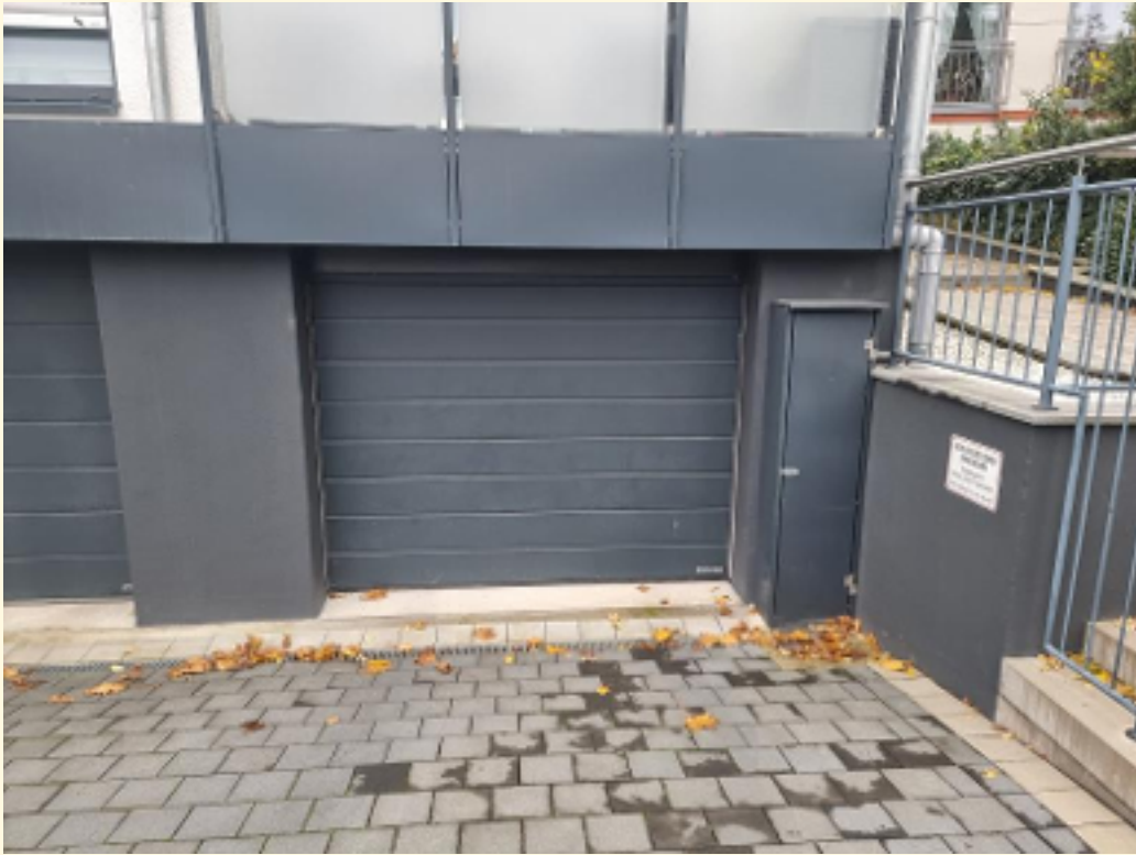
17 - Garage Außen