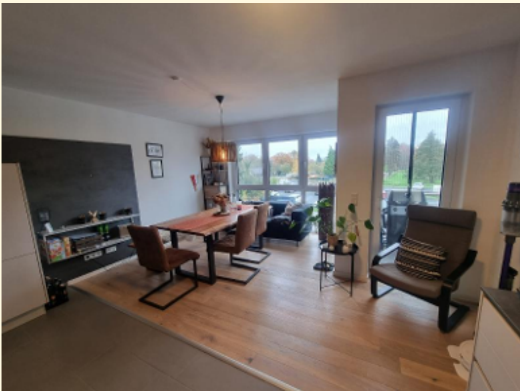
02 - Wohn-Essbereich d