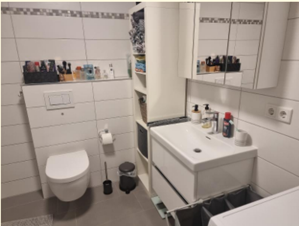
14 - Badezimmer