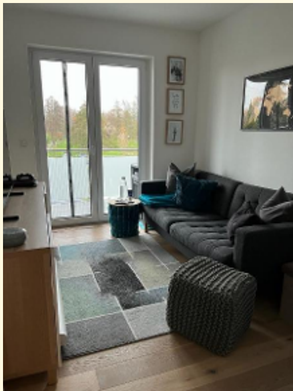
12 - Büro, Kinder, Gäste