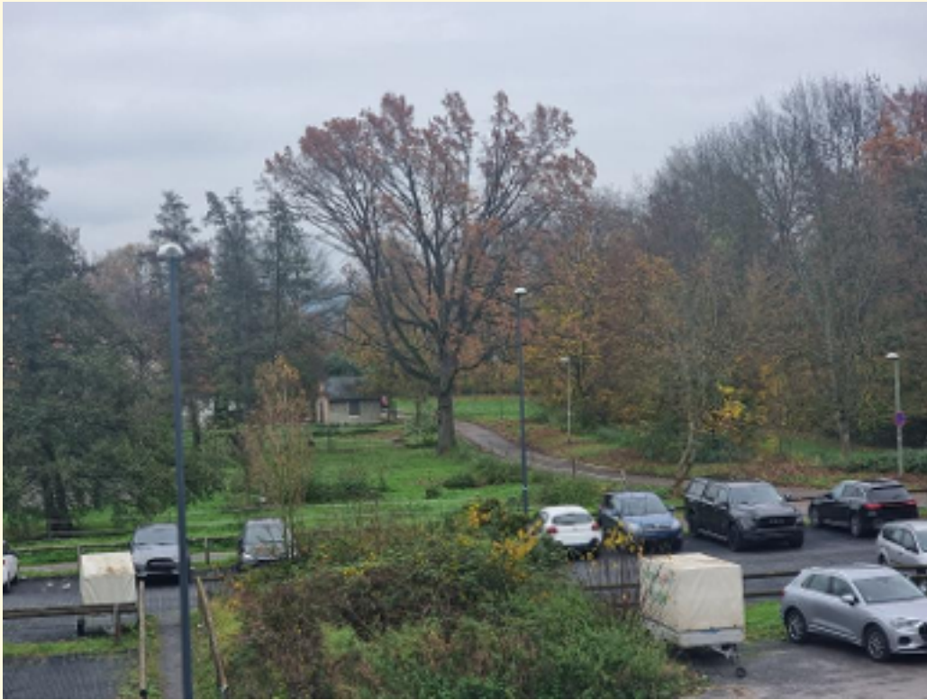
07 - Blick von Balkon