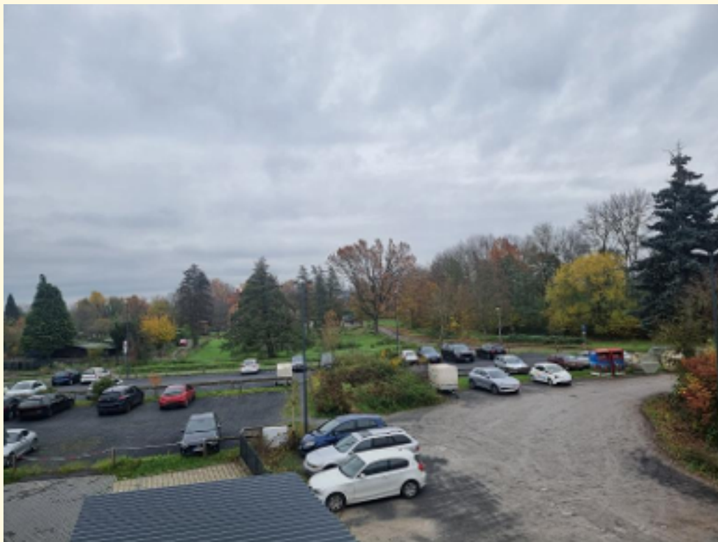
06 - Blick von Balkon