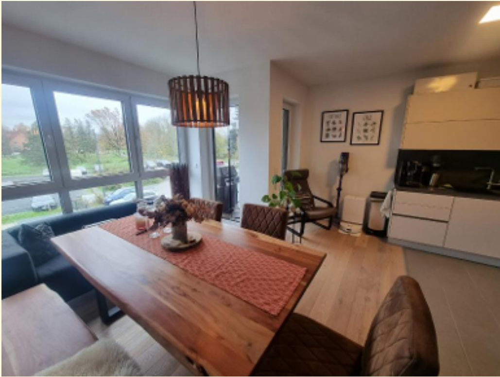
02 - Wohn-Essbereich e