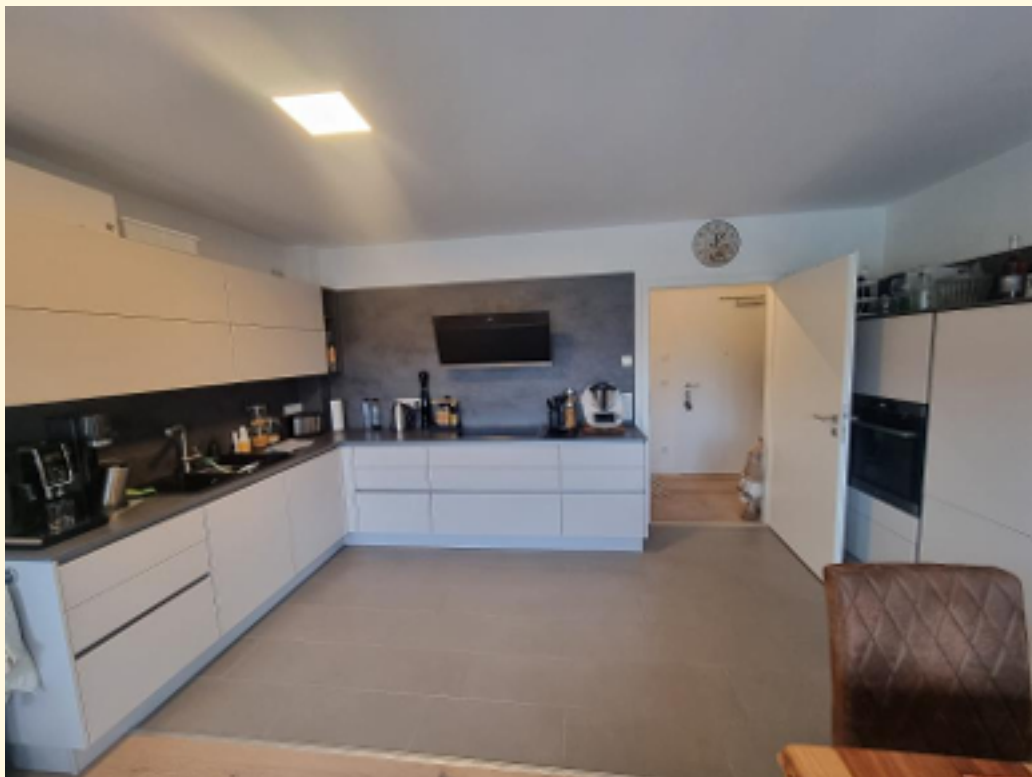
04 - integrierte Küche