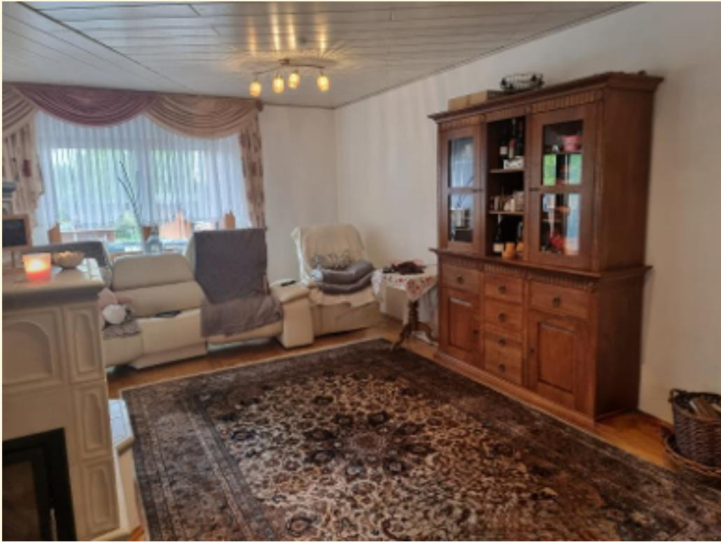
03 - Wohnbereich