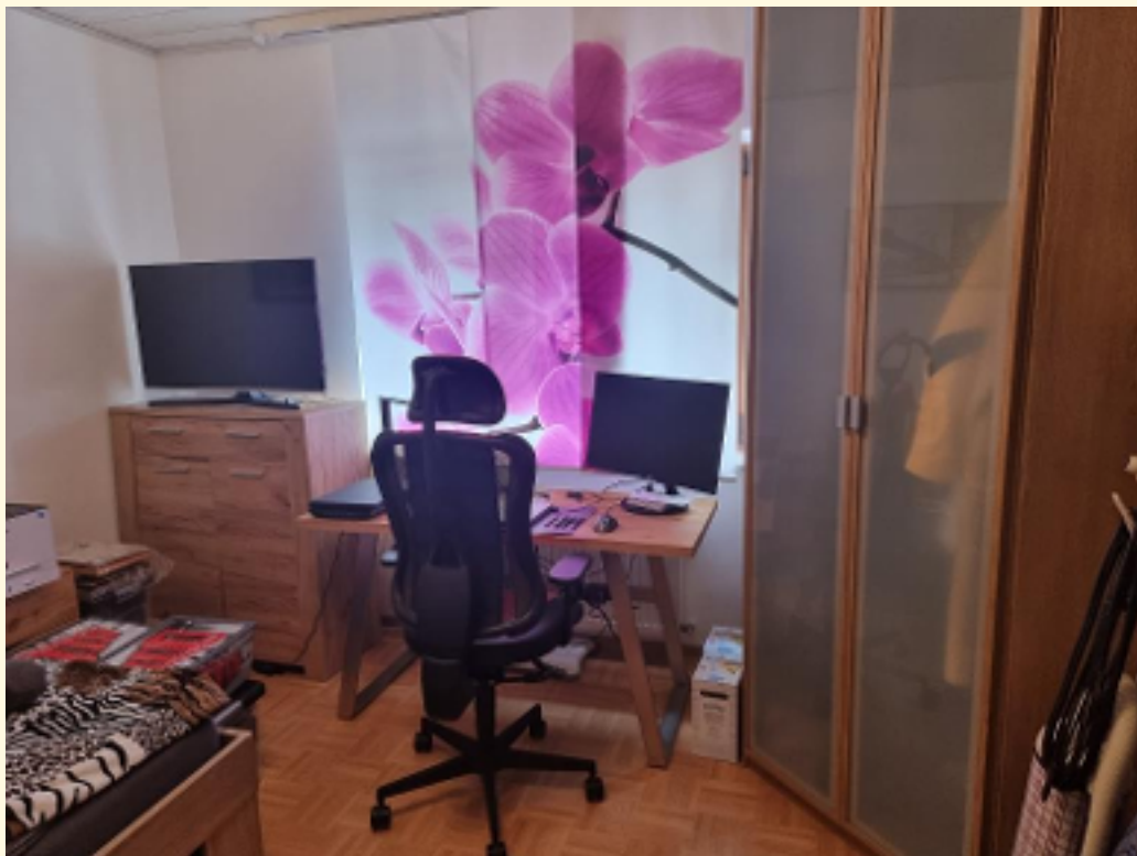
10 - Arbeitszimmer