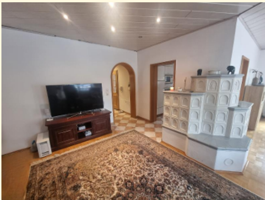
02 - Wohnbereich