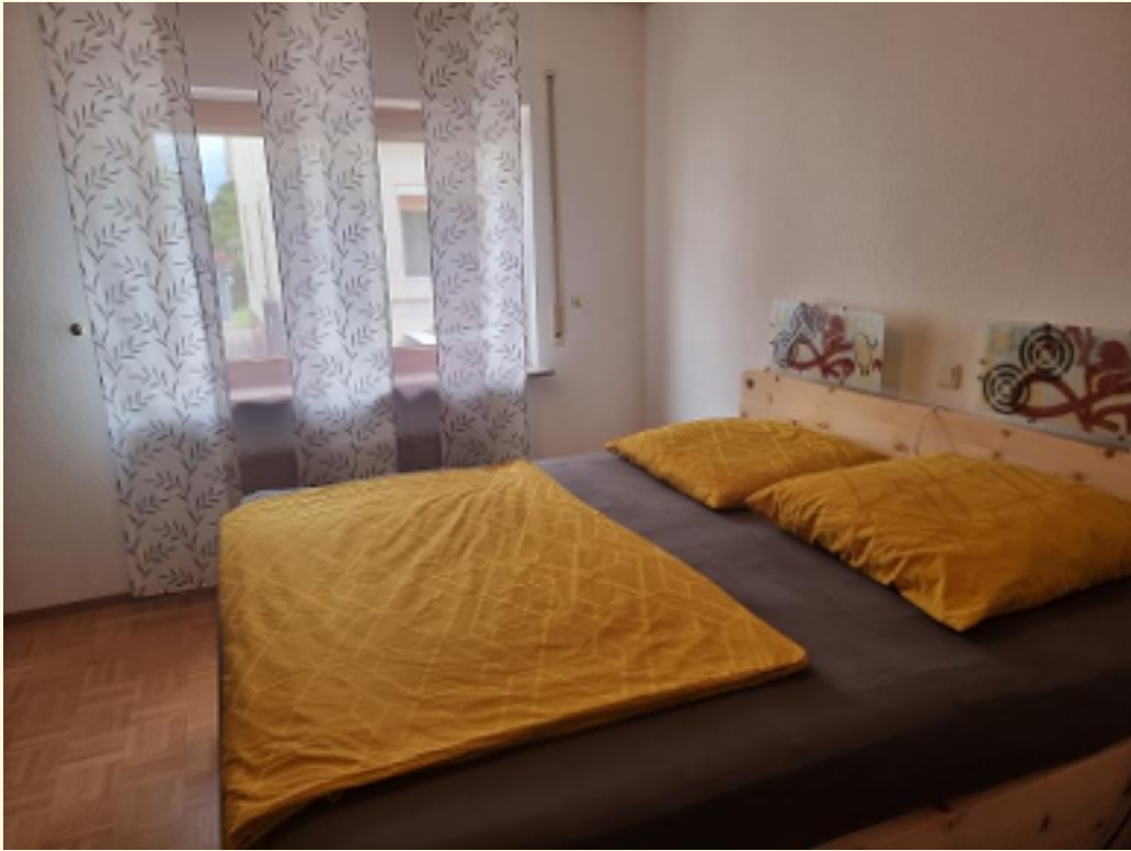
11 - Schlafzimmear