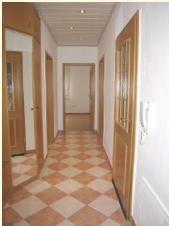
04 - Flur