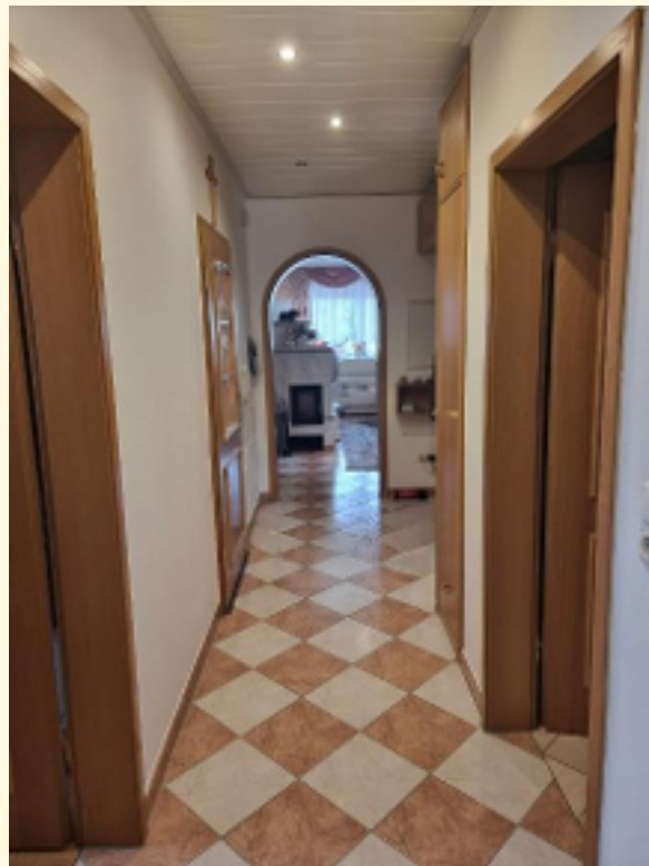
05 - Flur