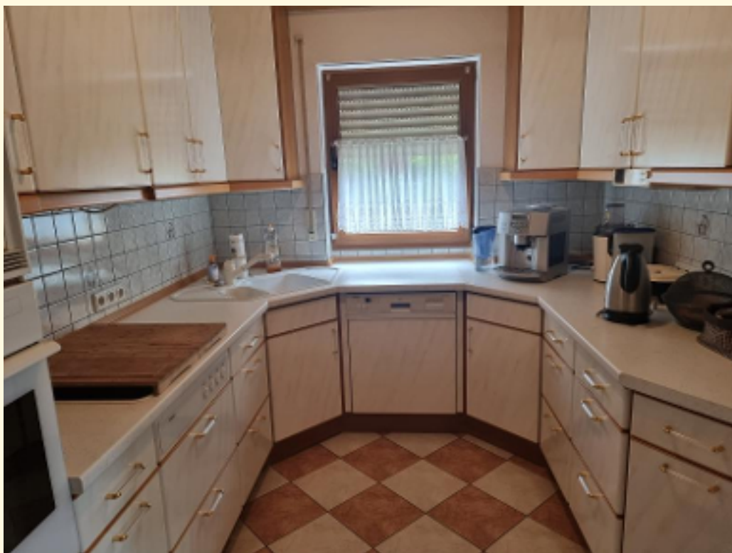
06 - Küche