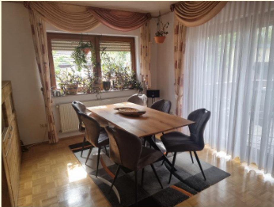
01 - Essbereich