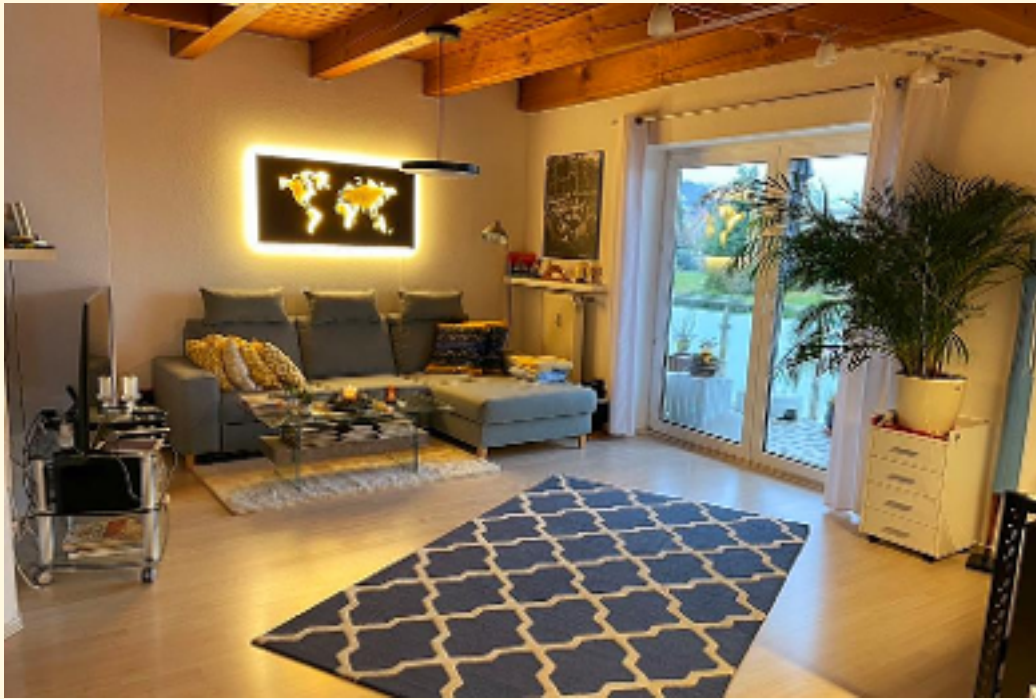
01 - Wohn-Esszimmer