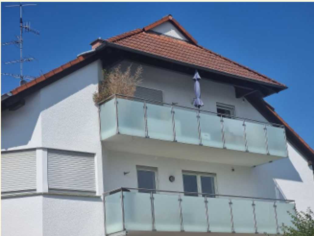
16 - Balkon Außen