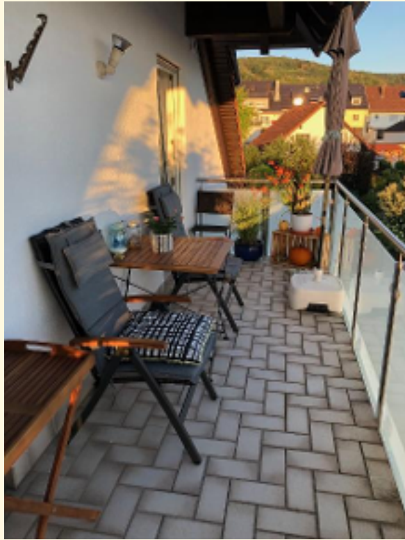
04 - Balkon