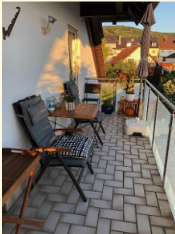
04 - Balkon