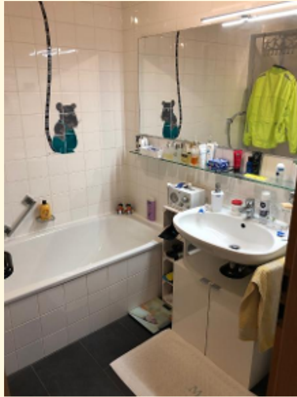
11 - Badezimmer