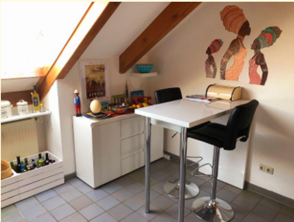
10 - Küche