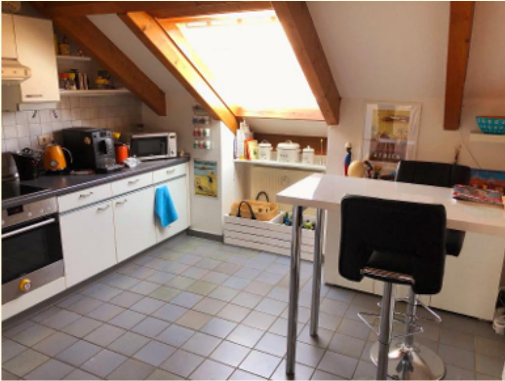
09 - Küche