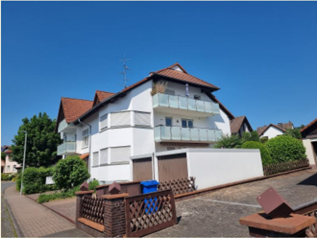
15 - Außenansicht