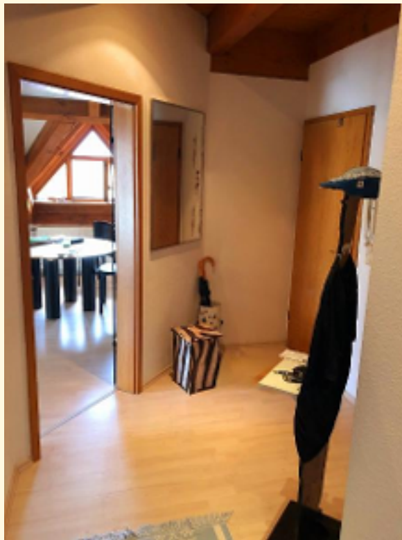
13 - Flur