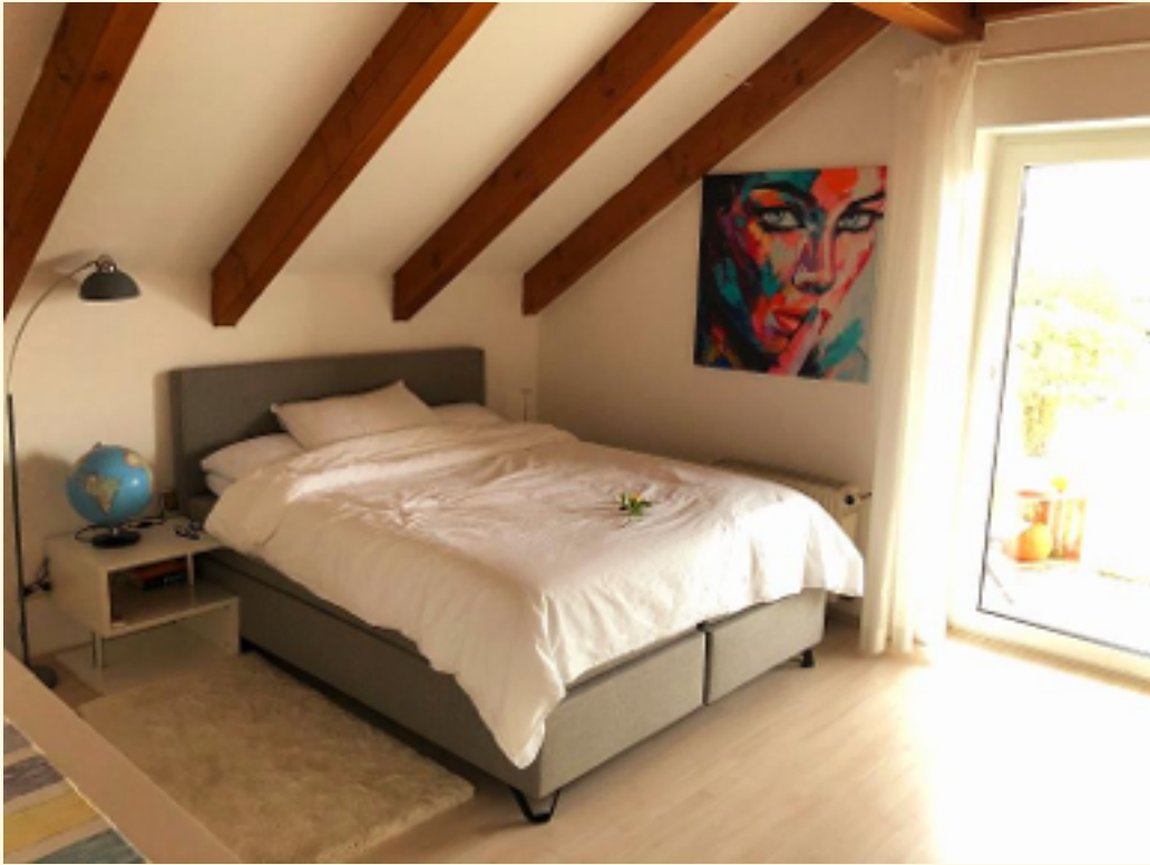
06 - Schlafen