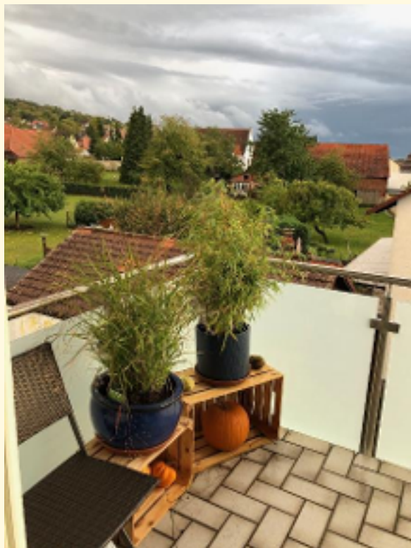
05 - Balkon Ausblick