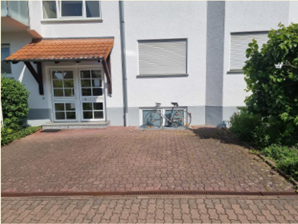
17 - Stellplätze