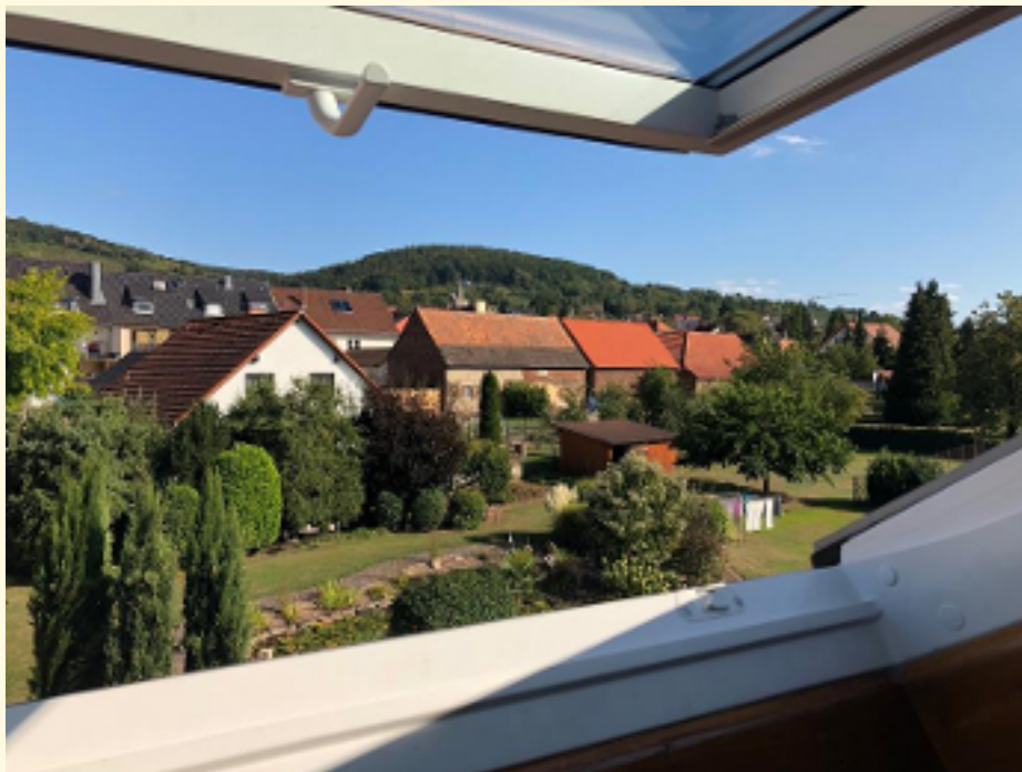
03 - Ausblick