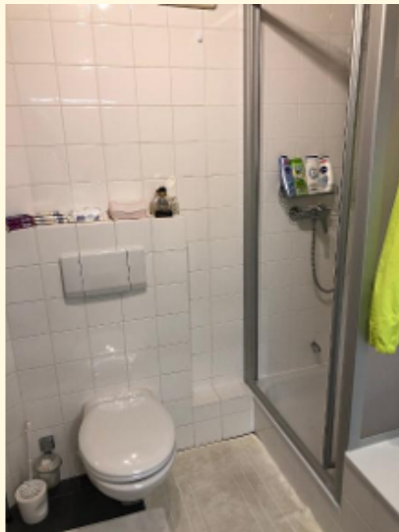
12 - Dusche