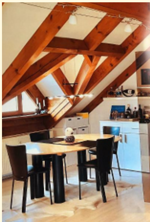
14 - Essbereich