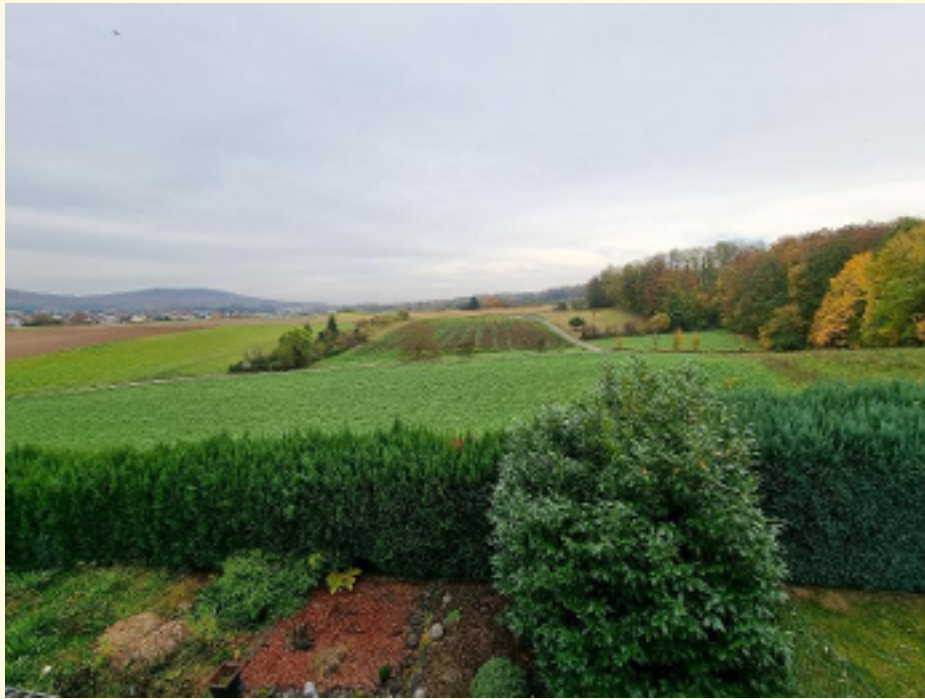
Ausblick vom Schlafzimmer