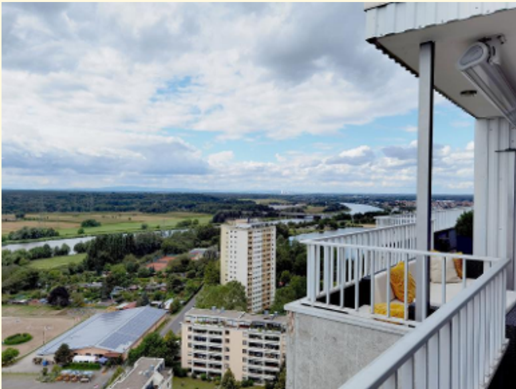
04-dem Himmel ganz nah