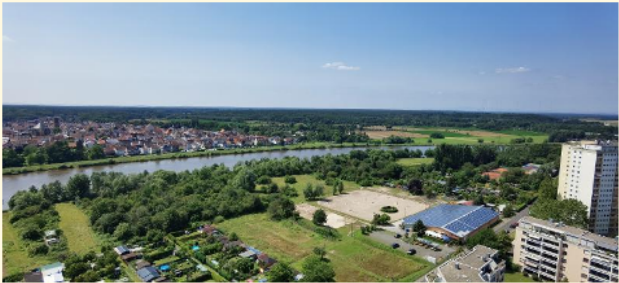
17-Blick von Terrasse