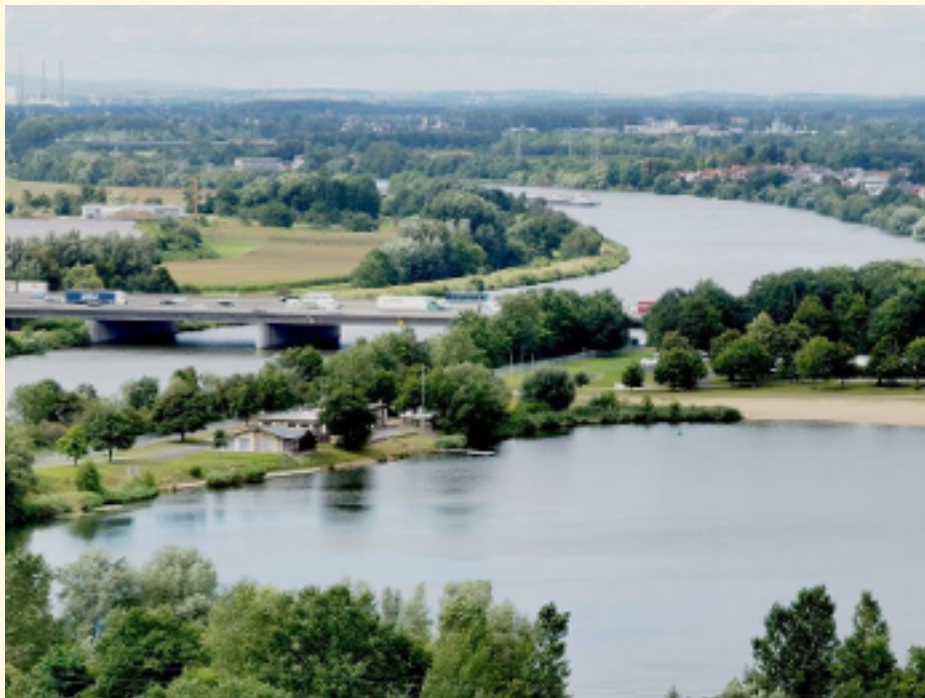
02-Blick auf Main und See