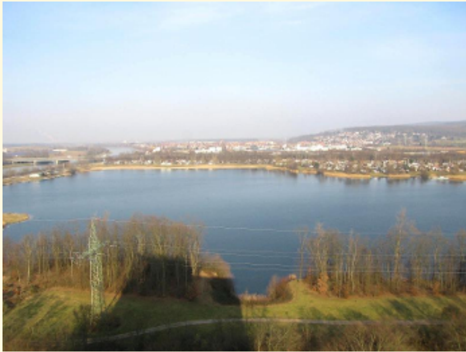
01-Blick vom Balkon