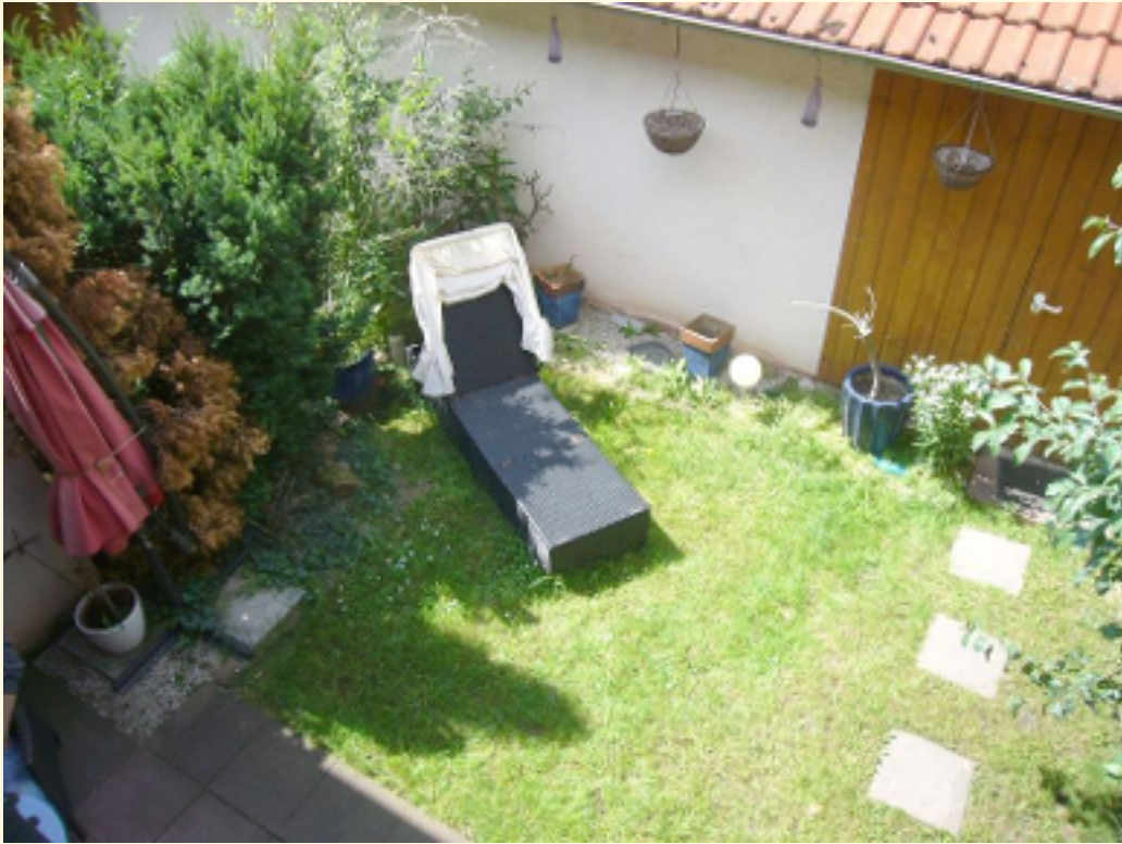
12-Blick vom Balkon