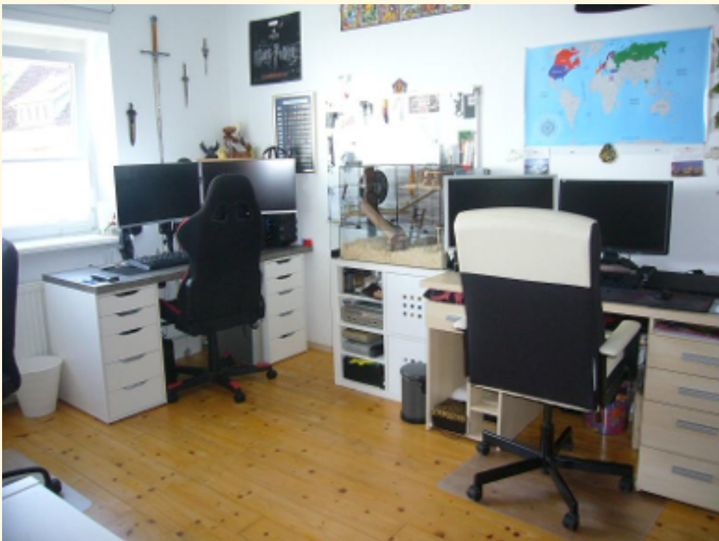
12-Büro od. Kinderzimmer